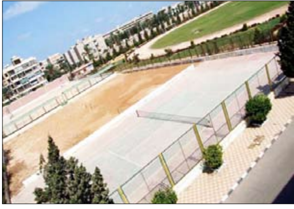
■ إستاذ التنس الذي توقف العمل به