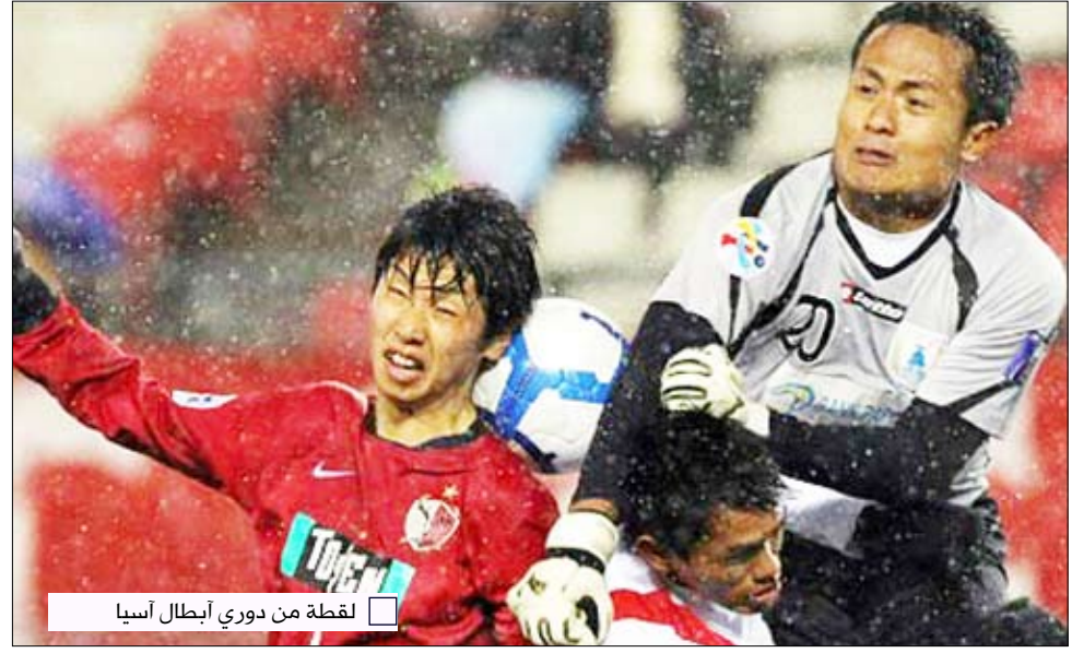
□ لقطة من دوري أبطال آسيا

ولم يجد كاشيما صعوبة في تحقيق الفوز الساحق على ضيفه الإندونيسي بخمسة أهداف سجلها تورا أريبا وميتسو أوغساوارا ويوبا أوساكو في