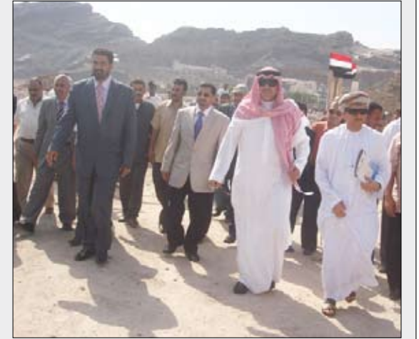
■ لجنة أمعاء سر الاتحادات الخليجية في زيارتهم السابقة الى عدن

وستقوم اللجنة الثلاثية بزيارة محافظة عدن لمعرفة ما تم في جانب الاستعدادات منذ زيارتها الأخيرة في شهر ديسمبر الماضي .. ورفع تقرير عن نتائج زيارتها يشمل نسبة الإنجاز وسير العمل في مختلف المنشآت الرياضية الخاصة بالبطولة الخليجية.