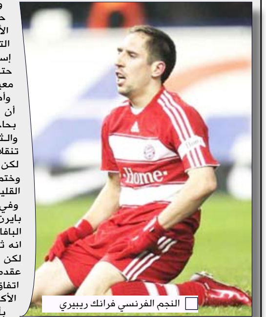
□ النجم الفرنسي فرانك ريبيري

وفي حال قرر ريبيري أن يَنتهي ارتباطه مع بايرن في يونيو المقبل فسيجعل النادي البافاري على مبلغ «محترم» للغاية خصوصاً أنه تمثّن نجمة الفرنسي 80 مليون يورو، لكن في حال قرر الاحتفاظ به حتى نهاية عقده في 2011 دون أن يتوصل الطرفان إلى اتفاق حول التمديد، فسككون ريبيري الرابع الأكبر لأنه سينال مبلغ صفقة الانتقال بأكمله لأنه سيصبح لاعباً حراً.