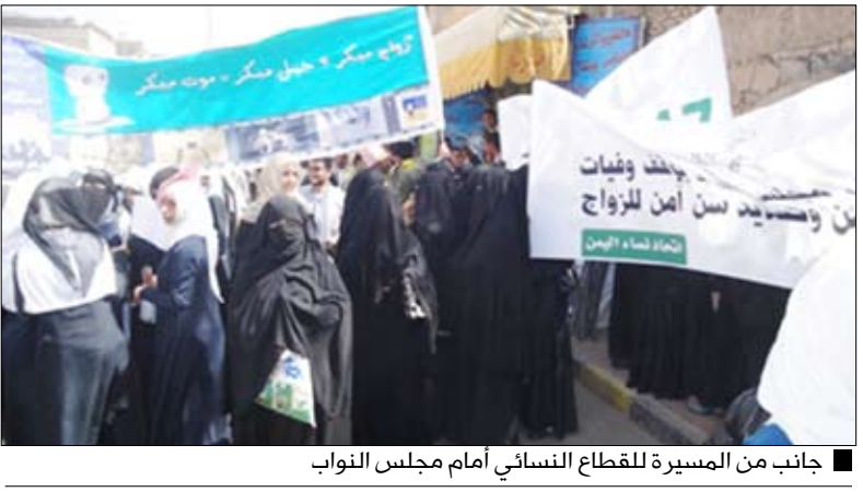
جانب من المسيرة للقطاع النسائي أمام مجلس النواب

سنعاء / سبأ: أكد رئيس مجلس النواب يحيى علي الراعي الأهمية التي يوليها البرلمان لقضية المرأة بصفة عامة باعتبارها عماد بناء الأسرة والمجتمع بشكل عام. ولفت لدى استقباله أمس عدداً من ممثلات القطاع النسائي إلى أن هذا الاهتمام يتجلى من خلال التشريعات وسن القوانين التي يضطلع بها البرلمان في سياق نشاطه التشريعي ويجسد تطبيقاتها بواسطة المتابعة الدائمة عبر صلاحياته في مجال العمل الرقابي. وتطرق إلى مسألة تعديل المادة 15 من قانون الأحوال الشخصية التي تربط بقضية زواج الفتاة. مؤكداً أنها تحظى باهتمام المجلس ويدرسها بعمق عبر لجانها المختصة ومن خلال النقاش العام وإبداء الرأي النهائي بشأنها في المجلس. فيما أكدت ممثلات القطاع النسائي ضرورة العناية بهذه القضية واعطائها الجهد الكافي بما يحقق الأهداف النبيلة المتوخاة منها.