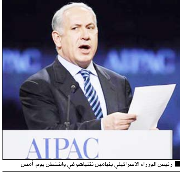
رئيس الوزراء الاسرائيلي بنيامين نتينهاو في واشنطن يوم أمس