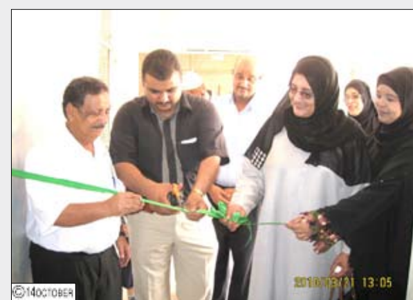
من فعاليات تكريم الأمهات المثاليات في مدارس المعلى