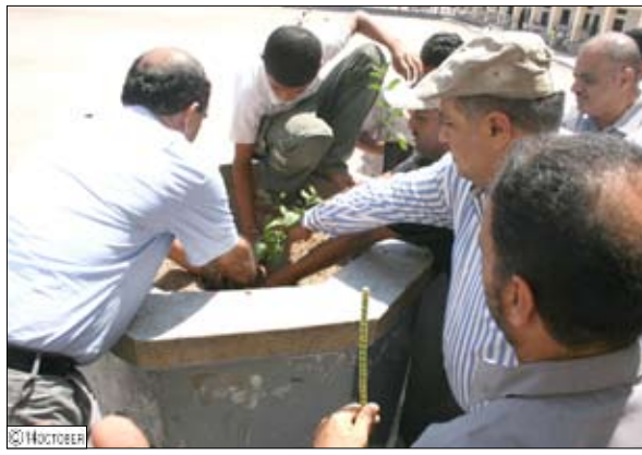
مدير عام مديرية صيرة خلال غرس مئات الشتلات في المديرية

من خلال نقل المرافق العامة إلى خارج المديرية وتشبيد بدلاً منها مدرسة للتعليم الأساسي وأخرى للتعليم الثانوي ومحطة كهرباء ومعهد فني.