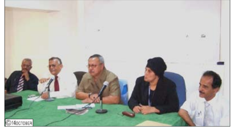
د. بن حبتور يترأس اجتماعاً لعمداء كليات الطب والأسنان والصيدلية

كما اصدر القرار رقم ( 965 ) لعام 2009م بشأن تشكيل لجان للتحقيق في المخالفات