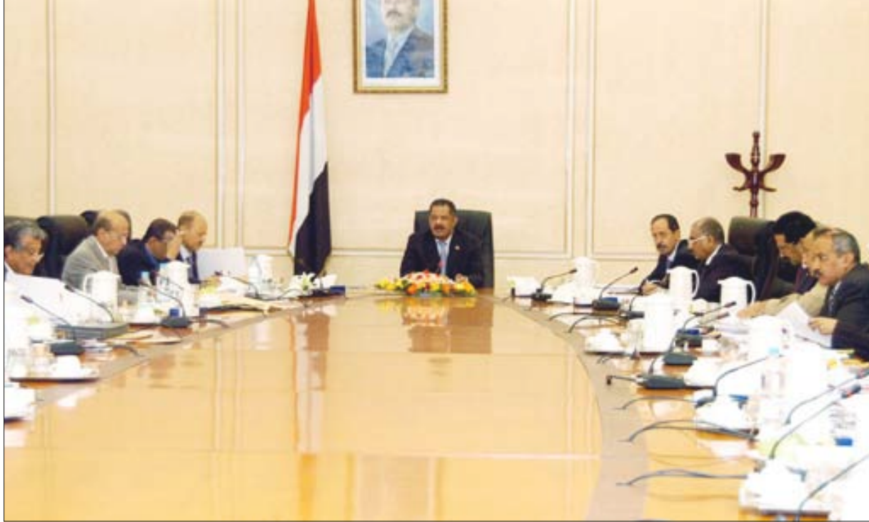
د. مجبور يترأس اجتماعاً لمجلس الوزراء