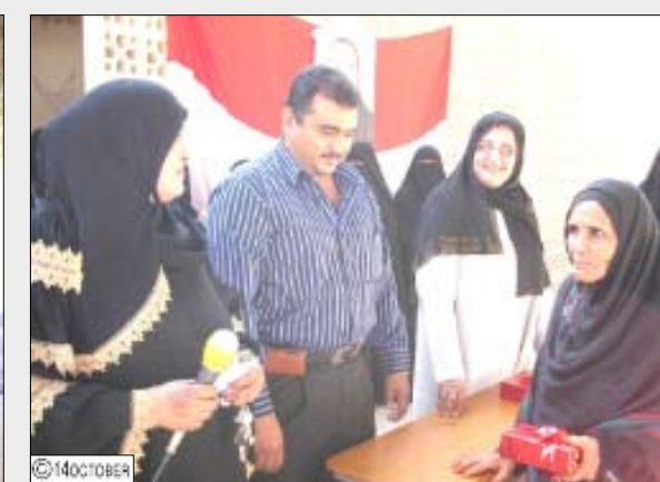
من فعاليات تكريم الأمهات المثاليات في مدارس المعلى