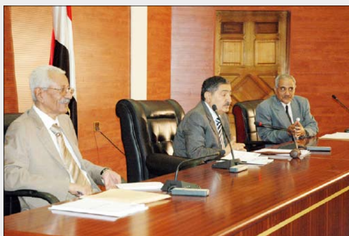
عبدالعزیز عبدالغني يترأس اجتماع مجلس الشورى

وأكد التقرير أهمية التعليم باعتباره المدخل الأساسي لنهضة الشعوب وتقدمها، واصفاً الاستثمار في التعليم بأنه أكثر الاستثمارات من حيث العوائد، محمداً عناصر العملية التعليمية، التي قال إنها تشمل الطلاب في مرحلة التعليم بكل مستوياته، والمعلم والأساتذة الجامعي، والمناهج التعليمية، والعوامل المؤثرة في العملية التعليمية.