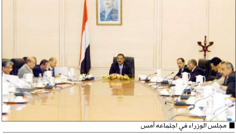
مجلس الوزراء في اجتماعه أمس (التفاصيل من 3)

سنعاء / سبأ: أقر مجلس الوزراء في اجتماعه الأسبوعي أمس برئاسة رئيس المجلس الدكتور علي مجور مجموعة من الإجراءات للحد من التطورات في فاتورة الاستيراد، وتأثيراتها السلبية على الموازين المالية والاقتصادية والاستقرار النقدي، وذلك بترشيح استهلاك السلع الكمالية والترفيحية بما يخفف الضغط على ميزان المدفوعات. و تحويل كافة أرصدة المؤسسات والهيئات العاصمة البنك المركزي من الدولار إلى الريال، بما من شأنه تعزيز دور البنك المركزي في إدارة السياسة النقدية وخدمة الاستقرار النقدي. وناقش المجلس المذكورة الخاصة بتحديد الموعد القانوني للانتخابات الداخلية للهيئات الإدارية والمحلية وأقر إجراء الانتخابات يوم الأحد الموافق 2 مايو 2010م. وأحال مجلس الوزراء مشروع قانون الإعلام السمي والبصري والإلكتروني المقدم من وزير الإعلام إلى لجنة وزارية ووافق على مشروع قانون صندوق رعاية المغتربين.