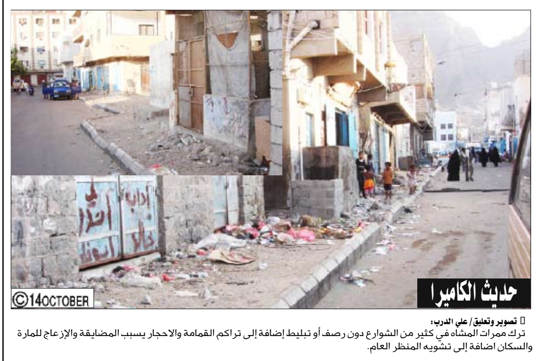
حادثة الكابيرا تصوير وتعليق/ علي الغريب: ترك ممرات المشاة في كثير من الشوارع دون رصف أو تلميط إضافة إلى تراكم القمامة والاحجار يسبب المضايقة والإزعاج للمارة والسكان إضافة إلى تشويه المنظر العام.