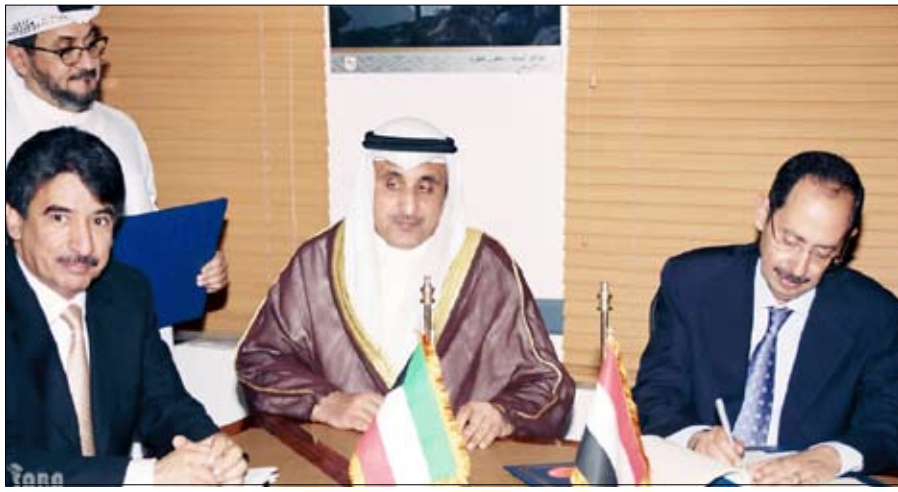
د. الراجحي يوقع اتفاقية مع الصندوق الكويتي للتنمية

المساهمة في تمويل مشروع ميناء سقطرى الذي يواجهه الطلاب على النقل البحري للأمن للضائع والركاب بين الجزيرة والموافين اليمنية والدولية حيث تشمل أعمال الصمغ البحري ومراجعة التصميم التفصيلية والأشراف على التنفيذ . حضر توقيع الاتفاقية وزير النقل خالد الوزير ووكيل وزارة التخطيط والتعاون الدولي لقطاع برمجة المشاريع المهندس عبدالله الشاطر ورئيس وحدة تنسيق المساعدات الخارجية بوزارة التخطيط والتعاون الدولي نبيل عيسى وشيخان مدير عام الشؤون القانونية بالوزارة الدكتور أحمد قلامه والسفير الكويتي بصنعاء سالم غصاب الزمان .