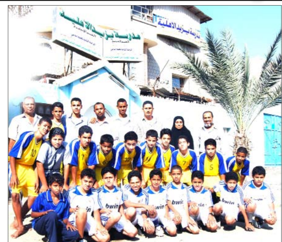
فريق مدرسة يزيد الداعم للبطولة