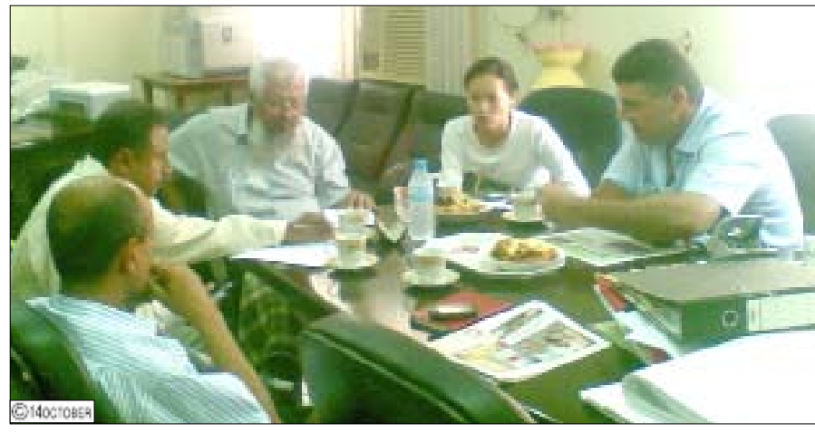
لقاء لمدير صندوق النظافة في عدن مع فريق العمل بوزارة الإدارة المحلية

أن هذا التنسيق قد شكل أحد العوامل المهمة في إنجاح جهود المانحين مع قيادة صندوق النظافة بـ عدن.