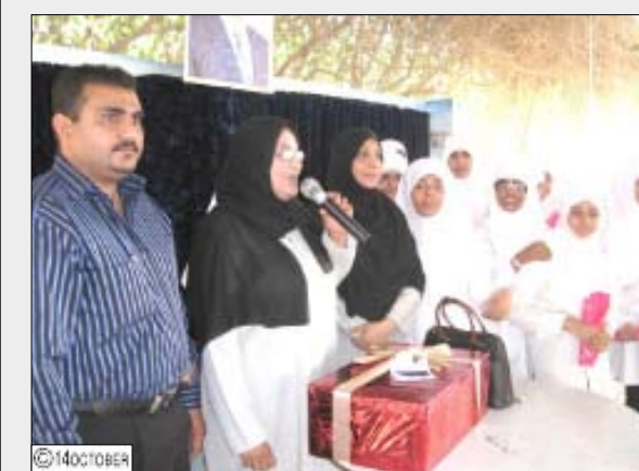
من فعاليات تكريم الأمهات المثاليات في مدارس المعلى