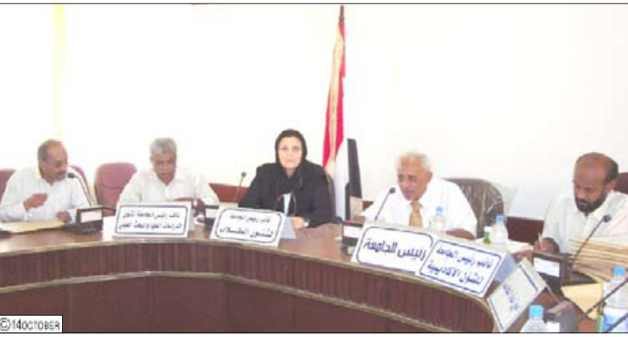
اجتماع المجلس الأكاديمي في جامعة عدن

ناقش المجلس تهيئة أعضاء الهيئة التدريسية والهيئة التدريسية المساعدة في كلية التربية بإع. وأقر المجلس في افتتاح الاجتماع محضر المجلس السابق.