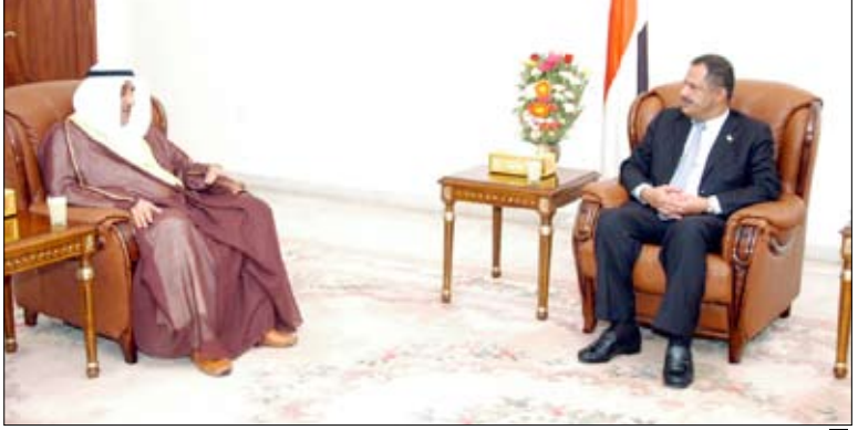
رئيس الوزراء خلال استقباله مدير عام الصندوق الكويتي للتنمية

سنعاء / سبأ: ناقش رئيس الوزراء الدكتور علي محمد مجور أمس بصنعاء مع مدير عام الصندوق الكويتي للتنمية عبدالوهاب البدر علاقات التعاون بين اليمن والصندوق في المجال التنموي وعلى وجه الخصوص سير العمل في المشاريع التي يساهم الصندوق في تمويلها. وتطرق اللقاء إلى التخصيصات المتعلقة بالمبلغ المتعهد به من قبل دولة الكويت الشقيقة لليمن في مؤتمر المنحون بلندن 2006م والبالغ 200 مليون دولار، وما تم إنجازه حتى الآن بهذا الخصوص. وعبر رئيس