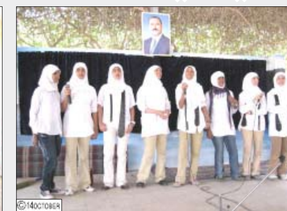
من فعاليات تكريم الأمهات المثاليات في مدارس المعلى