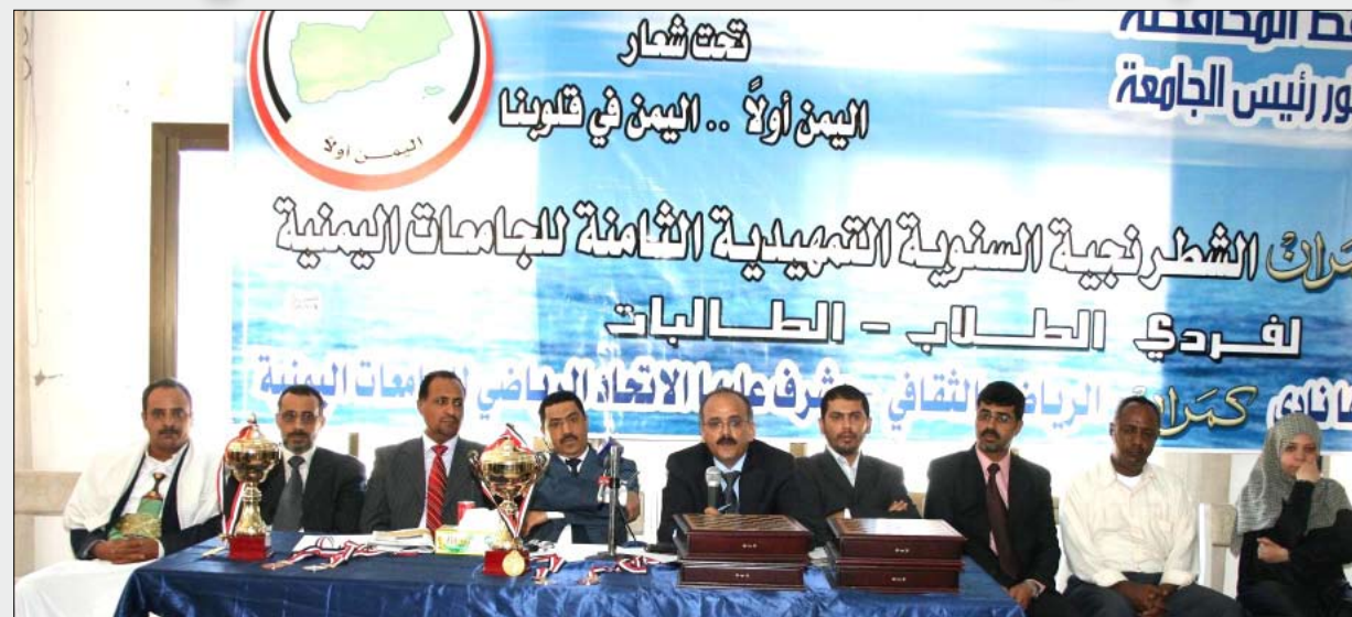
لقطات من الحضور