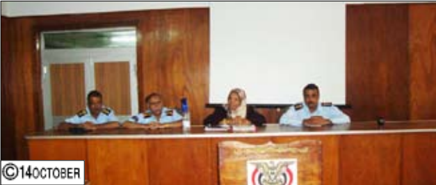
نورا ضيف الله تلقي محاضرة امام منتسبي خفر السواحل

عدن/ 14 أكتوبر: ألقت المحامي العام القاضي نورا ضيف الله رئيسة نيابة استئناف محافظة عدن أمس محاضرة مهمة أمام منتسبي خفر السواحل، قطاع خليج عدن وذلك في إطار برنامج الدورة التخصصية في مجال التحقيقات والتحريات. وقد تناولت المحاضرة مهام وصلاحيات مأموري الضبط القضائي والتحقيق في القضايا الجنائية وإعداد محاضر الضبط في قضايا التهريب والمخدرات، كما تطرقت إلى كيفية التعامل مع الجرائم المشهودة. حضر المحاضرة عدد من قيادات خفر السواحل في قطاع خليج عدن.