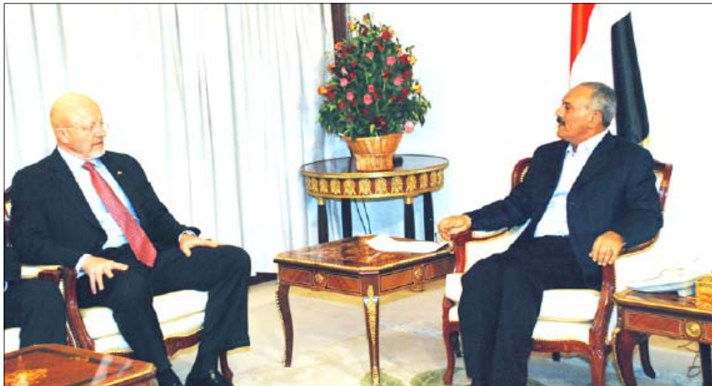
رئيس الجمهورية لدى استقباله وكيل وزارة الدفاع الأمريكية

استقبل فخامة الأخ الرئيس علي عبد الله صالح رئيس الجمهورية مساء أمس السيد جيمس كلاير وكيل وزارة الدفاع لشؤون الاستخبارات بالولايات المتحدة الأمريكية والوفد المرافق له الذي يزور بلادنا حالياً حيث جرى بحث العلاقات الثنائية ومجالات التعاون المشترك وفي مقدمتها التعاون في المجال الأمني والتدريب ومكافحة الإرهاب وخفر السواحل.. كما تناول البحث الأوضاع في منطقة القرن الأفريقي والأوضاع في الصومال وجهود مكافحة القرصنة.