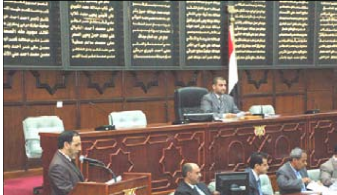
مجلس النواب في جلسته أمس

من جهة أخرى أقر المجلس حالة مشروع قانون تنظيم الصناعة ومشروع قانون المناجم والمحاجر إلى اللجان المختصة لدراستهما وتقديم النتائج إلى المجلس وذلك بعد أن استمع إلى المذكرتين الإيضاحيتين المقدمتين بشأنهما من مسؤلوي الجانب الحكومي المختص .