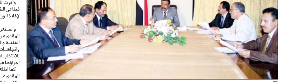
اجتماع لجنة العليا للانتخابات

كما اطلعت اللجنة على التقرير المقدم من رئيس قطاع الإعلام والتوعية الانتخابية بشأن مقترح خطة التوعية الانتخابية للانتخابات البرلمانية المتضمن توعية الناخبين