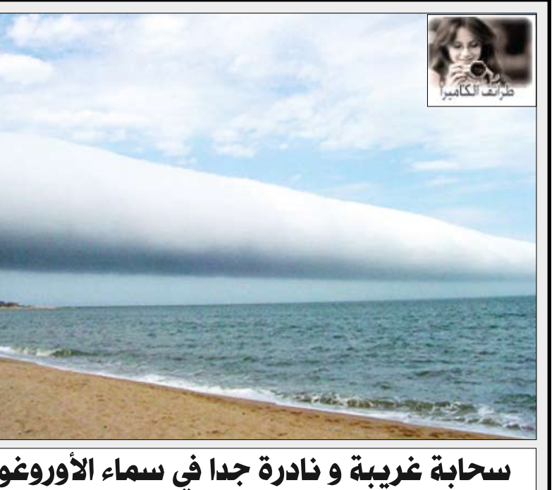
سحابة غريبة و نادرة جدا في سماء الأوروغواي !