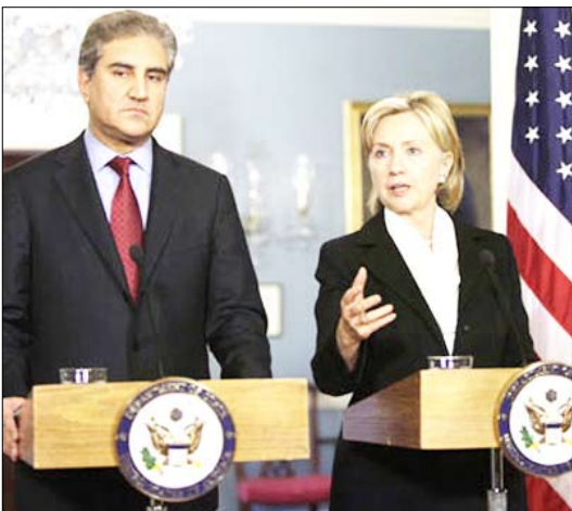
قريشي وكلينتون في ختام جولة سابقة من الحوار الاستراتيجي