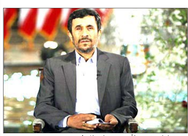
نجاد كرر تحديه لأي هجوم على بلاده

تهران/ 14 أكتوبر/ رويترز: تجاهل مرشد الجمهورية في إيران علي خامنئي دعوة الرئيس الأميركي باراك أوباما للحوار، وقال إن بلاده هزمت أعداءها، فيما توعد الرئيس الإيراني محمود أحمددي بنجاد بقطع يد من يحاول إيذاء الجمهورية الإسلامية. فقد قال علي خامنئي في رسالة متلفزة بمناسبة رأس السنة الفارسية إن «أعداء الجمهورية الإسلامية يركزون جهودهم كلها بعد مضي 30 عاما على محاولة هزيمة الثورة من الداخل». وأضاف أن «الأمم الإيرانية استطاعت هزيمة أعدائها بمقاومتها الاستثنائية وبقوتها وتصميمها». جاء ذلك بعد أن كرر الرئيس أوباما عبر رسالته صورة عرضها التقدم منذ عام للحوار مع طهران، وانتقاده الحكومة الإيرانية لما أسماه رفضها التعاون مع المجتمع الدولي بخصوص برنامجها النووي.