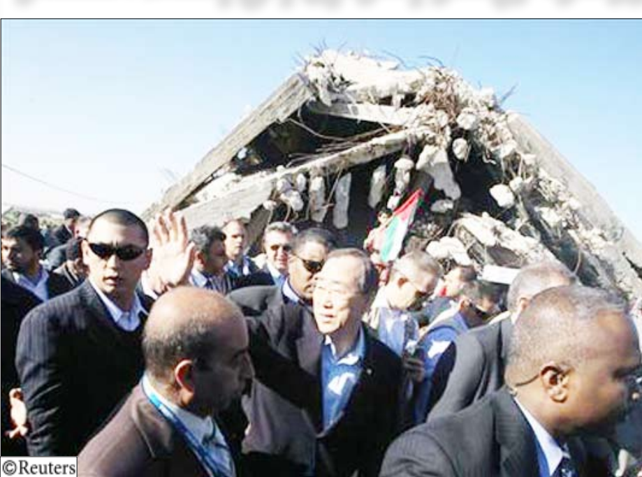
الأمين العام للأمم المتحدة بان كي مون يلوح بيده يوم أمس الاحد في شمال غزة خلال تفقده لمنزل دمرت في القصف الإسرائيلي العام الماضي.

خان يونس/ غزة 14 أكتوبر (رويترز): تعهد الأمين العام للأمم المتحدة بان كي مون أثناء زيارته القصيرة لقطاع غزة يوم أمس، بمواصلة الضغط على إسرائيل لرفع الحصار والسماح بإعادة بناء الحياة الفلسطينية من جديد، معتبرا أن سياسة الحصار غير مفيدة وغير مقبولة على الإطلاق. وقال في مؤتمر صحفي بختام زيارة استغرقت ساعتين للقطاع إن الأمم المتحدة لم تستطع منذ ثلاث سنوات أن تكمل المشروع الإسكاني بمدينة خان يونس جنوبي القطاع، ووصف الدمار الذي شاهده وتعذر جهود الإعمار بالشيء المجهول. وأكد المسؤول الأممي -الذي زار قطاع غزة للمرة الثانية منذ الحرب الإسرائيلية الأخيرة قبل 15 شهرا- أن منظمته ستبقى إلى جانب سكان قطاع غزة لتقديم ما يحتاجونه من خدمات، لكنه طالبهم بعدم استخدام العنف، واختيار طريق السلام والالتزام باتفاقيات منظمة التحرير الفلسطينية مع إسرائيل والعودة للوحدة الوطنية. وفي خان يونس، زار بان كي مون مشروعا لوكالة غوث وتشغيل اللاجئين الفلسطينيين (أونروا) حيث أشار إلى أن الأمم المتحدة لم تستطع منذ ثلاث سنوات أن تكمل مشروع إسكاني بالمدينة، لكنه بشر بأن الحكومة الإسرائيلية وافقت على عودة البناء والمشروع الإسكاني من جديد. وأوضح أن هذا المشروع سيشمل وحدات سكنية 150 فلسطينيا ومصطنعة للتعويض ومدرسة لأونروا ومنشآت للصف الصحي. ووصل المسؤول الأممي غزة عبر معبر بيت حانون الذي يربط القطاع بإسرائيل، وأطلع على معاناة الفلسطينيين الذين قصفت بيوتهم خلال الحرب الأخيرة. وقد استقبل عشرات المتضررين والجرحى وأهالي الشهداء والأطفال في غزة عبد ربه شرقي مخيم جباليا للاجئين شمال القطاع الأمين العام حاملين شعارات تدعو إلى وقف معاناة غزة، وفك الحصار الإسرائيلي من جديد.