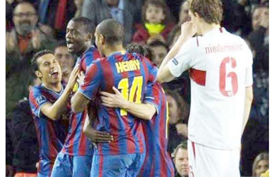
من مباراة برشلونة وشتوتغارت من دوري أبطال أوروبا

باريس / 14 أكتوبر / منابيات : تأمل جميع الفرق المتأهلة إلى الدور الربع النهائي من دوري أبطال أوروبا لكرة القدم أن تخدمها القرعة التي ستسحب الجمعة المقبلة في زيوريخ وتجنبها مواجهة برشلونة حامل اللقب ونجمه الرائع ليونيل ميسي. وكان برشلونة قد تأهل أمس الأول لأربعاء إلى الدور الربع النهائي بعدما دك شياك ضيفه شتوتغارت الألماني برعاية نظيفة، وتأهل معه بورود الفرنسي بفوزه على ضيفه أولمبيكوس اليوناني 2 - 1 ليحلحقا بإنتز ميلان الإيطالي وسسكا موسكو الروسي ومانشستر يونايتد وارسنال الإنكليزيين وليون الفرنسي وبايرن ميونيخ الألماني.