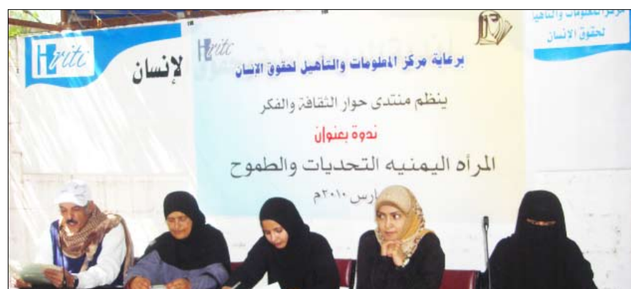
منتدى الحوار الثقافي ينظم ندوة المرأة اليمنية