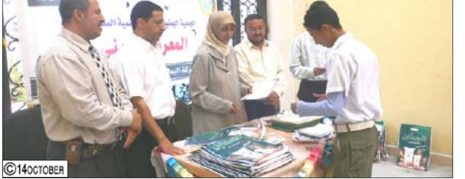
الجمعية اليمنية للبيئة تكرم الفائزين بمعرض الرسومات البيئية

عبد / أمار الوالي : تم صباح أمس بمقر الجمعية اليمنية للبيئة والتنمية المستدامة بعن توزع الشهادات والجوائز الخاصة بمسابقة الرسم والتي أقيمت بمناسبة الاحتفال بيوم