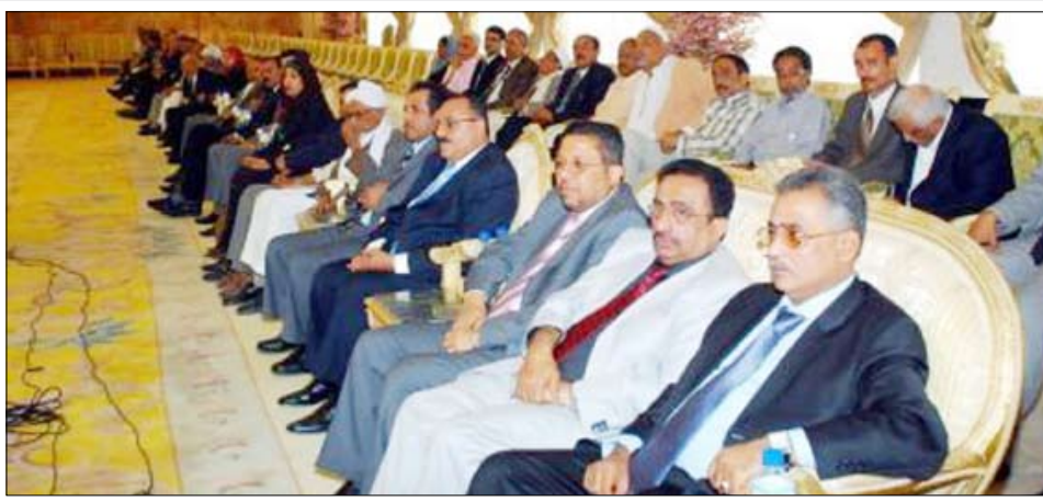
رئيس الجمهورية في احتفال الإعلاميين بيوم الإعلام اليمني في 19 مارس من العام الماضي

صغاء / متابعيات: برعاية فخامة الرئيس علي عبد الله صالح رئيس الجمهورية تحققت وزارة الإعلام والمؤسسات الإعلامية اليمنية بيوم الإعلام اليمني الذي يصادف 19-3 مارس من كل عام.