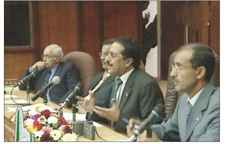
د. الجوفي في ختام ورشة العمل الخاصة لقيم الولاء الوطني

كما أوصى المشاركون بإعادة مصفوفة المحتوى في وثائق المناهج بما فيها المواد الإنسانية وتصميمها على أسس علمية سليمة وبنائها في ضوء مرجعيات موحدة على أساس منهج واحد. وشددوا على ضرورة الاهتمام بتوفير النشاطات التي تعزز حب الوطن والتأكيد على القدوة الحسنة عند اختيار المعلم وتدريبه أثناء الخدمة وتزويد الطلاب بالقدرة المناسبة من المعلومات الثقافية عن الوطن وقيم الولاء والانتماء الوطني. حضر اختتام الورشة نائب وزير التربية والتعليم الدكتور عبدالله الحامدي وعدد من القيادات التربوية.