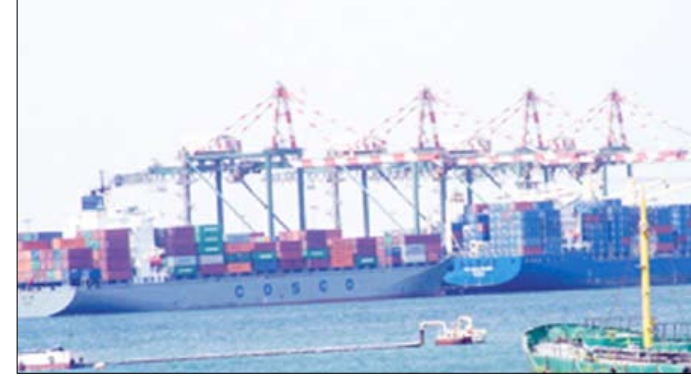
ميناء عدن الحاويات

استقبل ميناء الحاويات بعدن خلال فبراير الماضي 31 سفينة حاويات من مختلف الموانئ المجاورة والعالمية. وأما عدد إحصائية النشاط الملاحي الصادرة عن مؤسسة خليج عدن لوكالة الأنباء اليمنية (سبأ) أن السفن أفرغت خلال أرفصة الميناء 2303 الفاً و 571 حاوية بضائع متنوعة. وبينت الإحصائية أن عدد السفن التي تم تزويدها بالوقود خلال الفترة نفسها 33 سفينة وبكمية الفين و 791 طناً والف و 423 طناً مترياً من الغاز فيما بلغ عدد السفن التي تم تموينها بالمياه 36 سفينة.