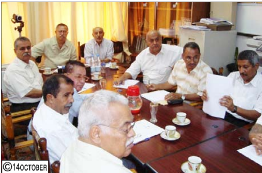
اجتماع لجنتي كتابة تاريخ جامعة عدن وكلية التربية

العمل سيبين جوانب مهمة من تاريخ الشعب اليمني ومرآة الإنشاء ومستوى التطور الذي وصلت اليه الجامعة في ظل الاهتمام الخاص الذي يولييه فخامة الرئيس/علي عبدالله صالح للتعليم الجامعي في البلاد ولجامعة عدن.