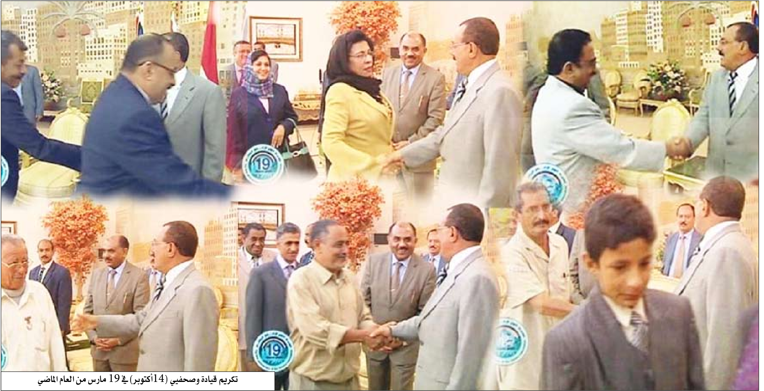
تكريم قيادة وصحفي (14 أكتوبر) في 19 مارس من العام الماضي