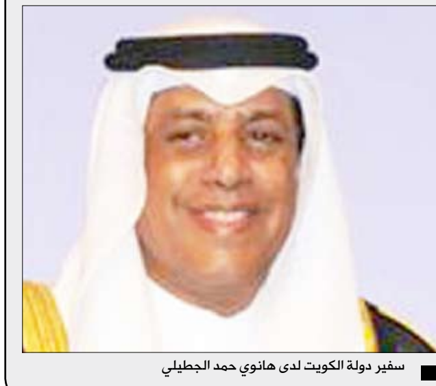
سفير دولة الكويت لدى هانوي حمد الجطيلي

قال سفير دولة الكويت لدى هانوي حمد الجطيلي يوم أمس الأول إن الصندوق الكويتي للتنمية الاقتصادية وقع قرض بقيمة 14 مليون دولار لتشييد طريق في محافظة (ديان بيان). وقال السفير الجطيلي في بيان صادر من السفارة الكويتية لدى هانوي إن هذا الإجراء يأتي ضمن التوجيهات السامية لحضرة صاحب السمو أمير البلاد الشيخ صباح الاحمد الجابر الصباح حفظه الله ورعاه لتعزيز العلاقات الثنائية بين دولة الكويت والدول الصديقة. وأضاف البيان انه مثل الصندوق الكويتي للتنمية الاقتصادية نائب المدير العام هشام الوقيان والمدير الإقليمي لدول شرق وجنوب آسيا والمحيط الهادي وليد البحر. ويأتي هذا المشروع ضمن عدة مشاريع قامت الكويت بها منذ عام 1976 من خلال توقيع عدد من القروض لتشييد البنية التحتية لفيتنام.