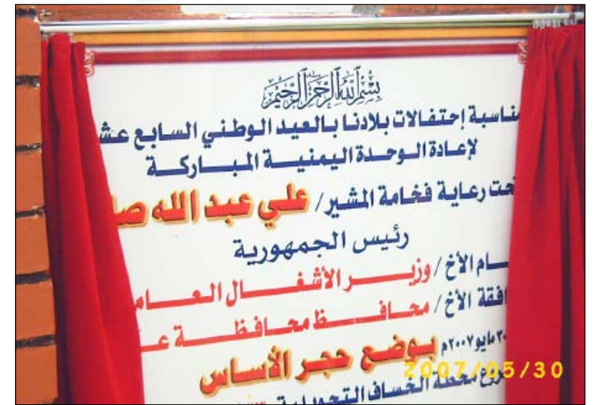
حجر أساس مشروع كهرباء عدن

بمرجع 889/ ن ر و 8 بتاريخ 27 / 12 / 2009م إلى الأخ المحافظ بشأن توقيف وتأخير الأعمال