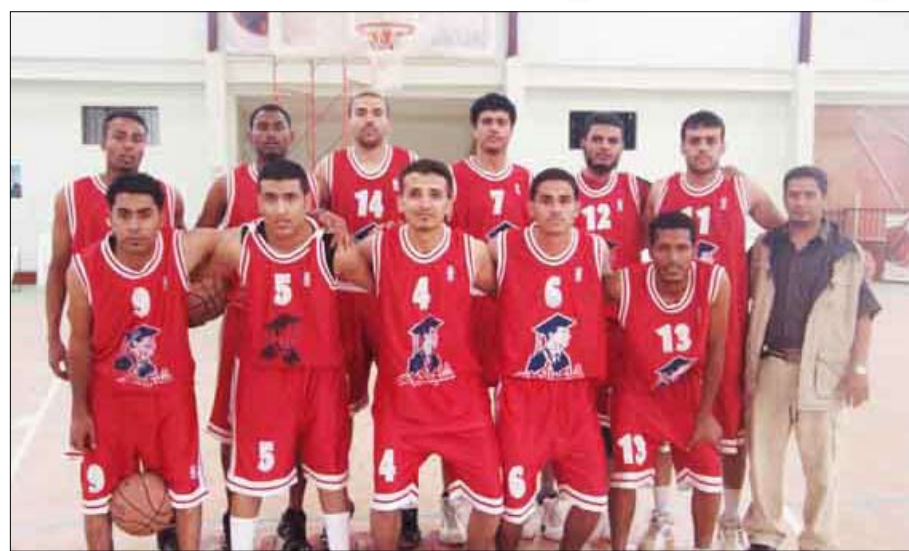
أهلي صنعاء لكرة السلة

الذهاب فريق المكلا قبل أخير الترتيب بـ11 نقطة، ضيفه الممثل الوحيد لمحافظة إب فريق الشعب ثالث الترتيب بـ17 نقطة. وتقام الأحد القادم المباراة المؤجلة من الجولة العاشرة بين فريق أهلي صنعاء ومصنفي فريق حضرموت.