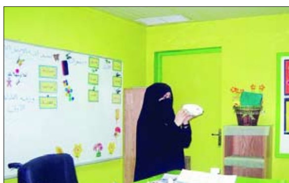
معلمة ناجحة في عملها وتتحمل مسؤولية أسرتها والوقوف بجانبهم