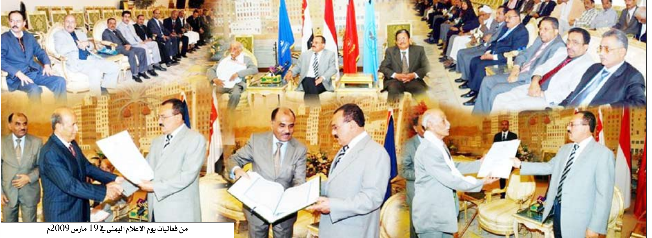
من فعاليات يوم الإعلام اليمني في 19 مارس 2009م

الصحافيون والصحافيات: ندعو إلى إقرار هيكل الصحافيين والوفاء بوعد إعطائهم التوظيف الوظيفي