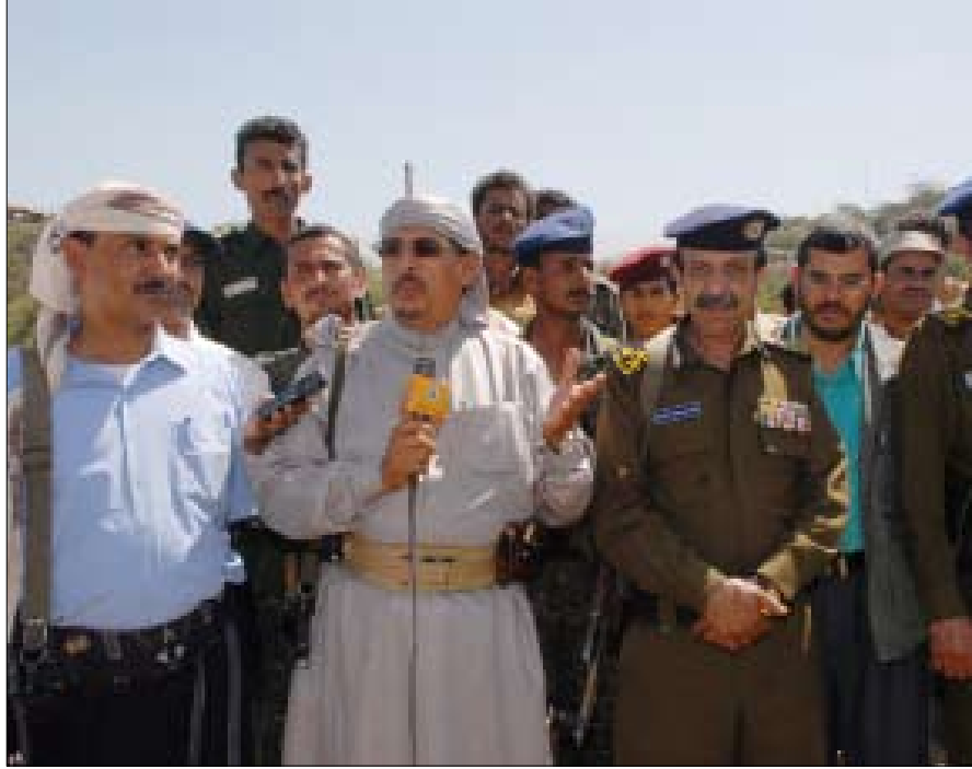
اللجان الميدانية تواصل عملها في محاور صعدة