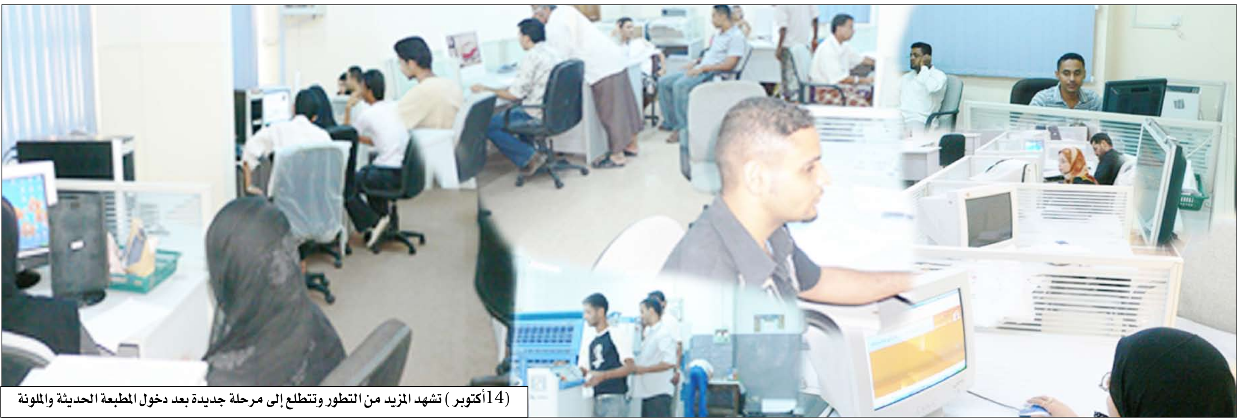
14 أكتوبر (تشهد المزيد من التطور وتطلع إلى مرحلة جديدة بعد دخول المطبعة الحديثة والمولدة)

كما يتجلى الفهم لدور الاعلاميين وخطورة العمل في بلاط صاحبة الجلالة فيما يتركس ويتعزز في الواقع من الضمانات الحقوقية للصحفيين وحرية الصحافة والرأي والرأي الآخر، وحماية الصحفيين من مرتزبات عملهم وما تفرضه مهنتهم