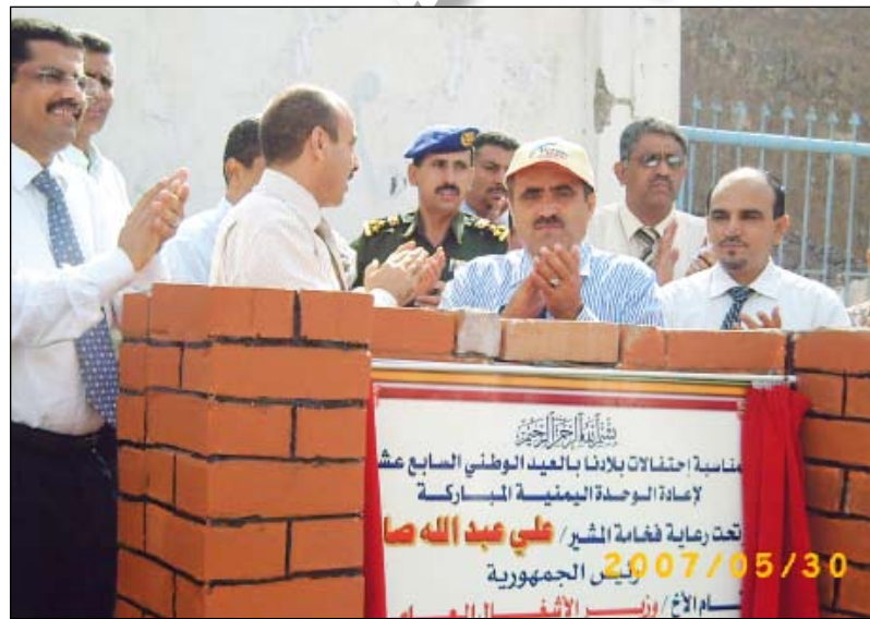
إثناء افتتاح المشروع ووضع حجر الأساس

كما يعلم الجميع من أبناء عدن أن محطة المنارة أصبحت غير قادرة على تلبية طلبات المواطنين من الطاقة ومنطقة كريتير خصوصاً تعاني مصاعب كبيرة جداً وقد عمدت المؤسسة إلى إيجاد حلول في الفترة الماضية تمثلت بإقامة محولات داخل الشوارع كشوارع الزعفران وشوارع الشيخ عبد الله وشوارع الملك سليمان وسوق الاتحاد وأمام سوق الأسماك وهذا أمر محزن لأن كريتير تعتبر إرثاً تاريخياً يجب الحفاظ عليه وبالتالي فإن بناء محطة تحويل استراتيجية في الخساف أصبح أمراً ملحا لا بد من تعاون الجميع من أجل تحقيقه لأن هناك توسعا عمرانياً كبيراً وهناك منشآت كبيرة تقام حالياً كالملاعب الرياضية في حقنات ومستشفيات ومباني التامينات والمباني التي إلى جانبه ولأن هناك توسعاً أفريقياً كبيراً في البناء وهناك عدة مشاريع أخرى سوف تقام كجمع البنوك وتطوير المدارس وتوسيعها إضافة إلى المجمعات الصحية وغيرها من المشاريع. فمن المستفيد من خلق هذه المشاريع وهل هذا هو الوجهة المشرق الذي تريدهون لعنن ياهولاء؟ إننا ندعو أبناء عدن في مجلس النواب إلى أن يتحملوا مسؤولياتهم ويقفوا أمام هذا العبث.