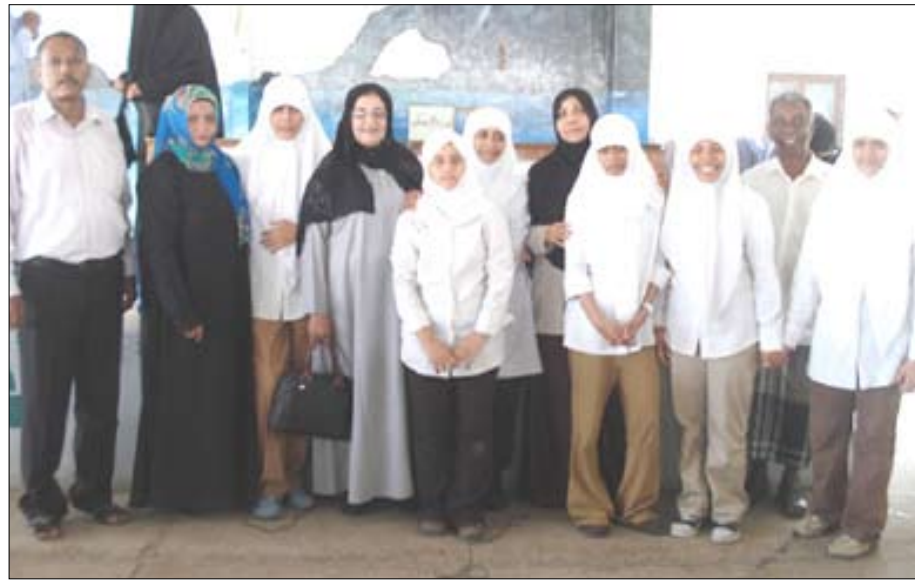
فتيات ريدان مع مسؤولي التربية في المعلى

إدارتي المدرستين والمعلمين والمعلمات على جهودهم الفؤيرة التي ترجمت هذا اليوم إلى حصاد علمي مشرف كما أهنئ بقية الطالبات والطلاب الذين لم يحالفهم الحظ في الفوز، لكنهم حققوا نتائج إيجابية، تمنى باستمراريتها وتطويرها مستقبلاً .. كما لا يفوتني أن أتقدم بجزيل الشكر والتقدير هذا النجاح الباهر.