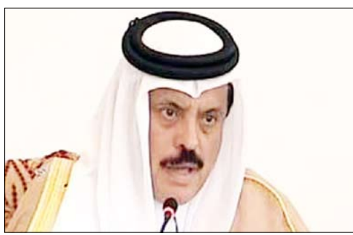
عبد الرحمن العطية

وبين العطية أن المجلس النقدي الخليجي سيعقد اجتماعه الأول في 30 الجاري، لاستعراض خطوات منظومة العمل المشترك تحقيقا للوحدة والتكامل، وقال: "نحن على قاف قوسين أو أدنى من وحدة العملة الخليجية الموحدة". وأشار إلى أن مسائل فنية سيبحثها المجلس النقدي الذي سيرى النور نهاية الشهر الجاري، وشدد على جدية دول المجلس في الوصول إلى العملة الموحدة التي باتت واقعا، وقال: "إن عام 2009 شهد تحقيق المزيد من الإنجازات في المجال الاقتصادي ومنها الاتحاد الجمركي والسوق الخليجية المشتركة". وأضاف العطية أنه تم إعداد تقرير حول مسألة تمويل المشروعات والتنمية المقدمة في دول المجلس، وذلك بغية الوقوف على العقبات التي تحول دون الشروع بها، مشيراً إلى أن عملية الاستقرار في المنطقة واليمن مرتبطة بعملية التنمية، وطلب إيران بطامنة المجتمع الدولي تجاه ملفها النووي.