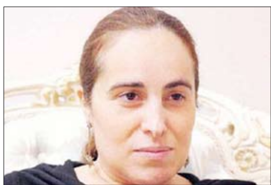
السفيرة الجورجية "إيكاترين مايرنيغ ميكاندز"

الجورجية الحالية في الكويت والتي عينت هناك في 13 - 8 - 2009، بلدها في المملكة العربية السعودية وقطر و'إمان والبحرين بالإضافة إلى الإمارات العربية المتحدة، عبر تنقلها بين جميع دول مجلس التعاون الخليجي. وفي هذا الصدد قالت "إيكاترين" إن تعاون بلادها -جورجيا- مع دول الخليج يمثل أهمية كبرى، خصوصا فيما يتعلق بالزراعة و سوق العقارات بالإضافة إلى السياحة والتمويل.