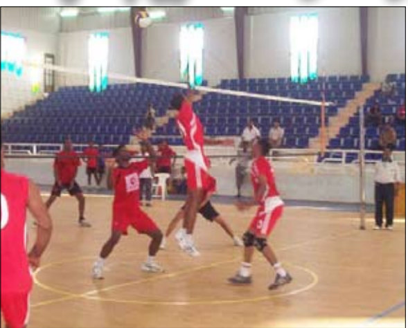
من مباراة شعب حضرموت ووحدة تريم