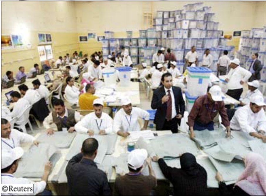
نسبة الفرز وصلت 83 ٪ من الأصوات

رويتزر 14 أكتوبر / رويترز - قالت وسائل اعلام حكومية ان الشرطة التركية اعتقلت يوم أمس الخميس حوالي 20 شخصا فيما يتعلق بمؤامرة مزعومة للاطاحة بالحكومة ذات الخوذ الاسلامية وان المعتقلين بينهم ضباط جيش في الخدمة ومتكعدون. وأضافت مصادر ان العملية جزء من تحقيق في شبكة ارجينيكون وهي جماعة يمينية مزعومة يقول المدعون انها خلطت للاطاحة بحكومة حزب العدالة والتنمية برئاسة رئيس الوزراء رجب طيب اردوغان. وقالت وكالة انباء الاناضول الحكومية ان الاعتقالات حدثت في ثمانية مدن وان العملية مستمرة. والقى القبض على أكثر من 200 شخص بينهم جنرالات متقاعدون ومحامون ومصحفون فيما يتعلق بشبكة ارجينيكون.