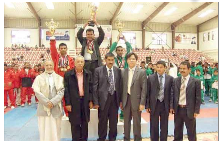
لدى تكريم أبطال التايكواندو