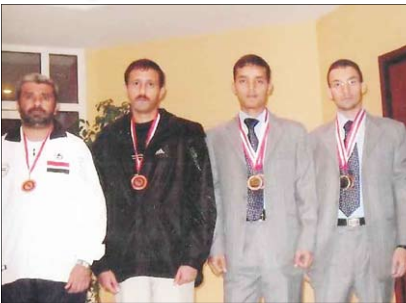
لاعبو كمران للشطرنج