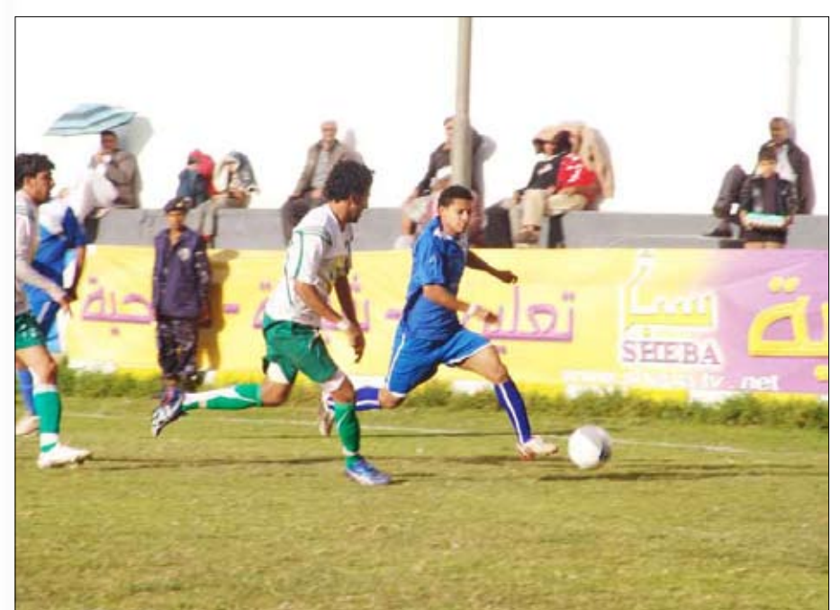
لقطة من المباراة

بينما يحل الشعلة عند التاسع بـ22 نقطة ضيفاً ثقيلاً على العربية صنعاء السابع بـ23 نقطة في لقاء تحسين ترتيب