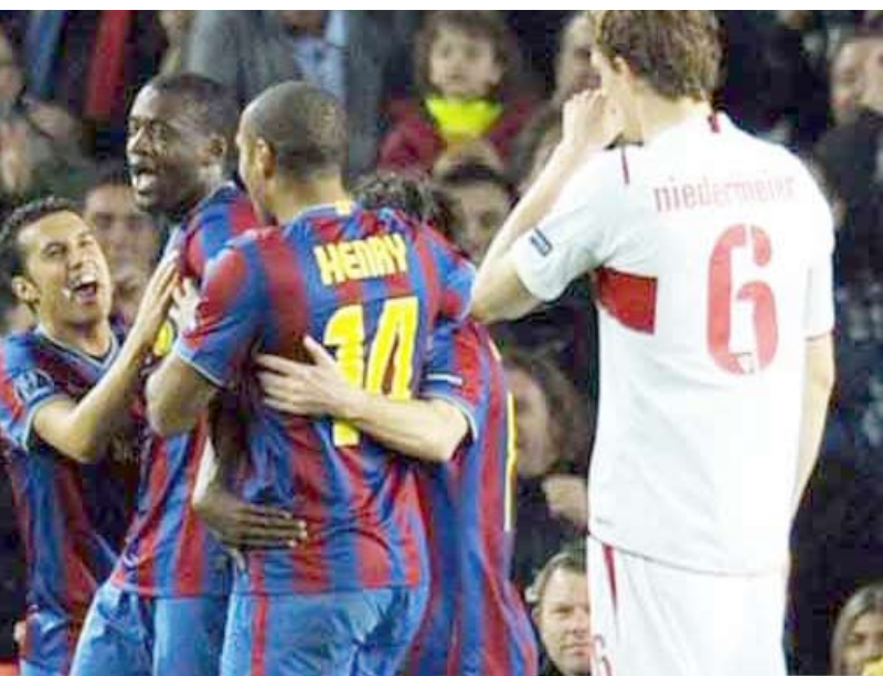
من مباراة برشلونة وشتوتغارت من دوري أبطال أوروبا

باريس / 14 أكتوبر / منابها، تأمل جميع الفرق المتأهلة إلى الدور الربع النهائي من دوري أبطال أوروبا لكرة القدم أن تخدمها القرعة التي ستسحب الجمعة المقبلة في زيوريخ وتجنبها مواجهة برشلونة حامل اللقب وتجمعه الرابع ليونيل ميسي. وكان برشلونة قد تأهل أمس الأول لأربعاء إلى الدور الربع النهائي بعدما شك شكيف ضيفه شتوتغارت الألماني بريعاية نظيفة، وتأهل معه بوردو الفرنسي بفوزه على ضيفه أولمبياكوس اليوناني 2 - 1 ليحلحقا بياتر ميلان الإيطالي وسسكا موسكو الروسي ومانشستر يونايتد وارسنال الإنجليزي وليفون الفرنسي وبايرن ميونيخ الألماني. وسيقوم برشلونة ممثل إسبانيا الوحيد في الدور الربع النهائي بعد خروج ريال مدريد وأشبيلية من الدور الثمن النهائي على يد ليون وسسكا موسكو وأتلتيكو مدريد من الدور الأول.