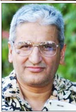
العراقي / أديب كمال الدين