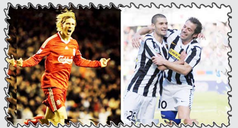
يوفنتوس و فولهام الإنجليزي