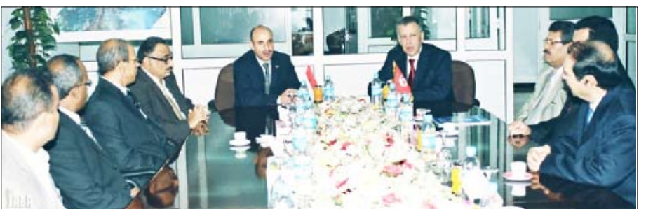
اجتماع اللجنة الفنية اليمنية التونسية المشتركة

صناعة / سبأ : أقر مجلس أمناء المركز الوطني للمعلومات في اجتماعه أمس برئاسة رئيس مجلس الوزراء الدكتور علي محمد مجور خطة عمل المركز للعام الجاري 2010م . وتهدف الخطة لتعزيز الجهود المبذولة في جوانب البنية الأساسية للمعلومات وتطوير كفاءة الأداء المؤسسي في هذا المجال وتوطيد الشفافية وتسهيل الحصول على المعلومات فضلاً عن تطوير خدمات دعم صناعة القرار . وأكد المهندس الكرشمي ضرورة الاستفادة المتبادلة في مجال تدريب وتأهيل الكوادر العاملة و تبادل الزيارات.. مبدياً إعجابه بالتجربة التونسية في مجال الإسكان ورغبة اليمن في الاستفادة منها بما يوفر السكن لأكثر عدد ممكن من ذوي الدخل المحدود. من جانبه أكد السفير التونسي بصنعاء حرص بلاده على تطوير العلاقات الثنائية القائمة بين البلدين في مختلف المجالات انطلاقاً من العلاقات التاريخية الراسخة و الأواصر الأخوية الوثيقة التي تجمع اليمن وتونس قيادة وشعباً.