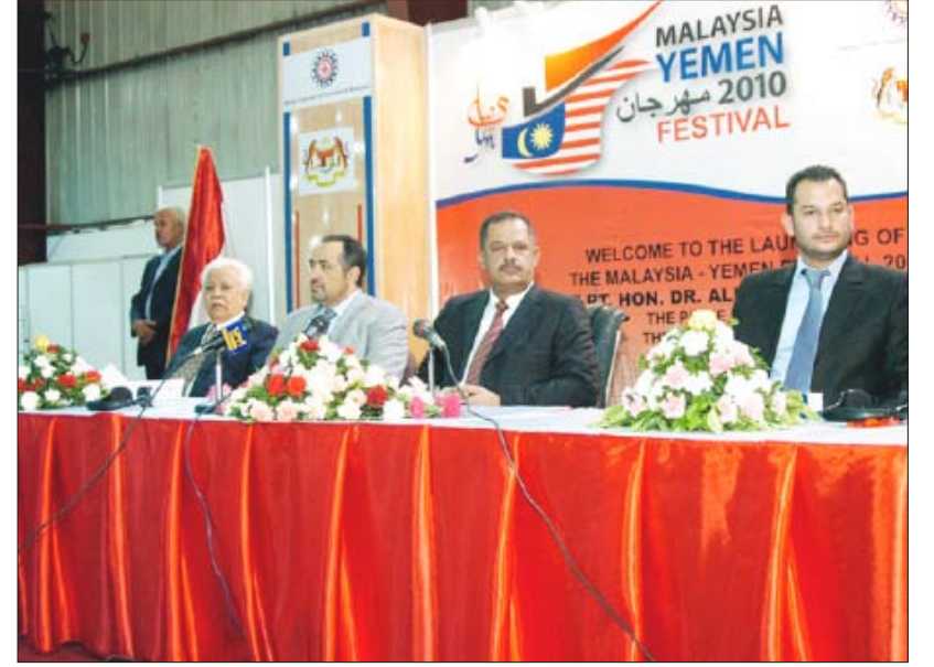
رئيس الوزراء في افتتاح المهرجان اليمني المالىزي بصنعاء