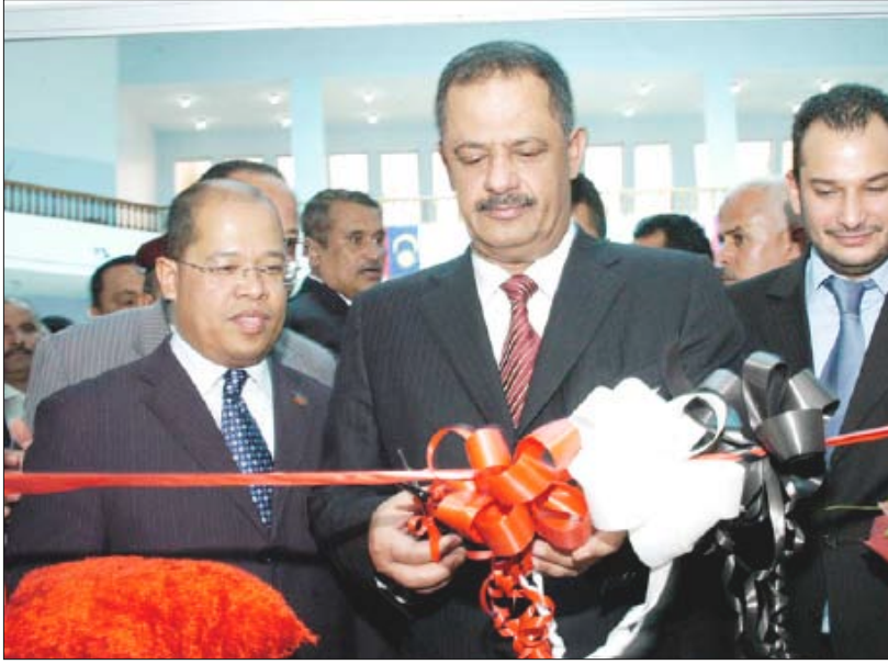
خلال تشييد المهرجان اليمني المالىزي