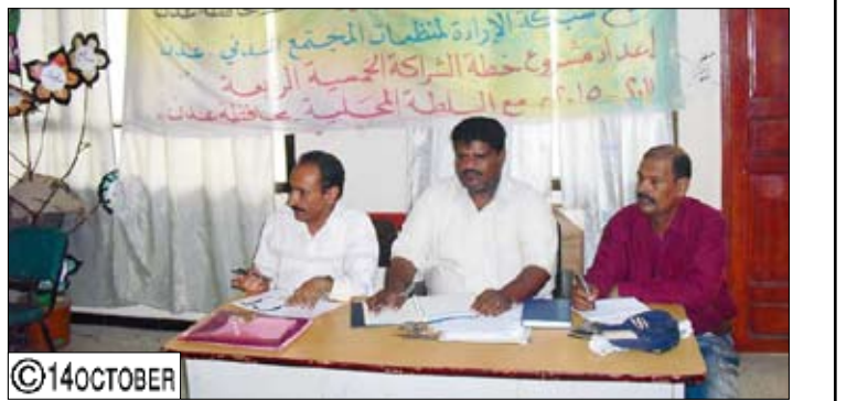
من فعاليات شبكة الإرادة لمنظمات المجتمع المدني

وقالت: وجدنا تجاوباً كبيراً من قبل قيادات وقواعد المديرية والمجالس المحلية والمكاتب العامة فيها ومن المحافظة ومكتب التخطيط الذي يعمل لدينا أحد موظفيه مستشاراً، ثم تم تقسيم المناطق الأكثر احتياجاً للخدمات، وعليه قسم الفريق للعمل في هذه المناطق وتم إنزال "50" استمارة استبيان مقسمة على المناطق المستهدفة، وقام فريق ميداني بجمع البيانات وهذا العمل كله لم يكن سهلاً واحتاج إلى "احترافية" وعملنا كان ليل نهار وجرت لقاءات جماعية وفردية مع المواطنين بمشاركة كل الجهات العاملة مع الشبكة في جرى تقييم وضع المدارس والمرافق الصحية وخدماتها وبعدها الالتقاء بمراكز مكاتب الصحة والتربية فيما يخص مديرياتهم، وسيتم الجلوس مع شركاء الشبكة (المجلس المحلي وقيادات المديرية) والنقاش معهم لإدراج النتائج التي خرجنا بها في الخطة الخمسية الرابعة للمحافظة وكل هذا الجهد بدأناه من بداية عامنا الحالي لإنجاز خطة تعكس الاحتياجات الحقيقية للناس ومن خلال رؤاهم هم ونحن نعمل مع المواطنين والفقراء منهم منذ عام 2000م حين كنا في إطار جمعية مكافحة الفقر ثم بدأنا التشبيك مع الجمعيات عام 2004م والآن نحصل على نتائج جوهرياً هذه بعملنا مع المجالس المحلية لرسم خطة خمسية رابعة لمكافحة