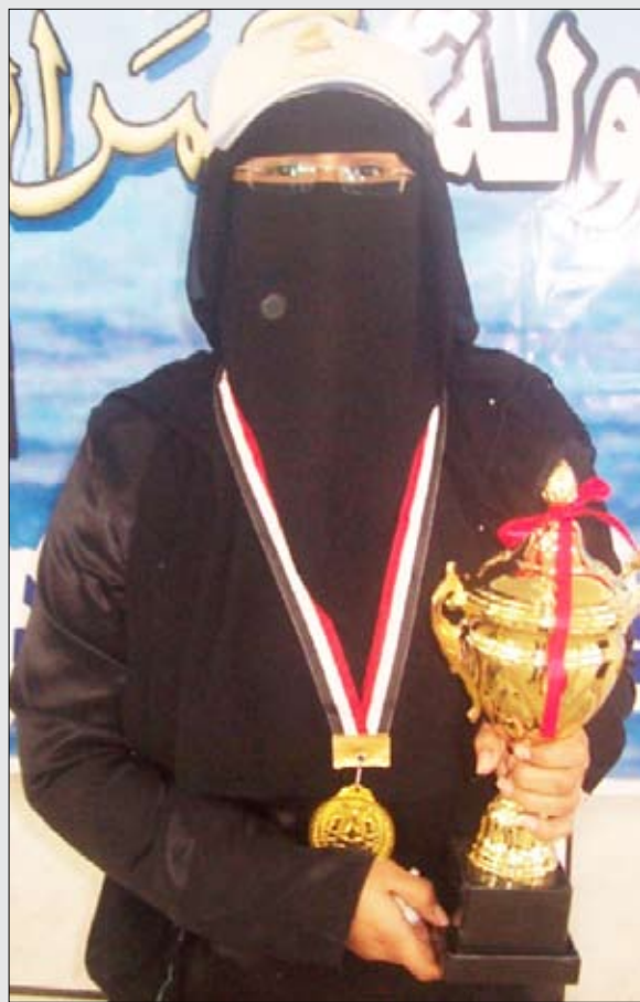
ملكة جامعة حضرموت