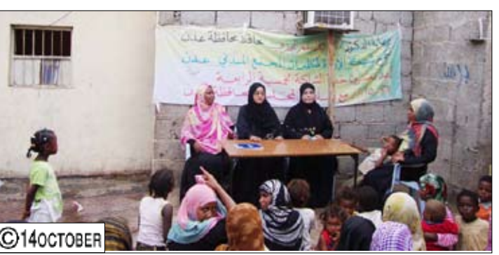
من فعاليات شبكة الإرادة لمنظمات المجتمع المدني