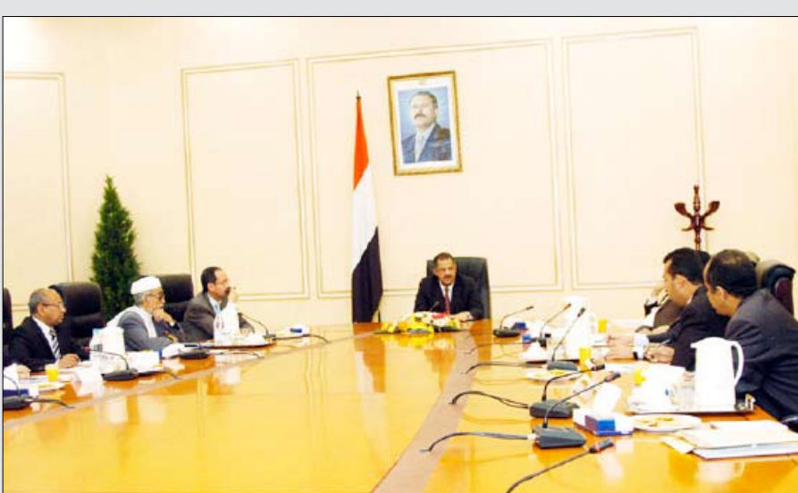
رئيس الوزراء يترأس اجتماع مجلس أمناء المركز الوطني للمعلومات

وشبكة المعلومات الفرعية في كل من مجلس الشورى ومجلس الوزراء ووزارة التخطيط والتعاون الدولي، وكذا بناء شبكات نظم معلومات المحافظات التي بدأت بمحافظتي تعز واب . وأشار التقرير إلى مجمل المتطلبات المالية والمادية والبشرية التي يتطلبها إنجاز النظام على مستوى الجمهورية ودوره المحوري في نظام الحكومة الالكترونية. وأقر المجلس في ضوء مناقشته للتقرير تشكيل لجنة من المركز الوطني للمعلومات ووزارتي المالية والاتصالات وتقنية المعلومات لوضع الحلول الفنية والمالية لتأمين توفير قنوات الاتصالات اللازمة لربط وتشغيل نظم معلومات الشبكة الوطنية في الجهات الحكومية التي يتم حالياً استكمال بناء النظم المعلوماتية الشبكية الخاصة بها . وأكد المجلس أهمية التنسيق بين الوزارات والأجهزة الحكومية والمركز الوطني بشأن تنفيذ أي مشروعات متعلقة بنظم المعلومات بما يخدم التكامل مع النظام الوطني للمعلومات . وكان مجلس الأمناء قد اطلع على محضر اجتماعه السابق وأقره .