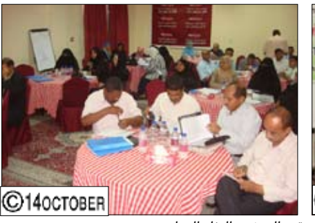
لقاء تشاوري حول تعزيز العلاقات بين مؤسسات المجتمع المدني والبنك الدولي