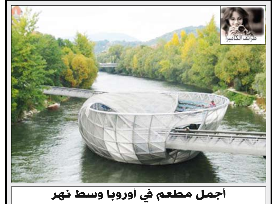
أجمل مطعم في أوروبا وسط نهر