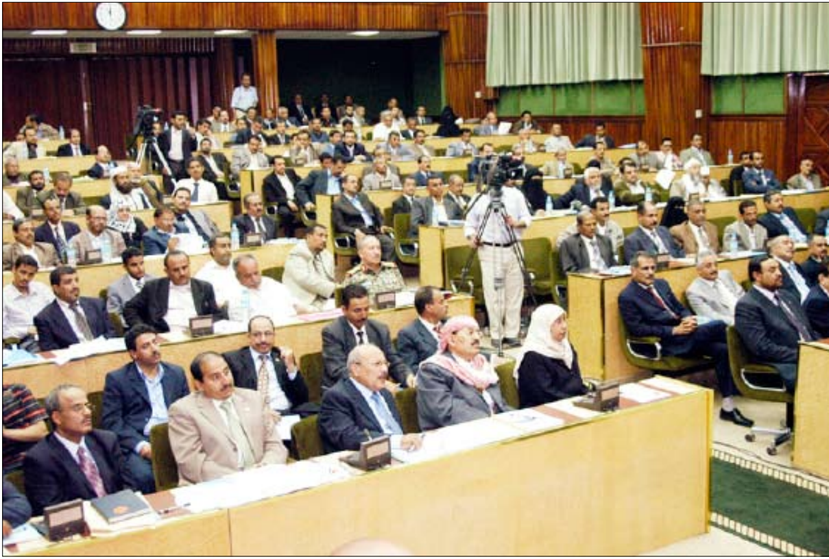
جانب من المشاركين في الورشة