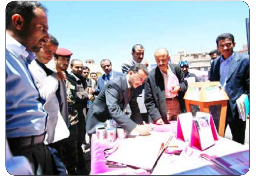
لقطات من زيارة نائب الوزير للمهرجان

والتوعية التي سترتقي بالفكر العام للمرأة والخطوة المهمة في المهرجان هي أن عائداته ستذهب لنزاحات صعدة ومريضات السرطان آمل أن يحقق المهرجان أهدافه بشكل أكبر من المهرجان الأول. متمنية في ختام تصريحها التوفيق للفتيات المشاركات والزائرات.