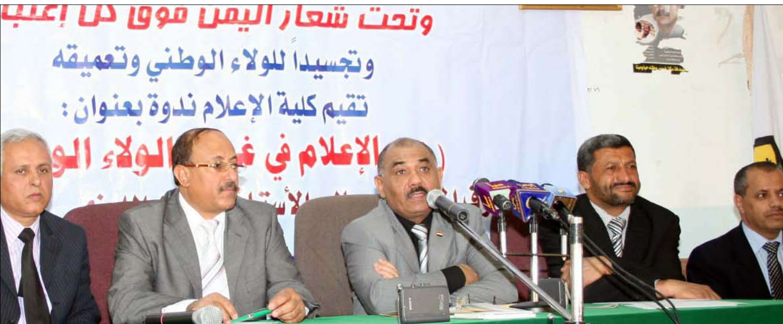
وزير الإعلام في محاضرة أمام طلاب كلية الإعلام في جامعة صنعاء