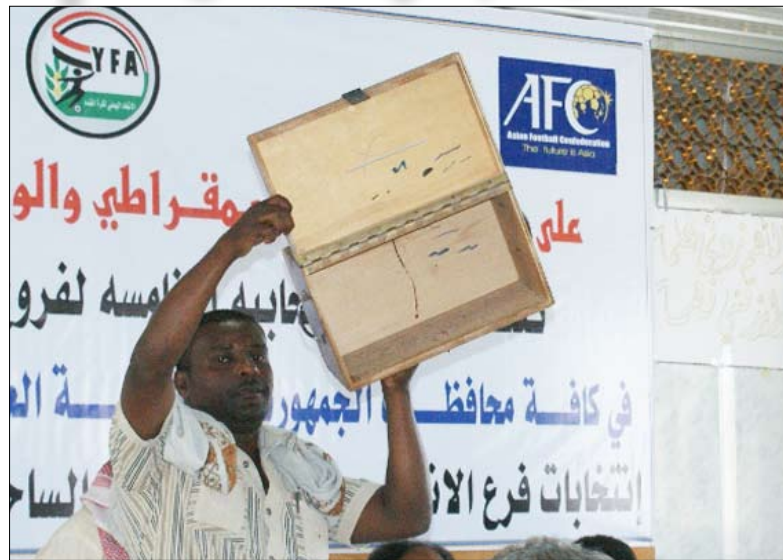
لقطة من انتخابات سابقة 11