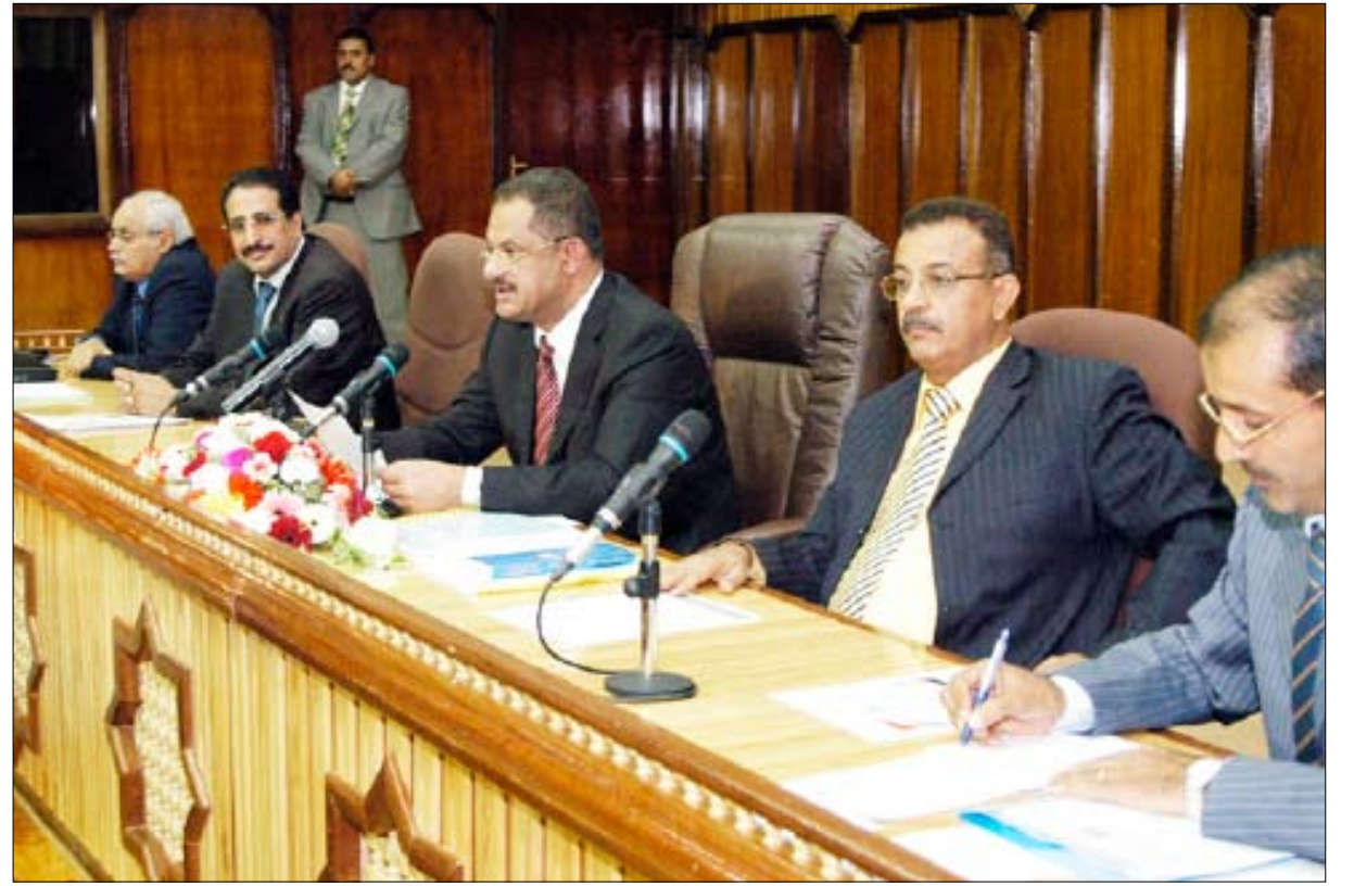
د. مجور يفتتح ورشة حول الولاء الوطني في المناهج الدراسية