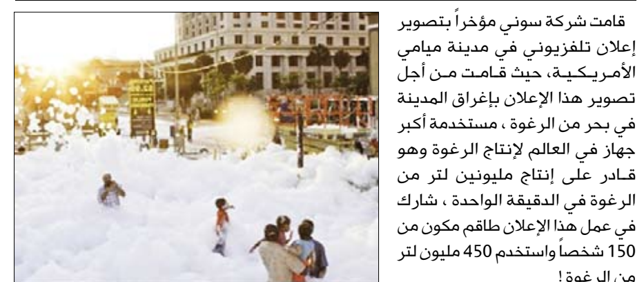
قامت شركة سوني مؤخراً بتصوير إعلان تلفزيوني في مدينة ميامي الأمريكية، حيث قامت من أجل تصوير هذا الإعلان بإغراق المدينة في بحر من الرغوة، مستخدمة أكبر جهاز في العالم لإنتاج الرغوة وهو قادر على إنتاج مليونين لتر من الرغوة في الدقيقة الواحدة، شارك في عمل هذا الإعلان طاقم مكون من 150 شخصاً واستخدم 450 مليون لتر من الرغوة!