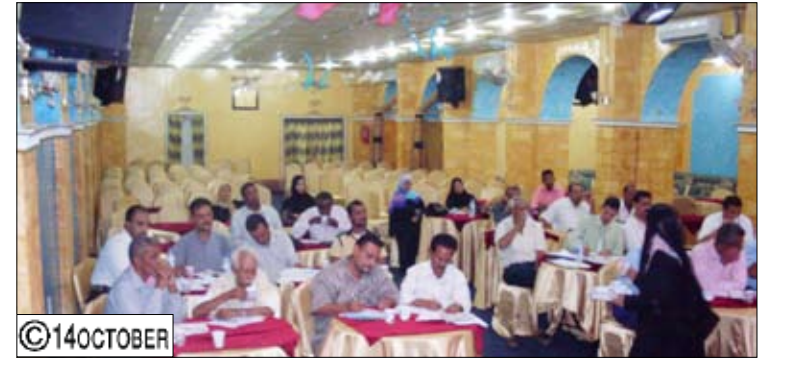
أعضاء المجلس المحلي والمكتب التنفيذي م التواهي

الحالي ضمن المنشآت الرياضية للنادي. ووقف المجتمعون أمام جملة القرارات المهمة في مقدمتها إقرار مشروع تأهيل سوق مدينة القلوعة ضمن المشاريع التي سيتم تنفيذها في العام القادم وتشكيل لجنة خاصة تتولى مهمة حصر المنازل التي تضررت من جراء الأمطار وتحتاج للترميم وإعادة التأهيل وإنزال المناقصات اللازمة لهذا المشروع. ورحب أعضاء المجلس المحلي والمكتب التنفيذي بالقرار الذي اتخذته الهيئة الإدارية لمحافظة عدن الذي يقضي بتخصيص أرضية لنادي الميناء الرياضي (خلف موثيل الشمس بجولد مور) ليبنى فيها ملعب رياضي خاص بالنادي على أن يبقى الملعب مطع شهر مايو القادم.