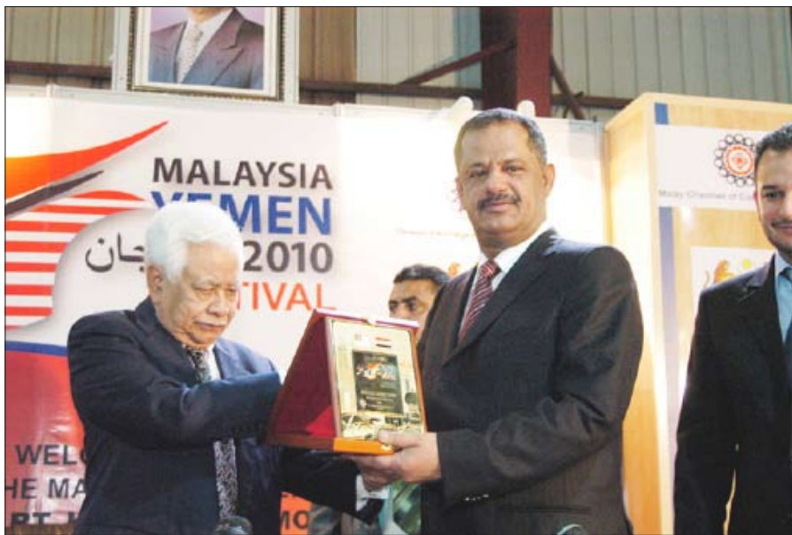
رئيس الوزراء يكرم رئيس الغرفة المالاوية المالىزية

وقال الدكتور مجور: "إن الحكومة تسعى من خلال هذه الفعالية إلى تشجيع المستثمرين في البلدين لتبادل الخبرات والتجارب واستنهاض العلاقات التجارية والاستثمارية القديمة والدفع بها قدماً لمصلحة الشعبين الشقيقين".