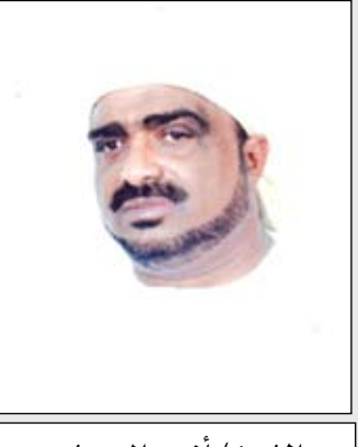
الشيخ / أنيس الحبشي