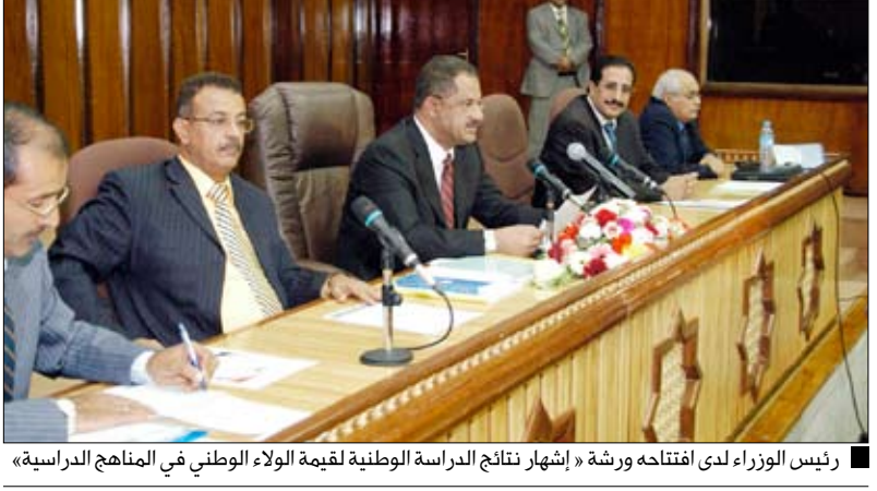
رئيس الوزراء لدى افتتاحه ورشة «إشهار نتائج الدراسة الوطنية لقيمة الولاء الوطني في المناهج الدراسية»

وجه رئيس مجلس الوزراء الدكتور علي محمد مجور وزارة التربية والتعليم بإضافة مقررات التربية الوطنية إلى منهج المرحلة الثانوية من أجل إبقاء وعي الطلاب والطالبات على صلة بمستجدات الوطن وأولوياته، معتبراً ذلك مهمة ينبغي أن تضطلع بها وزارة التربية والتعليم باعتبارها الجهة المسؤولة عن إعداد السياسات التعليمية والبيات التنفيذية فيما يتعلق بتطوير المناهج الدراسية وتضمينها المعارف والقيم التي تستثير وعي النشء والشباب وتربطهم بأولويات وطنهم وتعرس فيهم قيم العلم والمعرفة وتعذي فيهم روح الابتكار والإبداع المميزين.