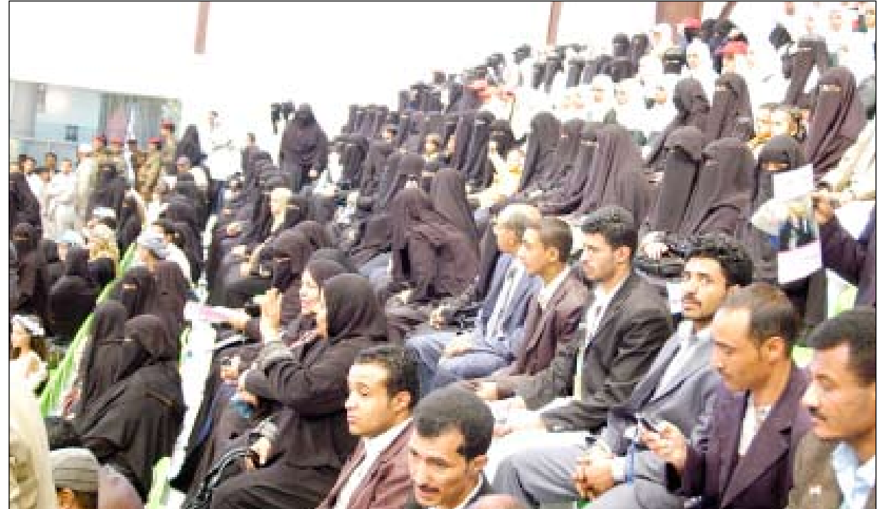
جانب من حضور المهرجان