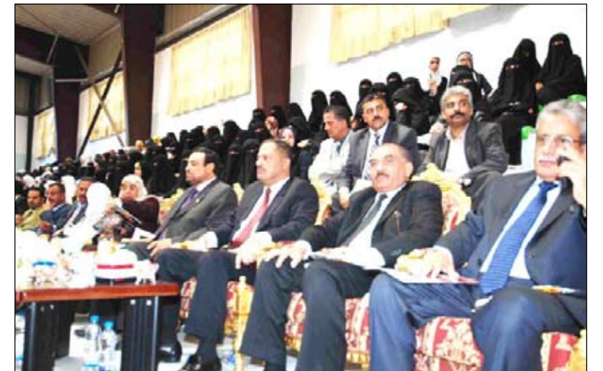
رئيس وأعضاء مجلس الوزراء وجمع من الحضور