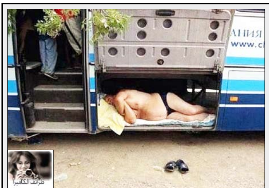
يبدو أن النوم في الحافلات أكثر راحة