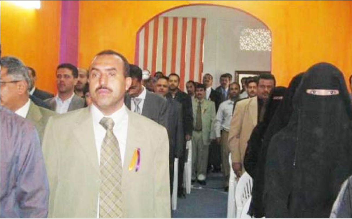
■ جانب من المشاركين في الاجتماع الانتخابي