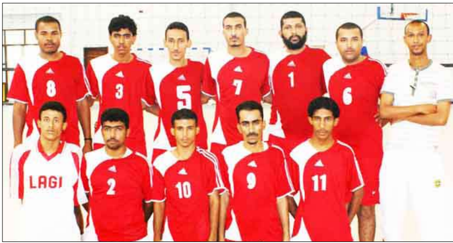
طائرة تضامن شبوة

فيما تتواصل اليوم مباريات مجموعة عدن لأندية ثانية الطائرة