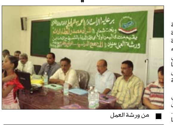
من ورشة العمل

مواكبتها للمتطلبات الراهنة التي يواجهها الوطن مؤامرة كبرى لزعزعة أمنه واستقراره والنيل من وحدته وتوثره المهدية. وأكدوا أن حماية الوطن من كل المؤامرات واجب يقع على عاتق جميع أبناء الشعب وفي مقدمتهم شريحة الشباب داعين المؤسسات والجهات المختصة إلى العمل على تحديث المنهج الدراسي والاهتمام بالكادر التعليمي وتحسين أوضاعه والاهتمام بتوعية الشباب وتنقيحهم وتحسينهم ضد ثقافة الكراهية وأفكار التطرف والتشدد وترسيخ ثقافة وقيم الولاء الوطني وحُب الوطن في نفوس الشء الذين يعتبرون ثمرة طيبة نمت في ظل دولة الوحدة المباركة.