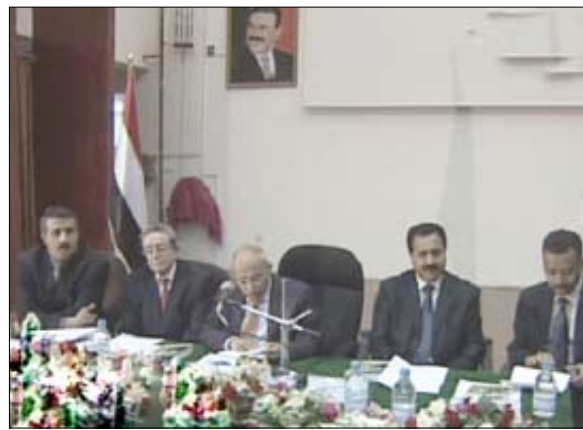
من فعاليات حفل التأبين

وأنه بدور الفقيد في تأسيس جامعة صنعاء والتي كان أول رئيس لها .. مشيراً إلى أن الفقيد كان ميلاً لفعل الخير بطبيعته الإنسانية مؤمناً بحمل المسؤوليات بوطنية الصادقة ومنظماً في جميع أعماله وأحواله.