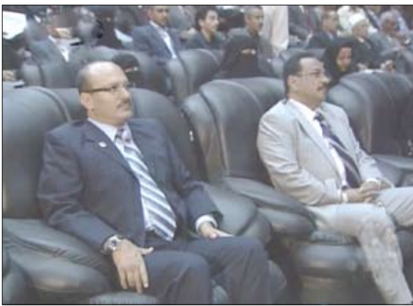
من فعاليات حفل التأبين