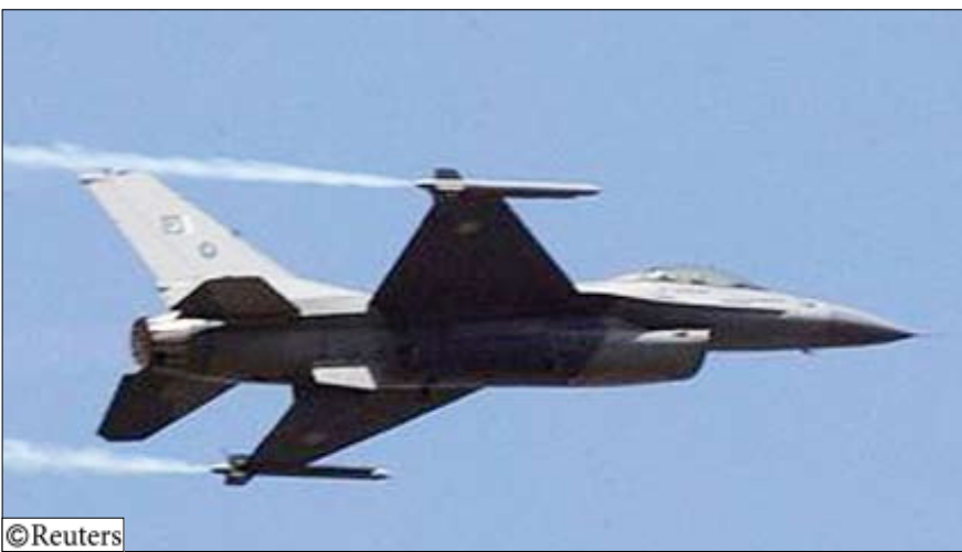
مقاتلة باكستانية تحلق في سماء اسلام اباد يوم 23 مارس 2005