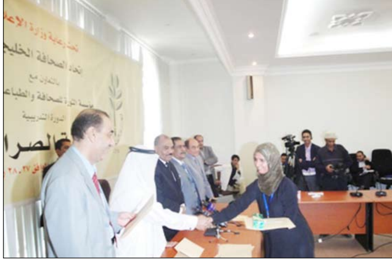
إحدى المشاركات تتسلم شهادتها