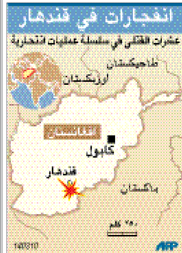
والإقليمية والفرنسية والألمانية والإيطالية والإسبانية ويلم

أواخر التسعينيات. واعتبرت أن نجاح ضباط الشاباك في اختطاف الشيخ ماهر بعد فشلها عشرات المرات طيلة الفترة الماضية «ما كان ليتم لولا الجهود الأمنية الكبيرة التي مارستها أجهزة فتح في الضفة الغربية وتحديدا