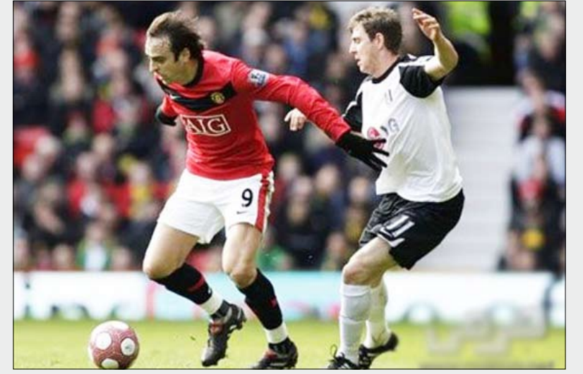
لقطات من الدوري الإنجليزي

روني يتالق ويضع اليوناييتد في قمة دوري إنجلترا