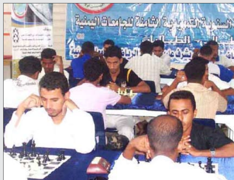
لقطة جماعية للأبطال