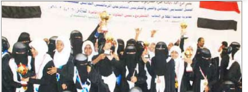
لقطنتان من المهرجان