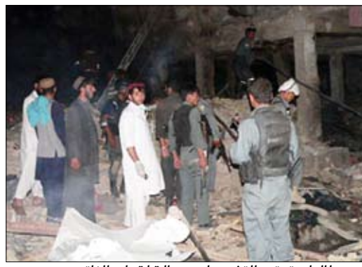
طالبان تعتبر التفجيرات رسالة لقوات الناتو

وقال رئيس المجلس الإقليمي أحمد ولي كرزاي وهو أغ غير شقيق للرئيس الأفغاني حامد كرزاي إن 30 شخصا قتلوا -كثيرون منهم