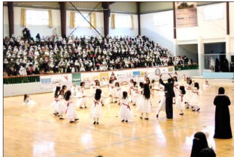
من فعاليات المهرجان