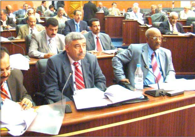
■ الجانب الحكومي