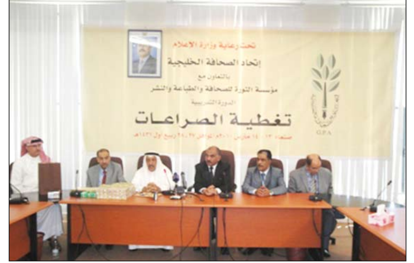
من فعاليات اختتام الدورة التدريبية للصحافيين حول تغطية الصراعات