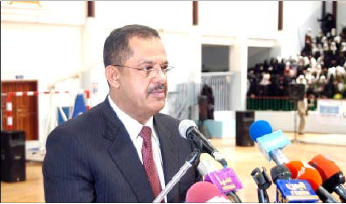
رئيس الوزراء في كلمته لدى تدشينه المهرجان