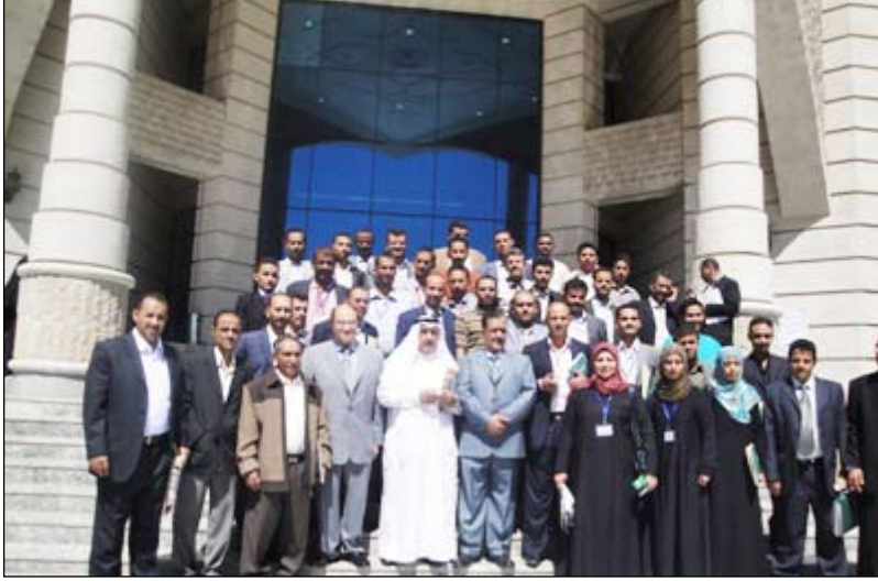
صورة تذكارية تجمع المشاركين في الدورة