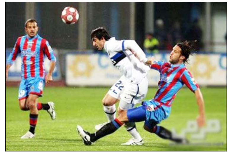
من لقاء كاتانيا وانتر ميلان