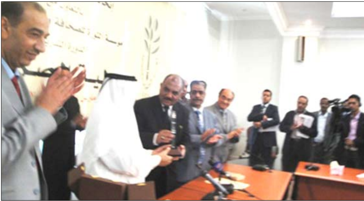
وزير الإعلام يتسلم هدية تذكارية من اتحاد الصحافة الخليجية

وفي ختام الدورة أكد الأستاذ/حسن أحمد اللوزي وزير الإعلام أهمية هذه الدورة لخصوصية موضوعها الاستثنائي فيما يتعلق بتغطية الصراعات والحروب. وقال إن هذه الدورة على تركيزها في يومين كانت غنية ومثمرة وقد استفاد منها المشاركون استفادة كبيرة ستعكس في أداؤهم لعملهم.