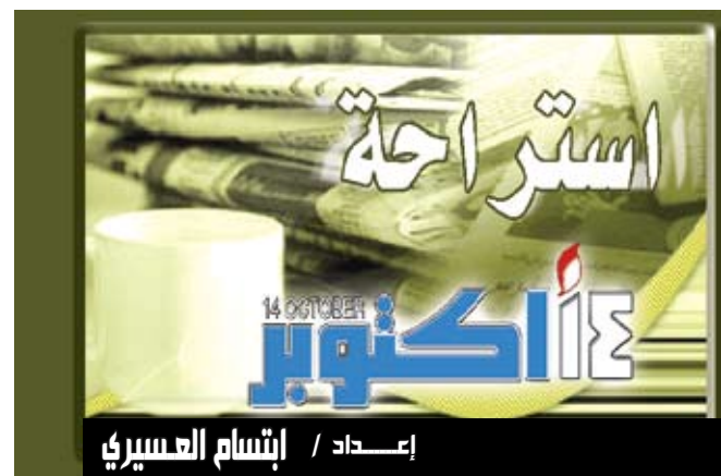
إعداد / إنشام العسيري

بكين / متابعات : أعلنت الحكومة الصينية عن اختبار دفعة جديدة من رواد الفضاء، لإرسالهم في بعثات مستقبلية، وهم خمسة رجال وامرأتان، في سابقة تعد الأولى لانضمام نساء إلى بعثات الفضاء التي تقوم بها بكين. ووفقا لوكالة الأنباء الصينية فإن الرائدتين من قادة طائرات النقل الجوي من القوات الجوية لجيش التحرير الشعبي، قد تشاركان في عملية الالتحاق المأهول بمختبر الفضاء المستقبلي الصيني. وأفاد مسئول عن الرحلة أنه أثناء عملية الاختيار تم تطبيق الشرط نفسها على المرشحات والمرشحين،