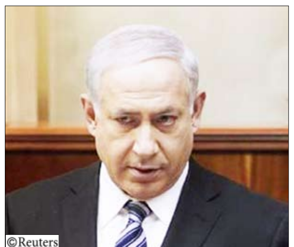
رئيس الوزراء الإسرائيلي بنيامين نتنياهو في القدس يوم أمس الأحد.

التطورات التي سبقت الإعلان عن المشروع الاستيطاني «وصحان وجود اجراءات تحول دون حدوث مثل هذه الوقائع في المستقبل». ولم يتضح على الفور ما انا كان التحقيق سيسهم في عودة التناغم للعلاقات مع واشنطن بعد الخلاف الأخير بين نتنياهو والرئيس الأمريكي باراك اوباما.