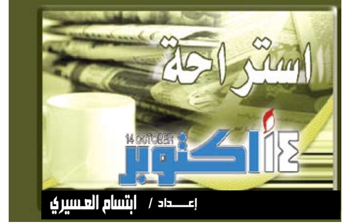
إعداد / إبتسام العسيري

وأعلنت الحكومة الصينية عن اختيار دفعة جديدة من رواد الفضاء، لإرسالهم في بعثات مستقبلية، وهم خمسة رجال وامرأتان، في سابقة تعد الأولى لانضمام نساء إلى بعثات الفضاء التي تقوم بها بكين. ووفقاً لوكالة الأنباء الصينية فإن الراكبتين من قادة طائرات النقل الجوي من القوات الجوية لجيش التحرير الشعبي، قد تشاركان في عملية الالتحاق بالمهام بمختبر الفضاء المستقبلي الصيني. وأفاد مسئول عن الرحلة أنه أثناء عملية الاختيار تم تطبيق الشروط نفسها على المرشحات والمرشحين،