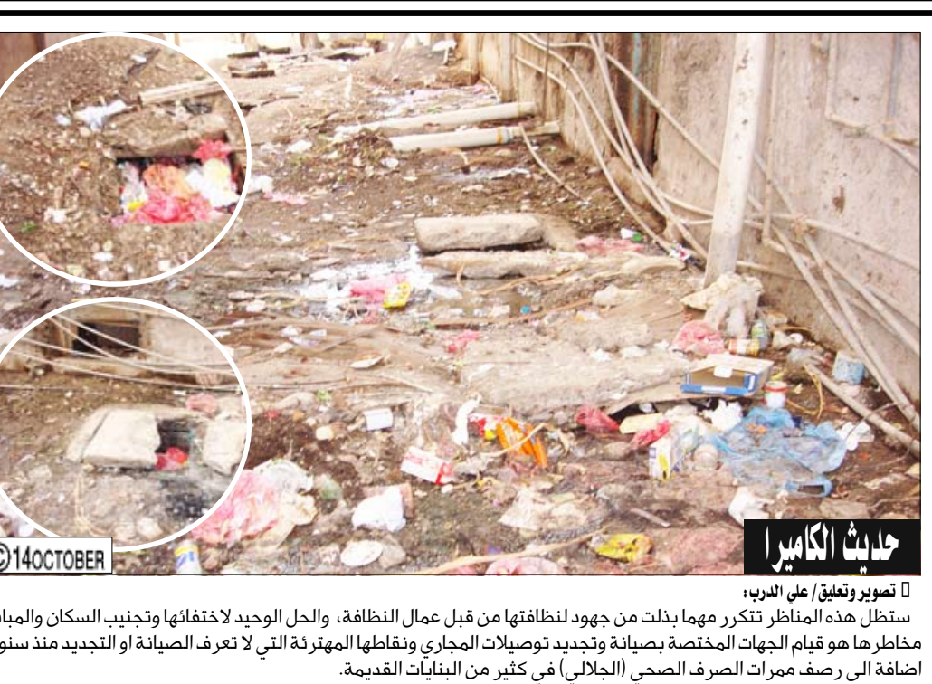
تصوير وتعليق على الوباء: ستظل هذه المناظر تنكرر مهما بذلت من جهود لانتظافتها من قبل عمال النظافة، والحل الوحيد لاختفائها وتجنب السكان والمباني مآظرها هو قيام الجهات المختصة بصيانة وتجديد توصيلات المجاري ونقاطها المهترئة التي لا تعرف الصيانة أو التجديد منذ سنوات إضافة إلى تصف مرمرات الصرف الصحي (الجلالي) في كثير من البنايات القديمة.