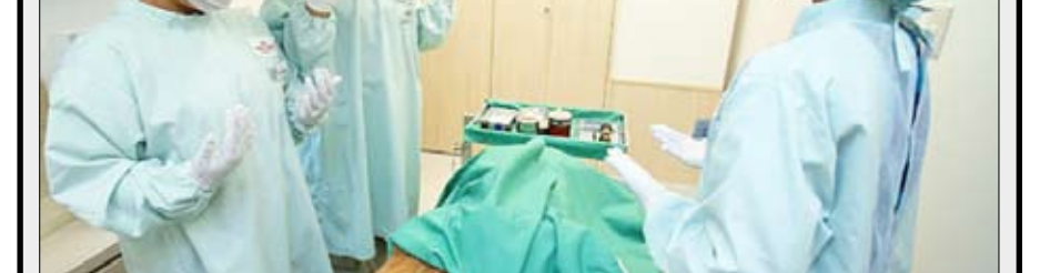
تدريب على الطب البيطري في مدينة الأطفال في الصين