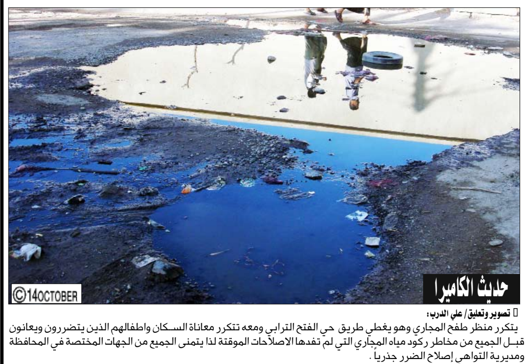
حادثة الكاميروا : تصوير وتعليق / علي الدبر: يتكرر منظر طغخ المجاري وهو يعطلى طريق حي الفتح الترابي ومعه تنكرو معاناة السكان وأطفالهم الذين يتضررون ويعانون قبل الجمع من مخاطر ركود مياه المجاري التي لم تعد لها الإصلاحات الموقته لذا يتمنى الجميع من الجهات المختصة في المحافظة ومديرية التواري إصلاح الضرر جذرياً .