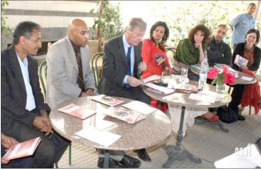
خلال احتفال المركز الثقافي الفرنسي بصنعاء بمرور 40 عاماً على تأسيس منظمة الفرنكفونية