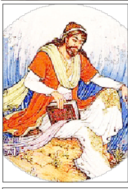
الخليل بن أحمد الفراهيدي