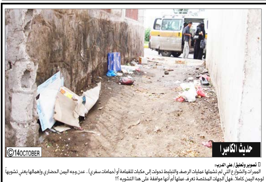
جديث الكاميرا تصوير وتعليق/ علي الدوب: عن وجه اليمن الحضاري وإهمالها يعني تشويهها الممرات والشوارع التي لم تشملها عمليات الرصف والتبليط تحولت إلى مكبات للقمامة أو (حمامات سفري).. عن وجه اليمن الحضاري وإهمالها يعني تشويهها لوجه اليمن كاملا.. فهل الجهات المختصة تعرف عملها أم أنها موافقة على هذا التشويه!!!