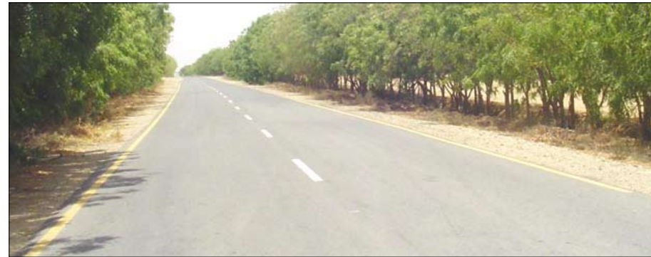
منظر من إحدى طرقات مديريات حجة