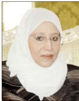
د. هدى البان

أشادت وزيرة حقوق الإنسان الدكتورة هدى البان بالتوصيات التي خرجت بها قمة حقوق المرأة التي اختتمت أعمالها في العاصمة التركية أنقرة مؤخراً ووصفتها بالتميز. وأشارت الدكتورة البان لوكالة الأنباء اليمنية (سبأ) لدى عودتها أمس إلى صنعاء بعد مشاركتها في القمة إلى أن التوصيات أكدت في مجملها دور المرأة المتميز في المجتمع وأهمية تضامير الجهود لتوفير المناخات والأجواء الملائمة لمناقشة قضايا المرأة بحرية وشفافية دون أي تحفظ لنيل كافة حقوقها المشروعة. وأضافت أن القمة هدفت إلى توحيد الأفكار والمفاهيم والعمل على تنفيذ الخطط والاستراتيجيات الخاصة المتعلقة بالمرأة وإيجاد شراكة متميزة بين الدول حول مجمل قضايا المرأة ودعم حقوقها ومكافئتها في المجتمعات على المستوى المحلي والدولي.