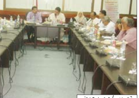
المجلس المحلي لمحافظة عدن في اجتماعه أمس

تقرير مقدم من قبل نائب مدير مكتب الأشغال العامة حول ما تم مختلف الإشكاليات التي تعترض مشاريع الطرق. كما استمع المجلس المحلي إلى