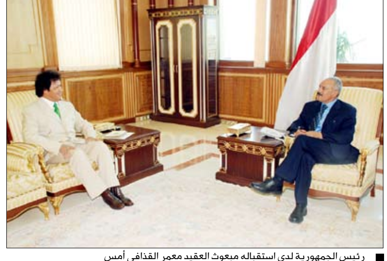
رئيس الجمهورية لدى استقباله مبعوث العقيد معمر القذافي أمس

استقبل فخامة الأخ الرئيس علي عبدالله صالح رئيس الجمهورية أمس في مقره في صنعاء مبعوث العقيد معمر القذافي قائد ثورة الفاتح من سبتمبر بالجمهورية العربية الليبية الشعبية الاشتراكية العظمى الذي نقل لفخامة الأخ الرئيس الجمهورية رسالة من أخيه العقيد معمر القذافي تضمنت الدعوة لفخامته إلى حضور أعمال الدورة الثمانية والعشرين لمجلس جامعة الدول العربية على مستوى القمة. وأشارت الرسالة إلى أن من أهم القضايا التي ستناقشها القمة هي السعي لتطوير وتفعيل آليات ومؤسسات العمل العربي المشترك والعمل على كل ما من شأنه تحقيق وحدة الصف ومجابهة كافة التحديات التي تواجه الأمة وحماية حقوقها ومضالها. ونوه المبعوث الليبي بمبادرة