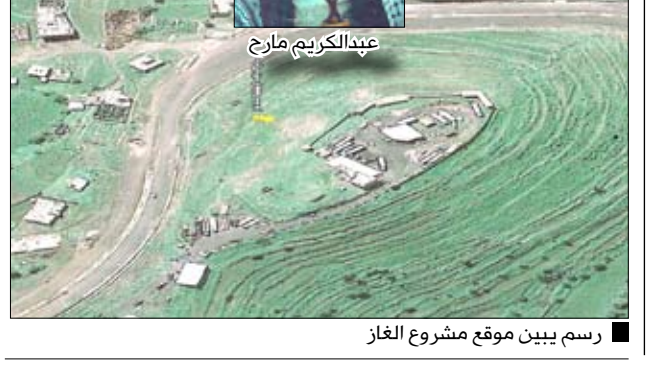
رسم بيان موقع مشروع الغاز