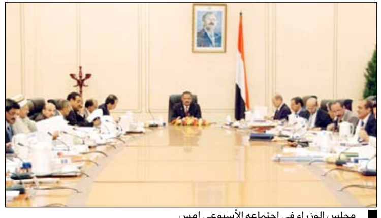
مجلس الوزراء في اجتماعه الأسبوعي امس

وقف مجلس الوزراء في اجتماعه الأسبوعي امس برئاسة رئيس المجلس الدكتور علي محمد مجور أمام توجيه فخامة الأخ رئيس الجمهورية بشأن وضع الخطط والبدائل اللازمة لتنفيذ مشروع السكة الحديدية سواء من قبل الحكومة أو مستثمرين وذلك وفقاً لدراسات الجدوى الخاصة بهذا المشروع الحيوي. وشكل المجلس لجنة برئاسة نائب رئيس الوزراء للشؤون الاقتصادية وزير التخطيط والتعاون الدولي وعضوية وزراء النقل والأشغال العامة والطرق والمالية والمياه والبيئة لدراسة مقترحات ورؤى وزارة النقل ووضع الخطط والبدائل اللازمة لتنفيذ المشروع وطبقاً لتوجيهات فخامة الأخ رئيس الجمهورية وعلى أن تقدم اللجنة نتائج أعمالها إلى المجلس خلال فترة أقصاها شهر. وأكد المجلس أهمية هذا المشروع بإبعاده الاقتصادية والاجتماعية والحضارية.. مشيراً إلى أهمية إضافة محور خامس إلى المشروع يشمل خط العاصمة صنعاء إلى ميناء الحديدة على البحر الأحمر ومن مدينة صنعاء إلى مدينة عدن مروراً بمدينتي إب وتعز وذلك