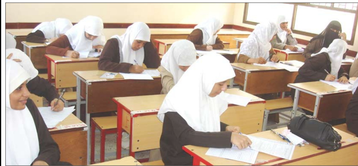
طالبات في المرحلة الثانوية

من المعلوم لدى الجميع أن التعليم بمفهومه الشامل يعد الوسيلة الوحيدة لبناء العقول وصقل المواهب التي يمكن الرهان عليها بثقة في انتشار مختلف الشعوب والمجتمعات البشرية من براثن الجهل والفاقة والمرض، ومختلف مظاهر التخلف، والنهوض بها للمضي قدماً في تلمس درب التقدم والتطور في مختلف مجالات التنمية.