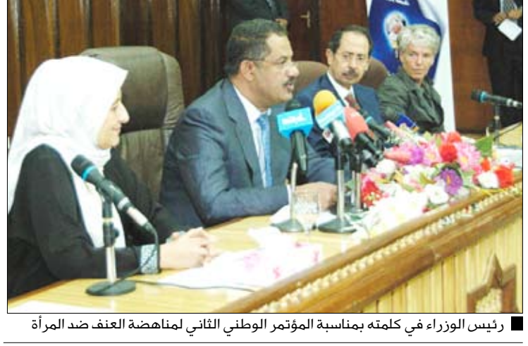
رئيس الوزراء في كلمته بمناسبة المؤتمر الوطني الثاني لمنهضة العنف ضد المرأة

صنعاء / سيا : دعا رئيس مجلس الوزراء الدكتور علي محمد مجور الأحزاب والتنظيمات السياسية إلى الارتقاء بمستوى النظرة للمرأة إلى مرتبة الشراكة الكاملة، باعتبار ذلك التزاماً مشتركاً من كل الأحزاب بتعيين الإيفاء به خلال المرحلة القادمة، وكذا الحرص على تجنب النظرة التقليدية التي تختزل المرأة إلى صوت انتخابي فقط في المواسم الانتخابية. وأعتبر رئيس الوزراء في كلمة ألقاها خلال حضوره يوم أمس الأحد المؤتمر الوطني الثاني لمنهضة العنف ضد المرأة الذي تنظمه اللجنة الوطنية للمرأة على مدى يومين، هذا المؤتمر رسالة قوية وواضحة لمنهضة العنف ضد المرأة وتعتبر عن إيمان الدولة اليمنية بالمرأة شريكاً فعالاً في مسيرة الديمقراطية والتنمية وفي استحقاق النهوض الحضاري لليمن في هذا العهد الحضوري المبارك وتأكيد التزام الحكومة بكل التوجهات التي اعتمدهت عبر السياسات والخطط والإستراتيجيات، فضلاً عن كونه يجسد الشراكة التي لا تقبل التراجع بين المرأة والرجل في إنجاز ما يعتبر التزاماً مشتركاً وثيقاً لكلا الجنسين تجاه الوطن وتقدمه وازدهاره.