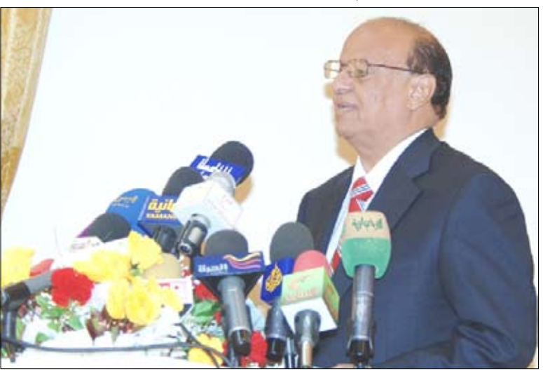
نائب رئيس الجمهورية يشن فعاليات «تريم» عاصمة للثقافة الإسلامية

تريم / سيا : دشن الأخ عبد ربه منصور هادي نائب رئيس الجمهورية يوم أمس الأحد فعاليات تريم عاصمة الثقافة الإسلامية للعام 2010م. وفي حفل الافتتاح ألقى نائب رئيس الجمهورية كلمة قال فيها " من ربوع مدينة تريم التاريخية، مدينة العلم والأدب والثقافة والتاريخ نعلن بسم الله وعلى بركة بدء فعاليات تريم عاصمة للثقافة الإسلامية". وأشار الأخ نائب رئيس الجمهورية إلى أن اختيار المنظمة الإسلامية للتربية والثقافة والعلوم (الإيسيسكو) مدينة تريم عاصمة للثقافة الإسلامية 2010م، هو محل فخر واعتزاز ليس فقط لأبناء هذه المدينة ولأبناء محافظة حضرموت فحسب، ولكن هو فخر لكل أبناء اليمن 22 من مايو العظيم. وقال "وبهذه المناسبة يعود بنا التاريخ ليذكرنا بتلك المواقب البمانية التي أسهمت في نشر الإسلام لبشع بنوره في أرجاء المعمورة متوهجاً بمبادئ وقيم الوسطية والاعتدال غامرة القلوب بالحق والعدل والحرية والمساواة بين بني الإنسان، جاعلة التقوى هي معيار الانتماء لهذا الدين القيم وشريعته السمحاء التي تنبذ العنف والغلو والتطرف". وأضاف نائب رئيس الجمهورية "إننا ونحن ندشن فعاليات تريم عاصمة للثقافة الإسلامية علينا أن نستلهم من الدور التاريخي الذي كان لهذه المدينة ولحضرموت بصفة خاصة ولليمن عامة القدرة الحسنة في نشر الإسلام لتدخل فيه شعوبها بكلها من خلال تقديم النموذج والمثال لعظمة هذا الدين ومبادئه التي جسدت في الصدق والأمانة وكل المعاني النبيلة التي جاء بها الإسلام". (التفاصيل ص 3)