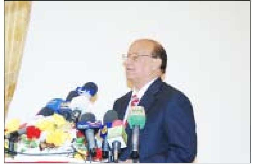
نائب الرئيس لدى القائه كلمة في الافتتاح