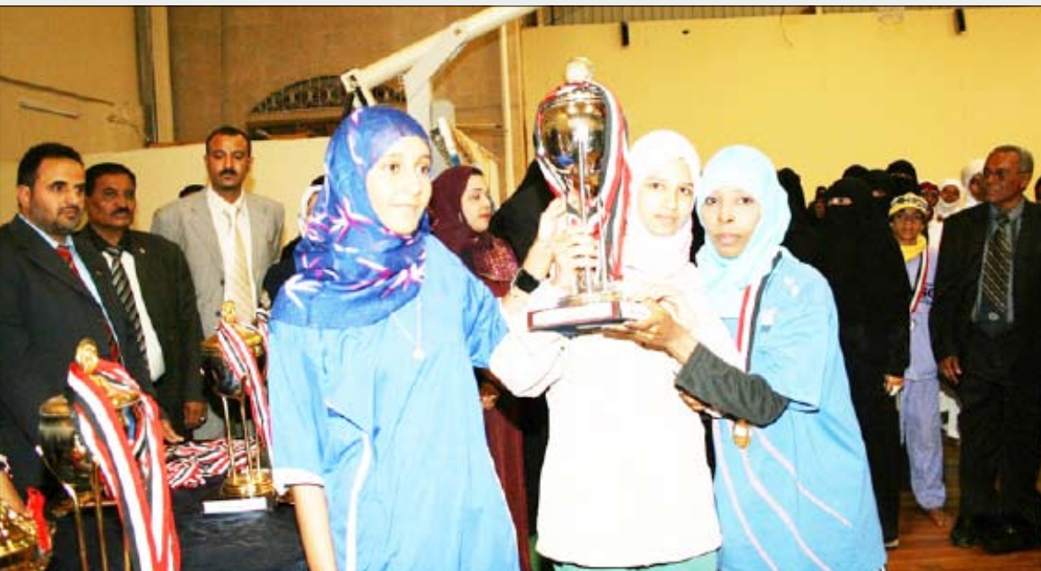
فتيات عدن بطلات فردي الطاولة وثاني الفرقي