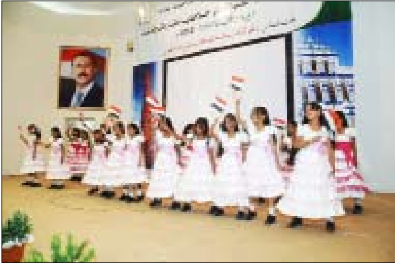
لوحة استعراضية لزهرات من مدارس وادي حضرموت