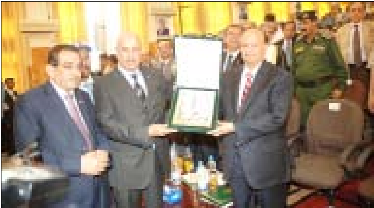
نائب الرئيس يتسلم درع احتفالية تريم عاصمة الثقافة الإسلامية من عبدالعزيز التويجري

وتوجه بالشكر إلى فخامة الأخ الرئيس علي عبدالله صالح رئيس الجمهورية على دعمه للمنظمة لاستمرار جهودها وأنشطتها.