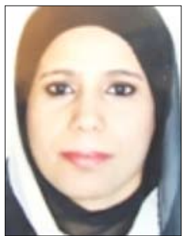
افتكار مازع القباطي

- المرأة العربية نفسها استكانت وخضعت للوضع العربي ولم تدافع عن حقوقها ومصالحها كما يجب. - طبيعة مجتمعاتنا العربية وثقافتها الذكورية حيث يتعامل مع المرأة عبر الرجل وهذا يعكس غياب اي تمثيل سياسي مؤثر او فاعل بل توجد كديكور للتاميع والتجميل وهذا ناتج كذلك عن