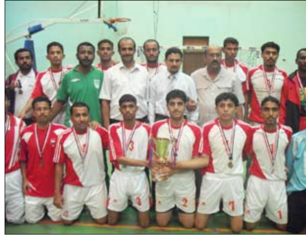
فريق ريبون حريضة صاحب المركز الثالث