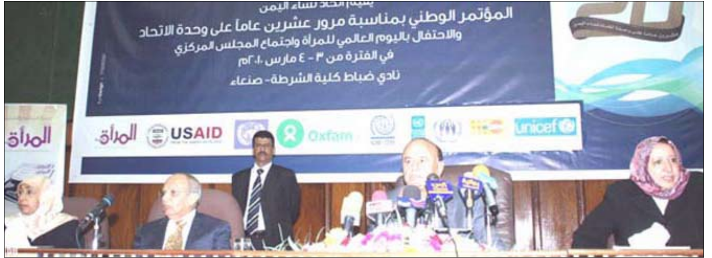
نائب رئيس الجمهورية لدى حضوره الاحتفال باليوم العالمي للمرأة