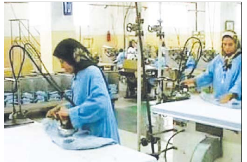
■ إمرأتان تعملان في مصنع