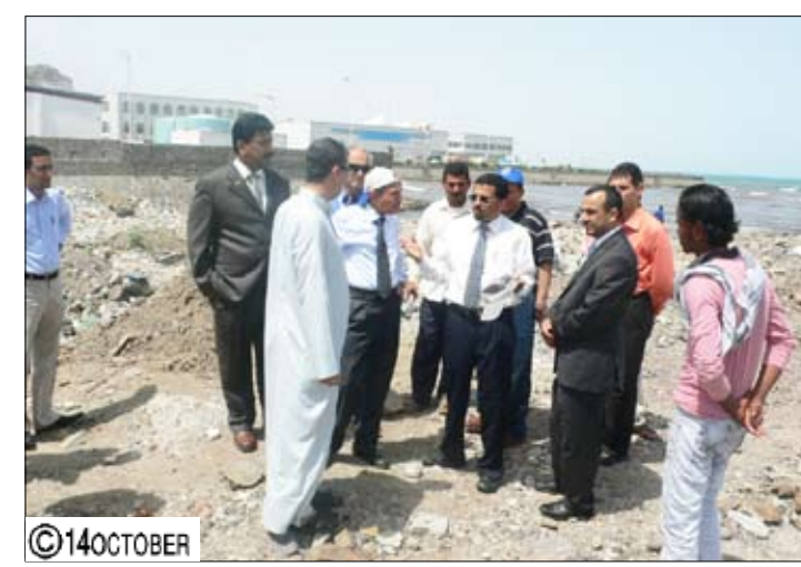
شائف يتفقد الموقع المحدد لبناء المركز