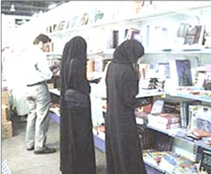
من فعاليات معرض الرياض الدولي للكتاب

وفي التفاصيل، فإن هناك عدة أمور طفت على السطح خلال الأيام الماضية، حيث بدأت الأمور بحمالية إدارة المعرض لدار النشر المعروفة «دار الجمل» باستبعاد ديوان شعري لأنه لا يمكن فسحه في السعودية لمخالفته الضوابط، وفيما تردت دار النشر تم سحب الديوان ومنعه، وفي ذات الوقت قال الناشر نفسه إن إدارة المعرض