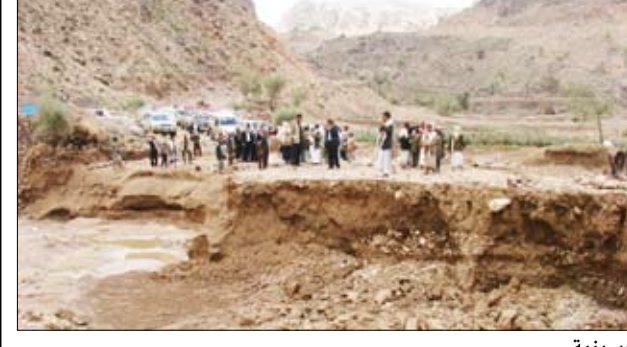
الكرشمي والعمرى يتفقدان حجم الأضرار التي لحقتها السيول بطريق ذمار- الحسينية