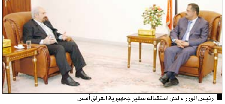
رئيس الوزراء لدى استقباله سفير جمهورية العراق أمس

صنعاء / سيا : استقبل رئيس مجلس الوزراء الدكتور علي محمد مجور يوم أمس الأحد سفير جمهورية العراق بضعة سعادة السفير طلال جميل العبيدي بمناسبة انتهاء فترة عمله لدى اليمن . وجرى خلال اللقاء تناول العلاقات الثنائية بين البلدين الشقيقين وما تشهده من تطور مستمر لاسيما في المجالين السياسي والثقافي. كما تم التطرق أثناء اللقاء إلى الانتخابات التي تشهدها العراق اليوم وما تملته من أهمية في تأسيس مرحلة جديدة في تاريخ العراق الشقيق. ولفت رئيس الوزراء إلى خصوصية العلاقات القائمة بين الشعبين اليمني والعراقي، مشيداً بالدور الملموس الذي قام به السفير العبيدي في خدمة العلاقات الأخوية خلال فترة عمله محرباً عن تمنيته للعراق