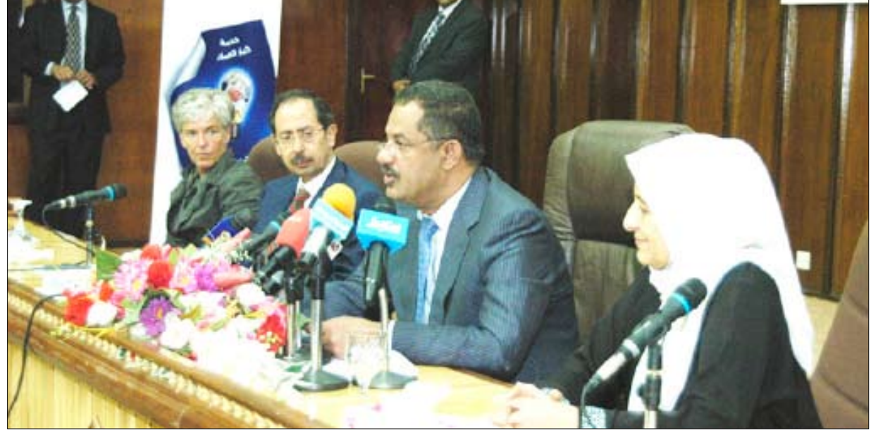
■ د. مجور في كلمته في المؤتمر الوطني الثاني لمناهضة العنف ضد المرأة

التوجيهات التي صدرت من فخامة رئيس الجمهورية لتوسيع مشاركة المرأة في المواقع القيادية إضافة نوعية إلى ما تحقق لها