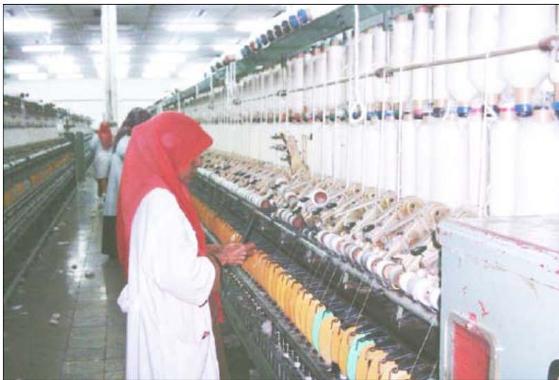
■ المرأة العاملة في مصنع الغزل