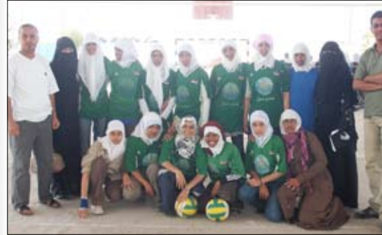
فريق مديرية المنصورة