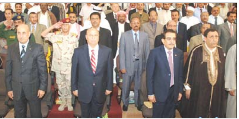
نائب الرئيس في حفل التشيبي

تريم / سيا : حضر نائب رئيس الجمهورية عبدربه منصور هادي مساء أمس الحفل الفني التشيبي لانطلاق