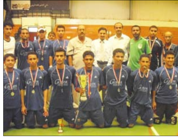
فريق الجلاء من عدن وصيف البطل