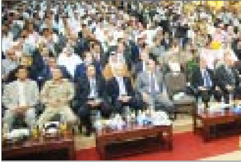
جانب من الوفود المشاركة من الدول العربية والإسلامية