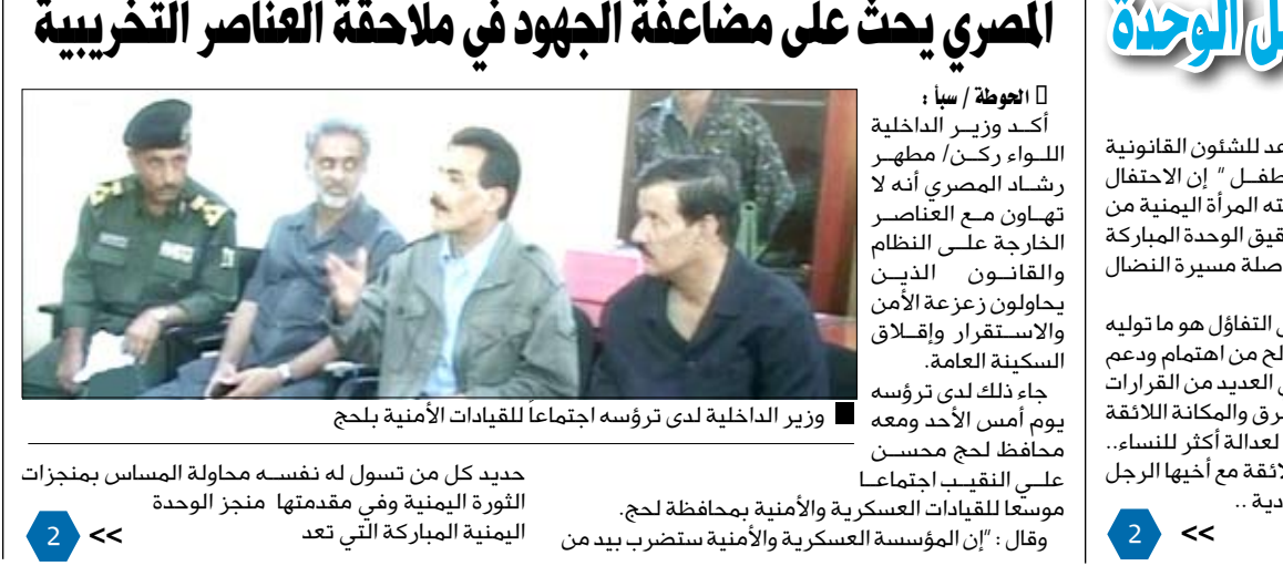
وزير الداخلية لدى ترؤسه اجتماعا للقيادات الأمنية بلحج

الحوطة / سيا : أكد وزير الداخلية اللواء ركن/ مطهر رشاد المصري أنه لا تهاون مع العناصر الخارجة على النظام والقانون الذين يحاولون زعزعة الأمن والاستقرار وإفلاق السكينة العامة. جاء ذلك لدى ترؤسه يوم أمس الأحد ومعه محافظ لحج محسن علي النقيب اجتماعاً موسعاً للقيادات العسكرية والأمنية بمحافظة لحج. وقال : "إن المؤسسة العسكرية والأمنية ستضرب بيد من حديد كل من تسول له نفسه محاولة المساس بمنجزات الثورة اليمنية وفي مقدمتها منجز الوحدة اليمنية المباركة التي تعد