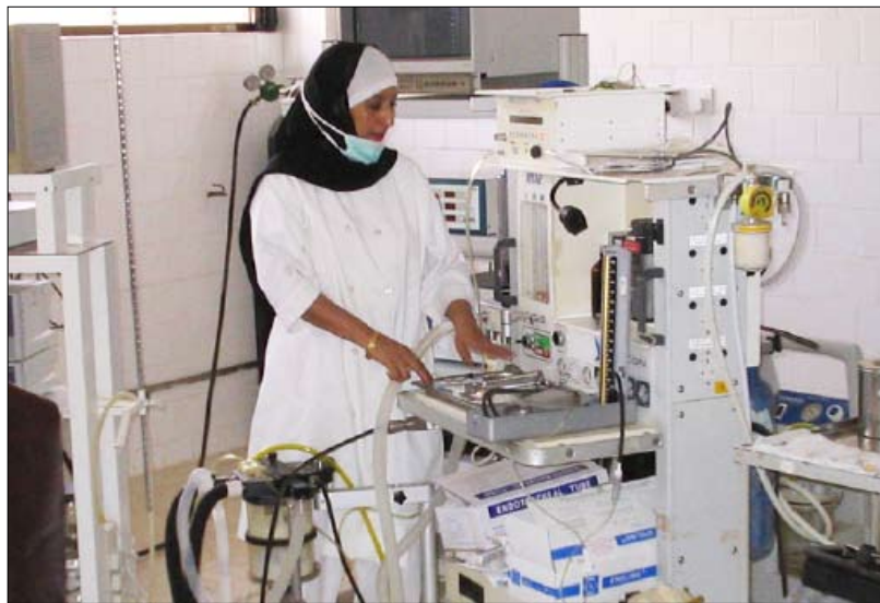
■ دكتورة في مستشفى الوحدة بعن