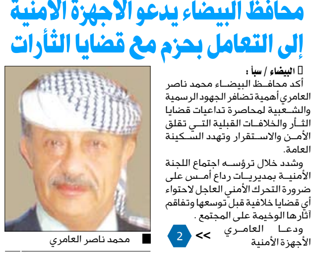
محمد ناصر العامري

البيضاء / سيا : أكد محافظ البيضاء محمد ناصر العامري أهمية تصافير الجهود الرسمية والشعبية لمحاصرة تداعيات قضايا الثأر والخلافات القبلية التي تقلق الأمن والاستقرار وتهدد السكينة العامة. وشدد خلال ترؤسه اجتماع اللجنة الأمنية بمديريات رداع أمس على ضرورة التحرك الأمني العاجل لاحواء أي قضايا خلافية قبل توسعها وتفاقم آثارها الوخيمة على المجتمع . ودعا العامري الأجهزة الأمنية