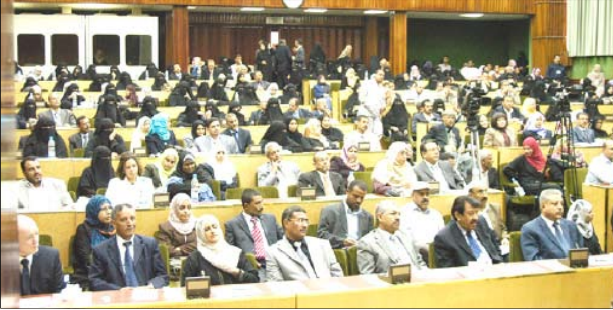
■ جانب من الحضور في المؤتمر