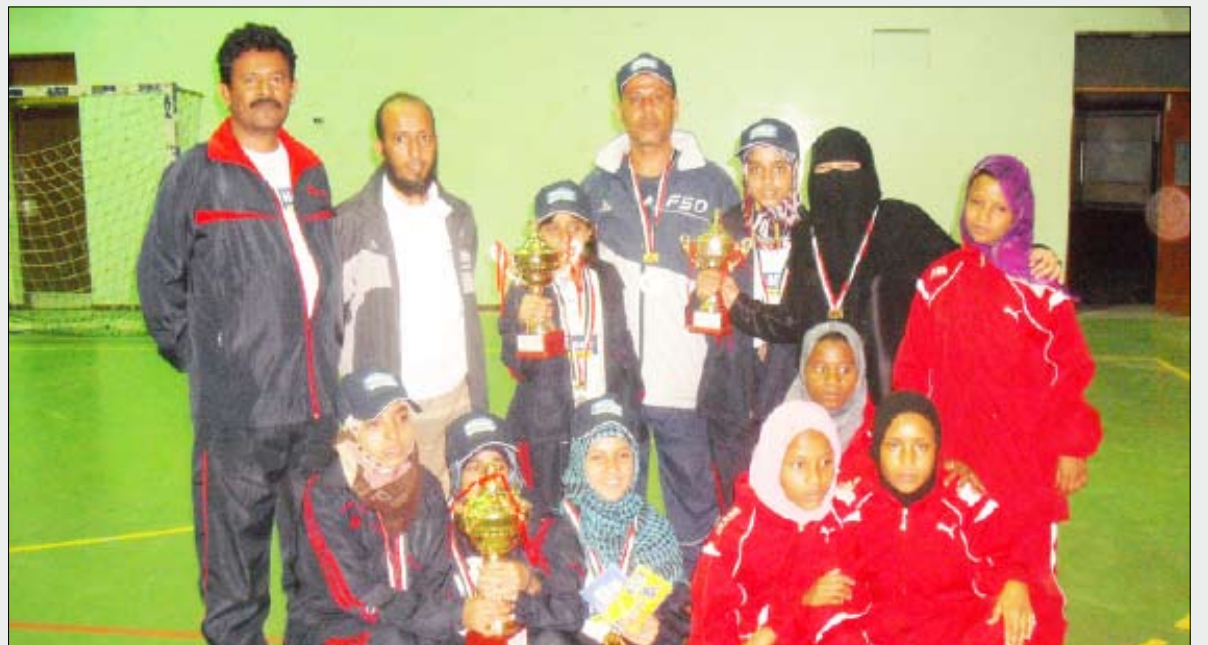
مركز تعز بطل الطاولة