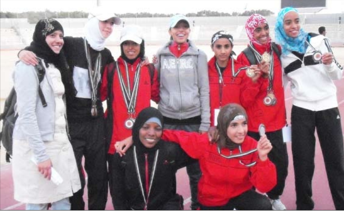
المنتخب الوطني لألعاب القوى وصيف بطل العرب في الأردن

اتحاد المرأة.. عمر قصير وإنجازات كثيرة شُرفت اليمن خارجياً