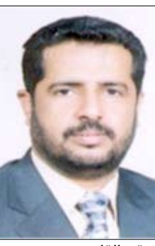
العلامة عبد المحسن العبيكان