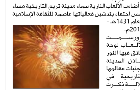
أضواء الألعاب النارية سماء مدينة تريم التاريخية مساء أمس احتفاء بتدشين فعاليات عاصمة للثقافة الإسلامية لعام 1431هـ -

ورسمت الألعا لوحة عائق فيها النور مآذن المدينة وجنبات معالمها التاريخية في دلالة كشرت بواقع الدور الذي أدته المرأة وأبناؤها في نشر نور الرسالة السماوية الخالدة إلى كثير من مناطق العالم . اعتلت فيها تريم عرش المجد وكسي جبينها اكليل غار في يوم حصادها ما زرعت من بذور الخير والمحبة وخدمة العلم والعلماء واحقاقها بالإسلام الذي بالتسويق مع وانجيس من غلال الضوء المنمالة على تريم صور من التاريخ وهي تؤدي دورها المشهود في تصدير العلم والعلماء إلى أصقاع الأرض وما ضربه من أروع الملاحم في النيل وشهامة الإنسان اليمني الممتلئ بمكارم الأخلاق . وسافرت المدينة في نفوس ساكنيها والمحتفين بها والناظرين إليها بالقلوب قبل العيون، شعورا بفخر وأحساس وسمو وعزيمة على اكمال الدور الذي تصدرت به تريم من العالم كحاضرة للثقافة الإسلامية .