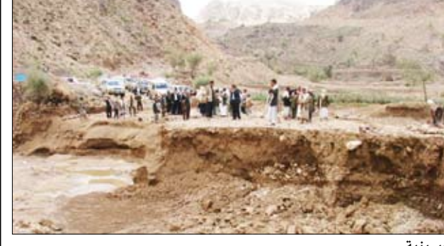
الكرشمي والعمرى يتفقدان حجم الأضرار التي لحقتها السيول بطريق ذمار- الحسينية