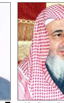
د. يوسف القرظاوي

14 أكتوبر / مناسبات : أشاد العلامة الدكتور يوسف القرظاوي بقانون تحديد سن الزواج ووصفه بأنه حيوي وضروري ومهم للمجتمع ، ويرى فضيلته أن سن 16 عاما هي الأنسب لزواج الفتاة و18 عاما أنسب لزواج الفتى ، وكان الشيخ العلامة عبد المحسن العبيكان مستشار الديوان الملكي وعوض هيئة كبار العلماء بالسعودية قد أكد أن هناك خلطاً عند الحديث عن الحلال والحرام وعند درء المفاسد ، وأنه في قضية زواج القاصرات هناك مصلحة عامة يجب أن تراعى ، لافتاً إلى أن بعض أولياء الأمور يلجؤون لتزويج فتياتهم من كبار السن لتحقيق مصلحة شخصية لهم دون مراعاة لمصلحة البنت ، وفيما يتعلق باستشهاد البعض بأن النبي صلى الله عليه وسلم تزوج من عائشة وهي ابنة ، فقد أكد الشيخ العبيكان أن هذه المسألة لا يقاس عليها ، خاصة إذا عرفنا أن وليها كان أبا بكر ، وزوجها كان رسول الله صلى الله عليه وسلم ، أي أن المفسدة هنا كانت مستعجلة تماماً ، بعكس العصر الراهن المليء بالمفاسد ، لدرجة أننا نرى أن الوالد مدمن المخدرات يزوج ابنته من أجل المال ومن أجل مصلحته الشخصية على حساب ابنته ، وهو ما ذهب إليه علامة الحجاز الشيخ العلامة ابن عثيمين رحمه الله عندما استحسن منع الآباء من تزويج بناتهم الصغيرات حتى يبلغن ويسأذنن فقال : (المسألة عندي أي تزويج الصغيرة . أن منعها أحسن ، ومن الناحية الانضباطية في الوقت الحاضر ، أن يمنع الأب من تزويج ابنته مطلقاً حتى تبلغ وتسأذن ، ولا