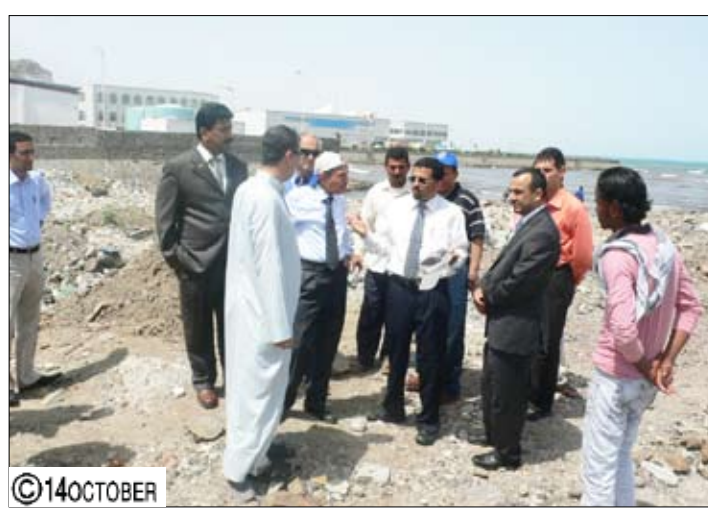
شائف يتفقد الموقع المحدد لبناء المركز