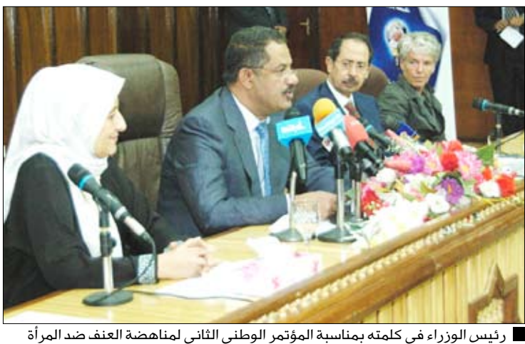
رئيس الوزراء في كلمته بمناسبة المؤتمر الوطني الثاني لمناهضة العنف ضد المرأة

وقال رئيس مجلس الوزراء "يتفقد هذا المؤتمر بعد يوم من الاجتماع الذي عقده المجلس الأعلى للمرأة وهو أرفع إطار رسمي والاجتماعية ويمثل تطوراً مؤسسياً". (التفاصيل 3)