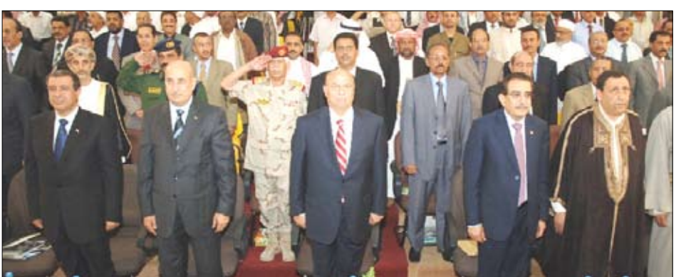
نائب الرئيس في حفل التشيبي

تريم / سيا : حضر نائب رئيس الجمهورية عبدير منصور هادي مساء أمس الحفل الفني التشيبي لتطلقات الفعاليات الاحتفالية بتريم عاصمة الثقافة الإسلامية 2010م بساحة منفذ بن يحيى بمدينة تريم. وبعد أن بارك نائب الرئيس انطلاق