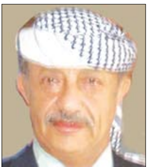
محمد ناصر العامري

البيضاء / سيا : أكد محافظ البيضاء محمد ناصر العامري أهمية تضافر الجهود الرسمية والشعبية لمحاصرة تداعيات قضايا الثأر والخلافات القبلية التي تقلق الأمن والاستقرار وتهدد السكينة العامة. وشدد خلال ترؤسه اجتماع اللجنة الأمنية بمديريات رداع أمس على ضرورة التحرك الأمني العاجل لاحواء أي قضايا خلافية قبل توسعها وتفاقم آثارها الوخيمة على المجتمع. ودعا العامري على المجتمع الأجهزة الأمنية