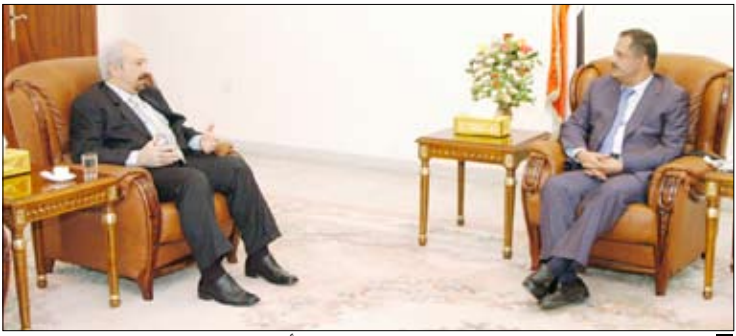
رئيس الوزراء لدى استقباله سفير جمهورية العراق أمس

الشقيق دوام التقدم والنجاح في تجاوز تحدياته الرهنة وللحلاقات الثنائية الأخوية دوام النماء والتطور في كافة الميادين السياسية والاقتصادية والثقافية والاجتماعية. بدوره أكد السفير العراقي مثانة العلاقات بين الشعبين الشقيقين في مختلف الظروف التي مر بها البلدان وأعرب عن شكره للقيادة السياسية اليمنية على ما حظي به من تعاون ورعاية أثناء فترة عمله.