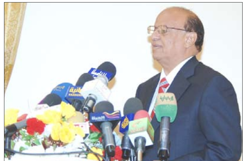
نائب رئيس الجمهورية يدشن فعاليات «تريم» عاصمة للثقافة الإسلامية

تريم / سيا : دشن الأخ عبد ربه منصور هادي نائب رئيس الجمهورية يوم أمس الأحد فعاليات تريم عاصمة الثقافة الإسلامية للعام 2010م. وفي حفل الافتتاح ألقى نائب رئيس الجمهورية كلمة قال فيها " من ربوع مدينة تريم التاريخية، مدينة العلم والأدب والثقافة والتاريخ نعلن بسم الله وعلى بركة بدء فعاليات تريم عاصمة للثقافة الإسلامية". وأشار الأخ نائب رئيس الجمهورية إلى أن اختيار المنظمة الإسلامية للتربية والثقافة والعلوم ( الأيسيسكو) مدينة تريم عاصمة للثقافة الإسلامية 2010م، هو محل فخر واعتزاز ليس فقط لأبناء هذه المدينة ولا أبناء محافظة حضرموت فحسب، ولكن هو فخر لكل أبناء اليمن من 22 من مايو العظيم. وقال "وبهذه المناسبة يعود بنا التاريخ ليذكرنا بتلك المواقب اليمنية التي أسهمت في نشر الإسلام وليشجع بنوره في أرجاء المعمورة متوهجاً بمبادئ وقيم الوسطية والاعتدال غامرة العقول والقلوب بالحق والعدل والحرية والمساواة بين بني الإنسان، جاعلة التقوى هي معيار الانتماء لهذا الدين القيم وشريعته السمحاء التي تنبذ العنف والغلو والتطرف". وأضاف نائب رئيس الجمهورية "إننا ونحن ندشن فعاليات تريم عاصمة للثقافة الإسلامية علينا أن نستلهم من الدور التاريخي الذي كان لهذه المدينة ولحضرموت بصفة خاصة ولليمن عامة القدوة الحسنة في نشر الإسلام لندخل فيه شعوبنا بكلهمنا من خلال تقديم النموذج والمثال لعظمة هذا الدين ومبادئه التي جسدت في الصق والأمانة وكل المعاني النبيلة التي جاء بها الإسلام". (التفاصيل ص 3)