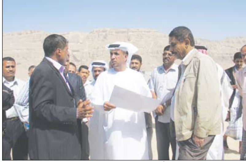
المدير التنفيذي مع وفد الهلال الأحمر الإماراتي