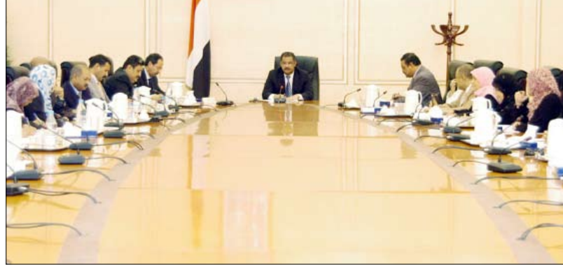
د. مجور يترأس اجتماع المجلس الأعلى للمرأة أمس

أقر المجلس الأعلى للمرأة في اجتماعه أمس برئاسة رئيس مجلس الوزراء الدكتور علي محمد مجور خطة اللجنة الوطنية للمرأة للفترة القادمة من العام الحالي 2010م . وأكد المجلس أهمية تضافر جهود جميع الجهات لتعزير نهج الدولة في الاهتمام بالمرأة اليمنية وترجمة حقوقها المشروعة التي كفلها الدستور والقوانين النافذة ، لما من شأنه توطيد دورها الحيوي في التنمية الاقتصادية والاجتماعية في مختلف المحاور والاتجاهات وعلى كافة المستويات . واطلع المجلس على تقرير اللجنة الوطنية حول مستوى إنجاز خطة العام المنصرم 2009م .. مشيراً إلى ان نسبة الإنجاز لمجمل الأنشطة المخطط لها وصل إلى 84 بالمائة . ولفت المجلس بهذا الخصوص الى اهمية التسريع في استكمال الاجراءات