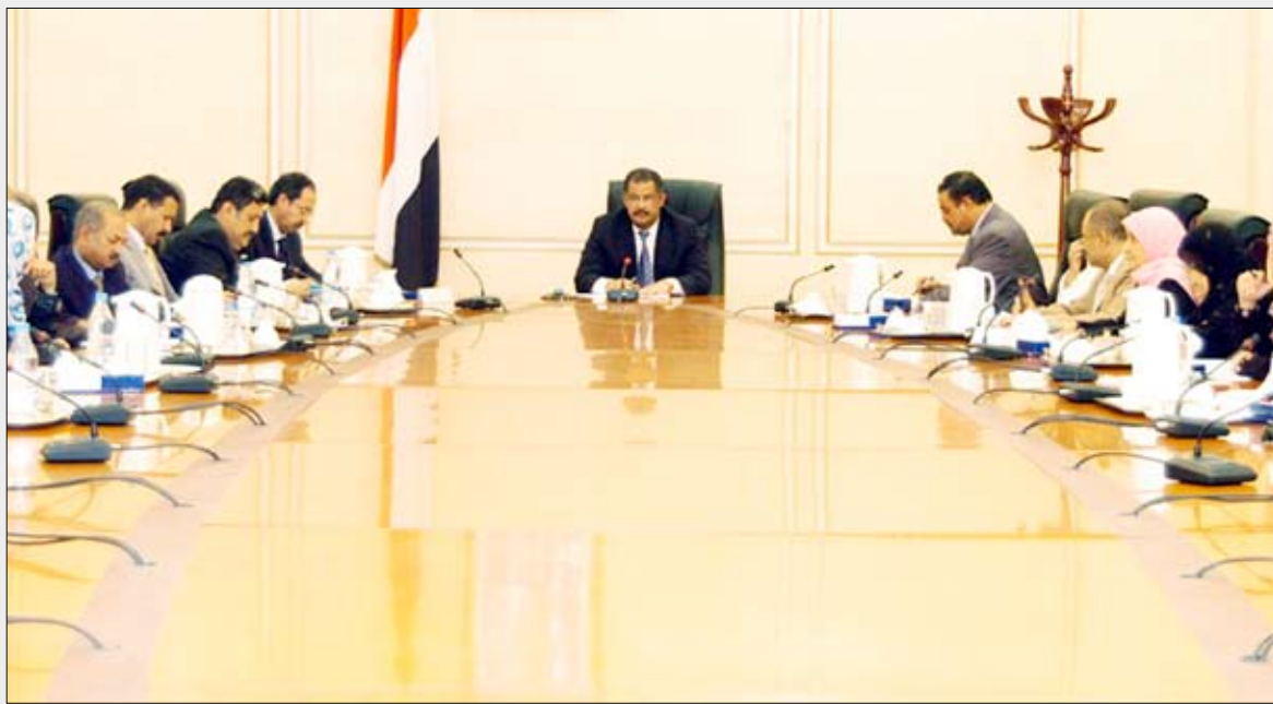
د. مجور يقر اجتماعاً للمجلس الأعلى للمرأة

وتتضمن الخطة مجموعة من البرامج والسياسات المعززة لحقوق المرأة موزعة على سبعة محاور تشمل، مواصلة إدماج النوع الاجتماعي في السياسات والبرامج الحكومية المركزية والمحلية، وفي الموازنات الحكومية القطاعية والمحلية، فضلاً عن تعزيز القدرات المؤسسية للجنة الوطنية، والتمكين السياسي والاقتصادي للمرأة وتعزيز البيئة التشريعية لحقوق المرأة وإبراز قضاياها في الداخل والخارج.