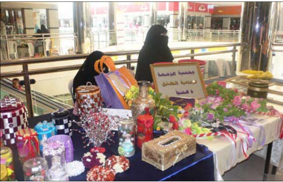
جمعية الرحمة لاعاقه الذهنيه