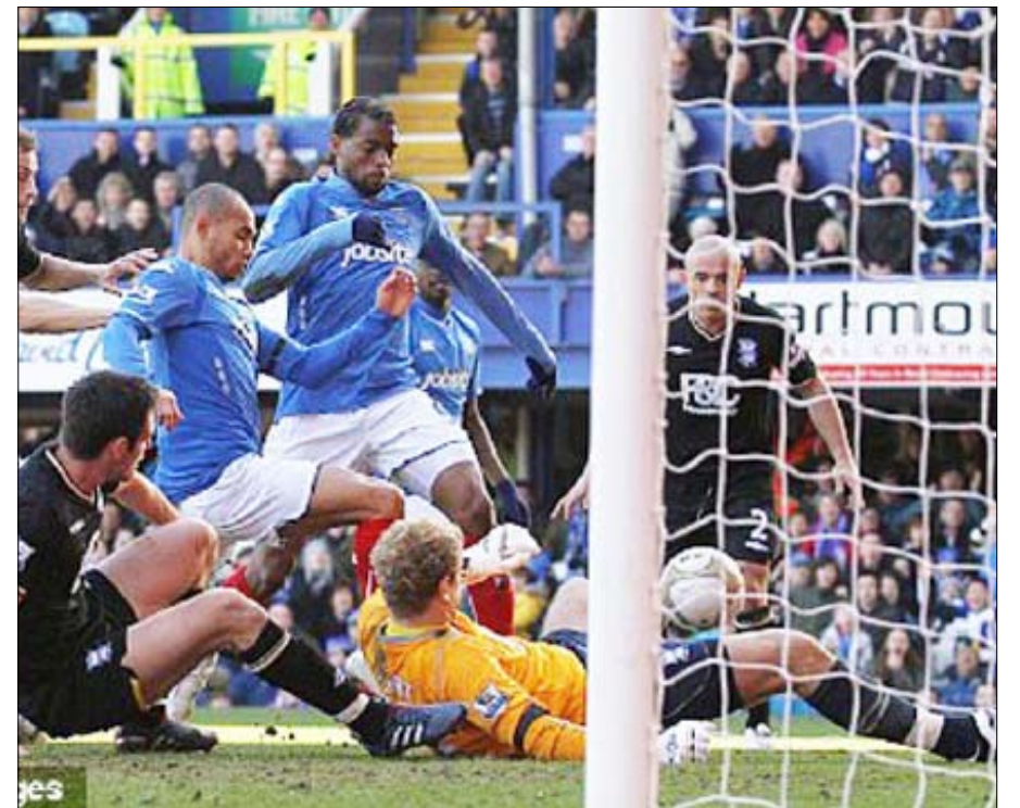
صراع مثير أمام مرمى بيرمنجهام