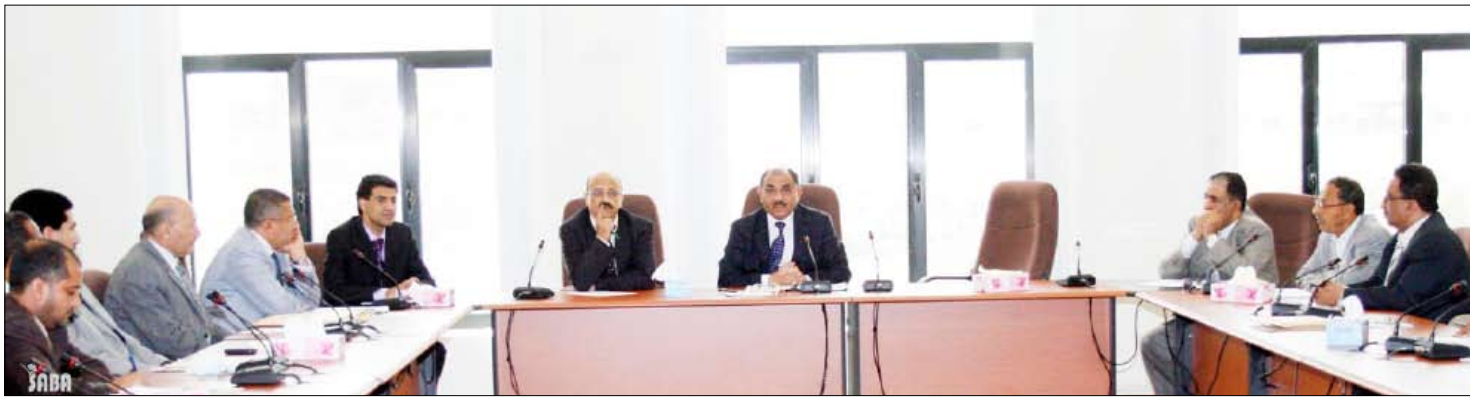
وزير الإعلام لدى ترؤسه اجتماع اللجنة التحضيرية للاحتفال بيوم الإعلام اليمني

مطبوع عن الوكالة يعرف بدورها ومراحل تطورها على مدى الأربعين عاما الماضية. إلى جانب إنتاج مادة تلفزيونية وثائقية عن الوكالة تبث في القنوات الفضائية تبرز نشاطها وريادتها في الساحة الإعلامية المحلية. كما أقر الاجتماع إنتاج عدد من النواتج التلفزيونية عن المؤسسات الإعلامية في اليمن بهدف تعزيز الصلة بينها وبين الشباب تقوم بتنفيذها قناة (أسيا) الفضائية. واطلع الاجتماع على الأسماء المقترحة تكريمها في هذا العام حسب المقترحات المقدمة من قبل قيادات المؤسسات الإعلامية ورؤساء القطاعات باعتبارهم يتحملون المسؤولية المباشرة في اختيار وتحديد الإعلاميين المكرمين بحسب المعايير المحددة لذلك. والزعم الاجتماع المؤسسات التي لم تقدم ترشيحاتها بضرورة الإسراع في رفع أسماء المكرمين حتى تكتمل قوائم التكريم هذا الأسبوع. وأقرت اللجنة إقامة فعاليات مصاحبة على هامش الاحتفال بهذا اليوم منها ندوة عن دور الإعلام وتنظيمها وكالة الأنباء