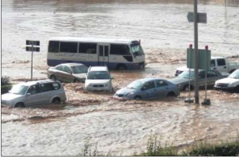
جانب من أضرار السيول والأمطار في المحافظة