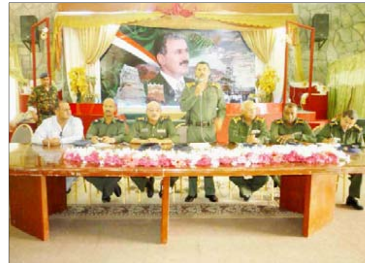
قيران في محاضرة بنادي ضباط الشرطة

مساعدي مدير الأمن لشؤون الموائن والمطار ولشؤون الشرطة ومديري شؤون الضباط والافراد والعلاقات العامة بأمن محافظة عدن. والقي الإخ مدير أمن عدن كلمة توجيهية أكد فيها على فرض هيبه النظام والقانون والعمل بالخطة الأمنية المتكاملة والخاصة بالاستعداد لاستقبال خليجي 20 وعكس صورة مشرفة لليمن، حيث ان بلادنا سوف تستقبل ضيوفا كبارا وشخصيات بارزة ومواطنين من دول الخليج العربي العام والخاص. د.عبدالله جمال عرب : تصوير/ علي النصري : في إطار تفعيل الخطة الأمنية لعام 2010م والخطة الأمنية المتكاملة لاستضافة الحدث الرياضي الكبير خليجي 20 وفي ختام الفعاليات التقى صباح أمس بقاعة نادي ضباط الشرطة في محافظة عدن العميد ركن عبدالله عبده قيران مدير أمن المحافظة بمدراء وضباط وصف ضباط وجنود المناطق الأمنية السادسة والسابعة والثامنة بحضور