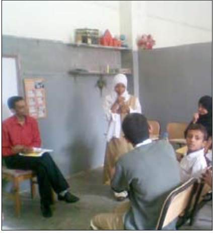
قراءة قصص مترجمة