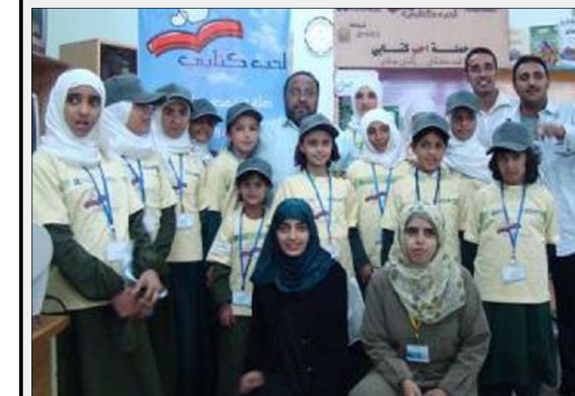
فريق صناع التغيير

□ صنعاء / يوسف عجلان : افتتح فريق صناع التغيير العالمي ضمن حملة أحب كتابي بالعاصمة صنعاء في فبراير الماضي أول مكتبة خاصة بالمعاقين ، وجاء ذلك الافتتاح بعد دراسة منظمة لمعرفة مستوى ونوع الكتب التي تتناسب مع هذه الشريحة .