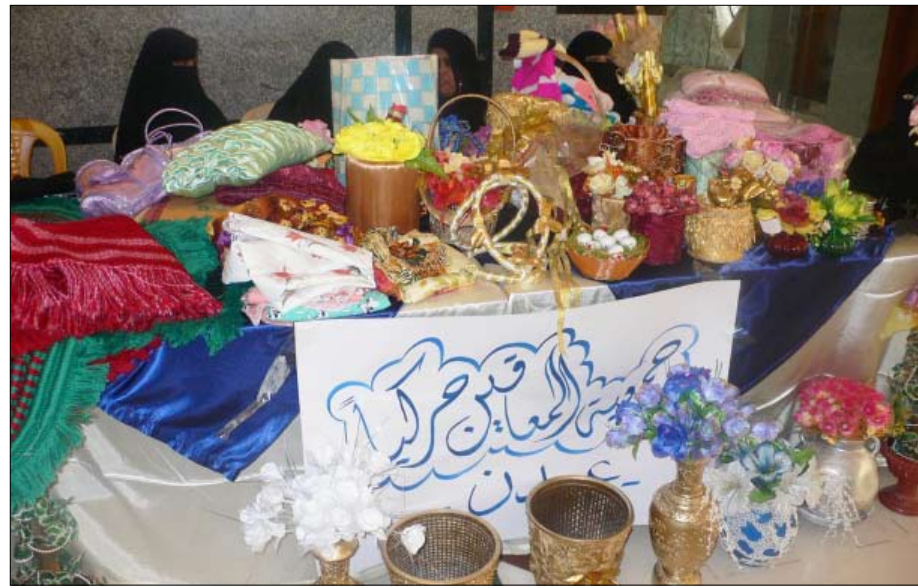
من منتجات جمعية المعاقين حركياً

صور تتكلم وتنطق بما عجزت اللسان عن وصفه لأعمال عبرت عن نفسها بنفسها وعن روح صانعيها،