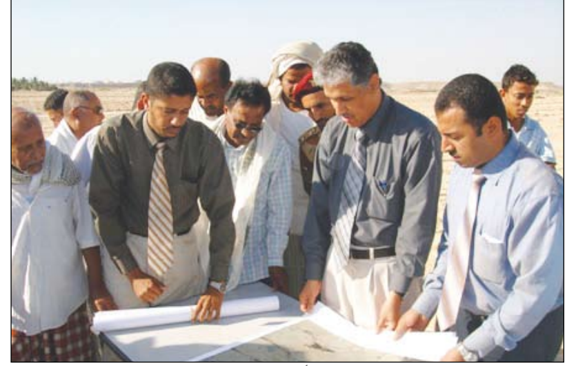
وكيل حضرموت ومدير الصندوق بالساحل أثناء زيارة تفقدية لمشروع المدن السكنية

مستحققاتها خلال الأسابيع القليلة القادمة، منوها أن إدارة الصندوق نفذت نزولا لمديرية غيل بن يمين في القطاعين الكلي والجزئي مؤكدا أن الفرق الهندسية ستنفذ نزولات ميدانية للمديرية لرفع البيانات للبدء في عملية صرف التعويضات للمتضررين في القطاعين .