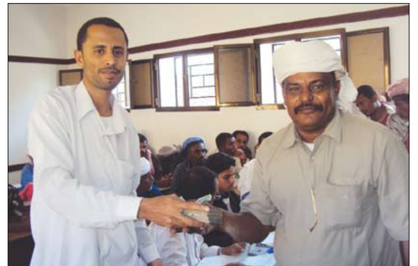
المتضررون من كارثة الأمطار والسيول أثناء تسلمهم التعويضات المالية