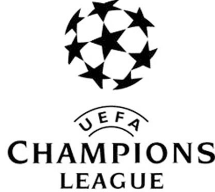
شعار مسابقة دوري أبطال أوروبا لكرة القدم

لروما / 14 أكتوبر / رويترز: تقدر سحب قرعة الدورين الربع والنصف النهائي من مسابقة دوري أبطال أوروبا لكرة القدم في 19 آذار (مارس) الجاري في نيون مقر الاتحاد القاري. وستكون القرعة مفتوحة، ما يعني أن فريقين من دولة واحدة يمكن أن يلتقيا وجها لوجه. وتقام مباريات ذهاب الدور الربع النهائي في 30 و31 من الشهر الجاري، ومباريات الإياب في 6 و7 نيسان (أبريل) المقبل، في حين تقام مباريات ذهاب الدور النصف النهائي في 20 و21، ومباريات الإياب في 27 و28 من الشهر نفسه. وتسحب في اليوم ذاته قرعة الدورين الربع النهائي والنصف النهائي لمسابقة «يوروبا ليغ» أيضا. وتقام مباريات الدور الربع النهائي في الأول والثامن من نيسان (أبريل)، والدور النصف النهائي في 22 و29 منه.