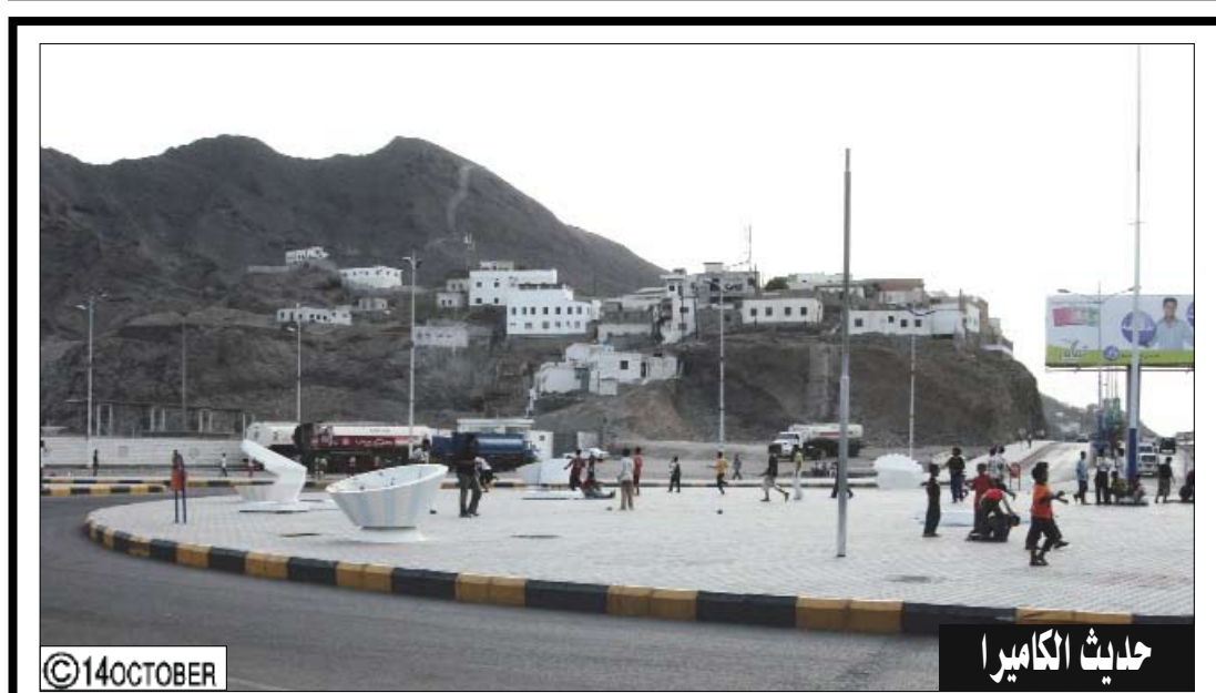
تصوير وتعليق / علي الدرب: مخاطر الحوادث المرورية تهدد حياة الأطفال الذين تعودوا على تحويل هذه الجوله الى ملعب لكرة القدم يستغرب الجميع عن موقف الجهات المختصة وكذا اولياء الامور الذين لم يقوموا بما يلزم حتى يمنعوا هذا التصرف حفاظا على حياة هؤلاء الاطفال.