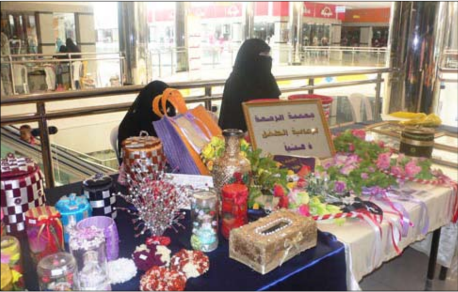
جمعية الرحمة للإعاقة الذهنية