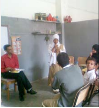
قراءة قصص مترجمة