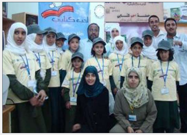
فريق صناع التغيير