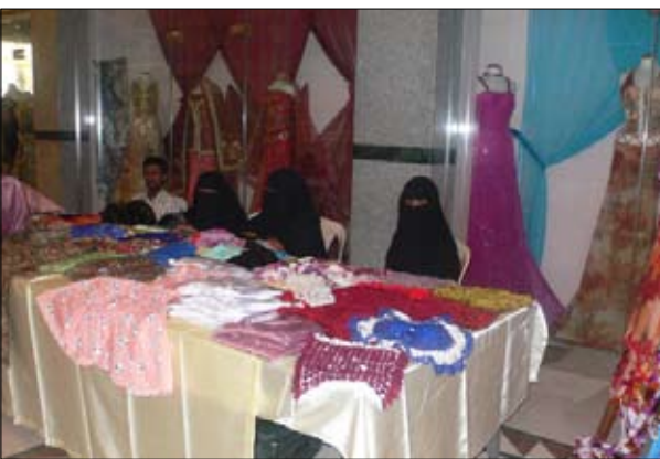
جمعية الصم والبكم