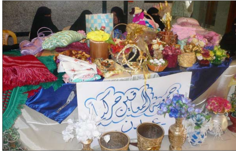
من منتجات جمعية المعاقين حركياً