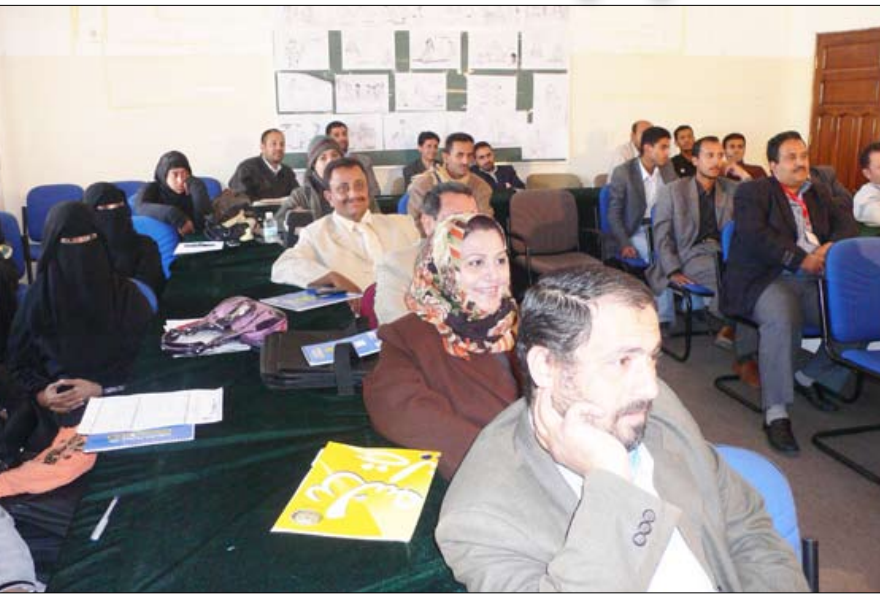
ورشنة تدريب للإعلاميين حول دليل الرسائل الصحية