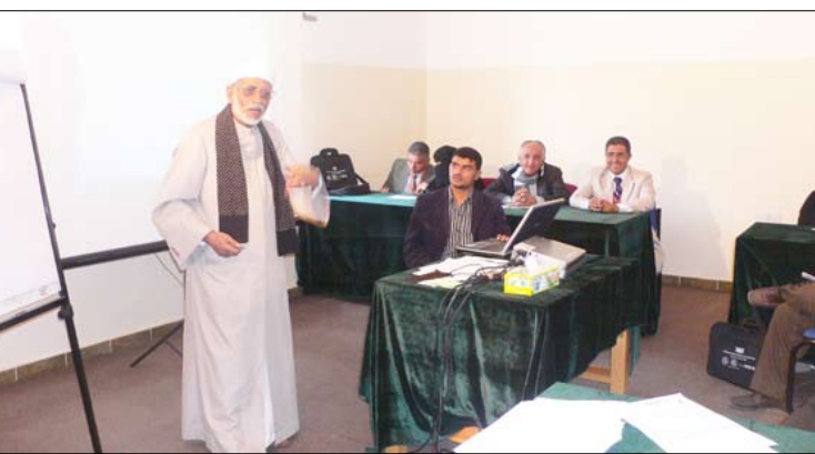
دورة تدريبية للإعلاميين