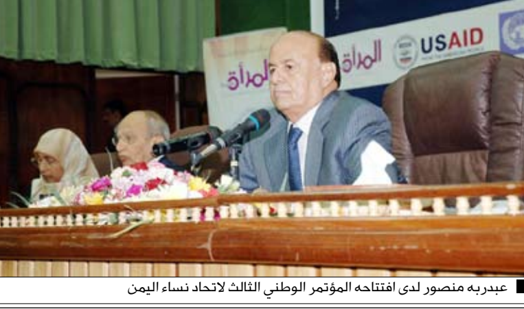
عبدربه منصور لدى افتتاحه المؤتمر الوطني الثالث لاتحاد نساء اليمن

أعلن الأخ عبدربه منصور هادي نائب رئيس الجمهورية عن اعتماد 120 درجة وظيفة للعلامات باتحاد نساء اليمن في مختلف محافظات الجمهورية ضمن الميزانية للعام القادم.. منوها بان هناك قرارات سوف تصدر بتعيين 11 امرأة وكيل وزارة و12 امرأة مديراً عاماً.