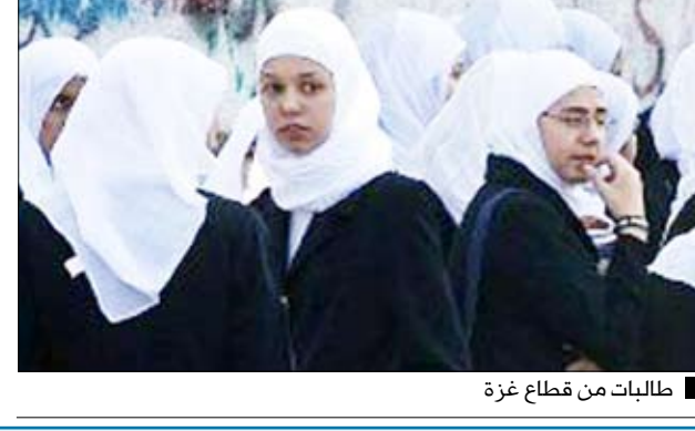
مطالبات من قطاع غزة

ابنته التي لا تتجاوز الـ17 من عمرها، فوراً. ويعتقد بذلك أن دوره انتهى بمجرد نهابها إلى بيت زوجها، لكنه لا يدرك من ثقل الأب في التعامل مع ابنته المطلقة ومع المجتمع كذلك الأمر.