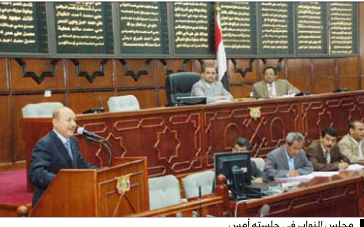
مجلس النواب في جلسته أمس

ناقش مجلس النواب في جلسته المنعقدة أمس برئاسة نائب رئيس المجلس حمير بن عبدالله بن حسين الأحمر تقرير اللجنة البرلمانية الخاصة بالمكلفة بتقصي الحقائق حول الأحداث والاختلالات الأمنية وتداعياتها بمحافظة إبين ولحج وذلك بحضور نائب رئيس الوزراء لشئون الدفاع والأمن وزير الإدارة المحلية الدكتور رشاد محمد العليمي.