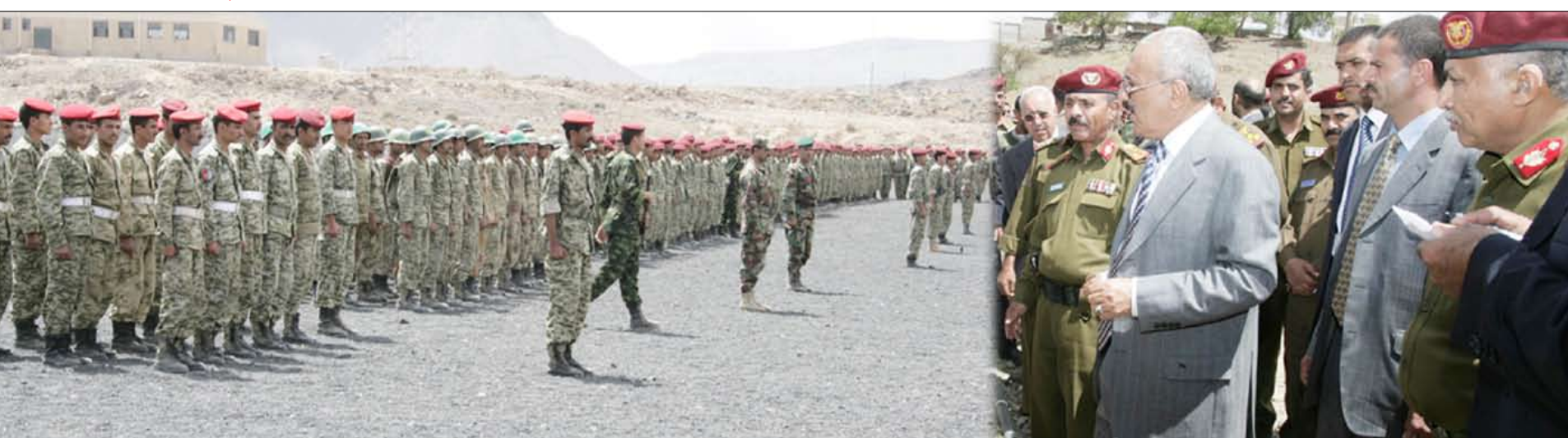
رئيس الجمهورية خلال تفقده معسكرات التدريب للقوات المسلحة أمس

قام فخامة الأخ الرئيس علي عبد الله صالح رئيس الجمهورية القائد الأعلى للقوات المسلحة أمس بزيارة إلى عدد من معسكرات التدريب للقوات المسلحة حيث كان في استقباله الأخوة قادة المعسكرات والضباط والصف والجنود.. حيث تفقد فخامتة أحوالهم وأطلع على سير برامج التدريب والتأهيل ومستوى تنفيذ خطة التدريب للعام التدريبي 2010م.