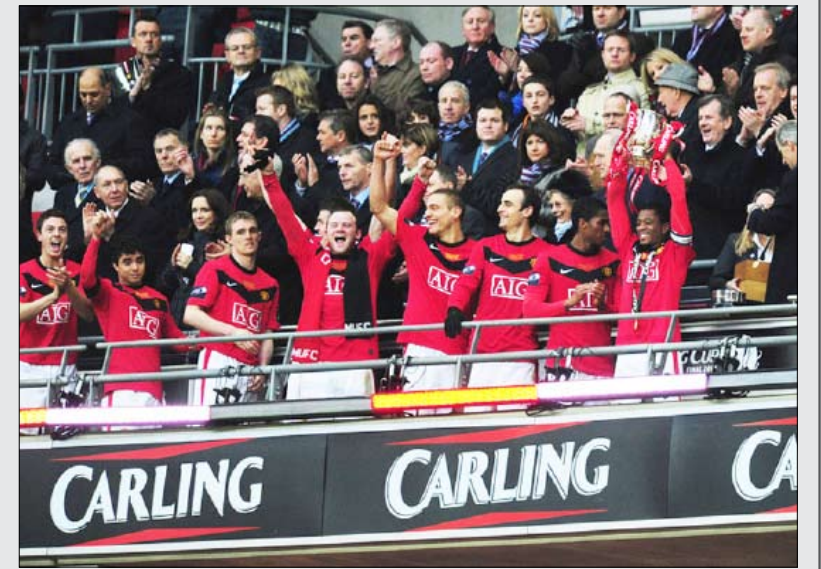
مانشستر يونايتد أثناء تسليم الميداليات

وهي المرة الأولى التي ينجح فيها مانشستر يونايتد في حسم مباراته على ملعب ويمبلي الجديد في الوقت الأصلي لأنه احتاج إلى ركلات الترجيح لحسم مباراته الست السابقة. وهذا الفوز هو الأول لمانشستر يونايتد على استون فيلا هذا الموسم وثار بالتالي لفوز الأخير عليه في عقر داره 1-0 صفر وهي الخسارة الوحيدة للشياطين الحمر على أرضهم هذا