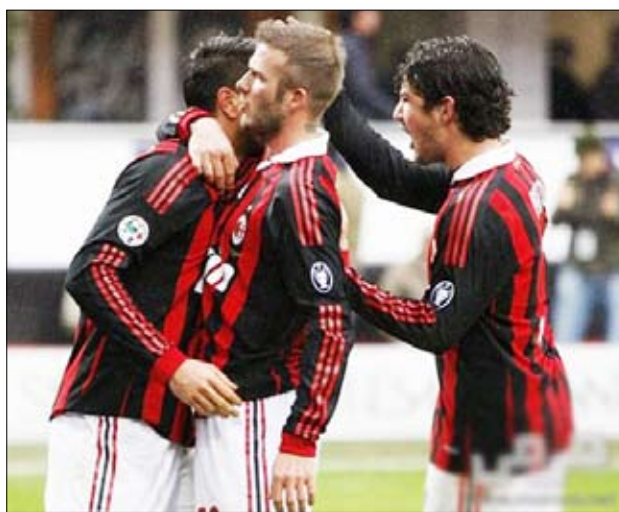
لاعبو ميلان يتبادلون التهاني باحد الاهداف

أهدر روما الثالث فوزا في المتناوّل على مضيفه نابولي وسقط في فخ التعادل 2-2. وتقدم روما بهدفين للبرازيلي جوليو باتيستا (59 من ركلة جزاء)