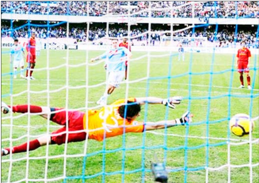
هدف لنابولي في مرمى روما

استعاد إنتر ميلان المتصدر وحامل اللقب في الأعوام الأربعة الأخيرة نغمة الانتصارات بفوزه الثمين على مضيفه أودينيزي 3 - 2 يوم أمس الأحد في المرحلة السادسة والعشرين من الدوري الإيطالي لكرة القدم، وواصل ميلان مطاردته بفوزه على ضيفه اتالانتا 3 - 1. وعزز إنتر ميلان موقعه في الصدارة برصيد 58 نقطة مقابل 54 لميلان.