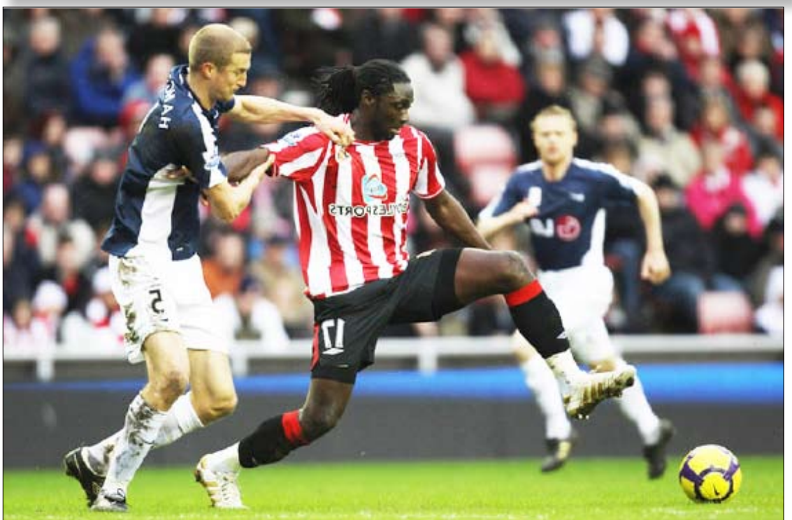
من لقاء توتنهام وايفرتون