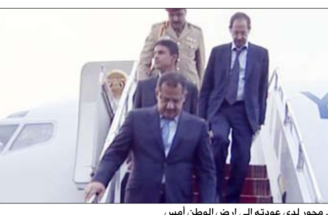
د. مجور لدى عودته إلى أرض الوطن أمس

المواضيع المتصلة بالعلاقات الثنائية الأخوية والدور الحيوي الذي يقوم به مجلس التنسيق بين البلدين في خدمة وتوطيد العمل المشترك في مختلف المجالات السياسية والاقتصادية والثقافية والتنموية. ووصف الدكتور مجور النتائج التي خرجت بها الدورة الـ 19 لمجلس التنسيق بالتميزة والمعزة لمسيرة المجلس في تنمية العلاقات والدفء بها إلى فضاءات جديدة في العمل المشترك المثمر. موضحاً أنه تم خلال هذه الدورة