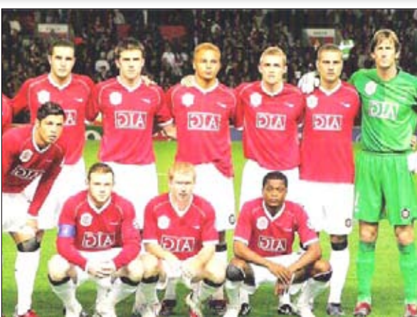
■ مانشستر يونايتد

إيفرتون ووست هام في الدوري المحلي. وتلقى مانشستر يونايتد ضربة قوية بإصابة قلب دفاعه ريو فرديناند في عضلات أسفل الظهر الثلاثاء الماضي خلال التمارين وسيعيب لفترة أسبوعين على الأقل عن الملاعب، لكن البديل جاهز في شخص ويس براون أو المانع الشاب جوني إيفانز ليلعب أحدهما إلى جانب الصربي الصلب نيمانيا فيديتش العائد بعد إصابة إبعده عن الملاعب زهاء شهر. في المقابل، يملك أستون فيلا أكثر من ورقة رابحة في مختلف خطوطه بدءا من حارسه العملاق الأميركي براد فريدل، وخط دفاعه بقيادة ريتشارد دان، ووسطه بقيادة البلغاري مارتن بتروف والجنحين الخطيرين أشلي يونغ وستيفن داونينغ، وصولا إلى خط هجومه بوجود السريع غابريال أغونولاهور والدولي إميل هيسكي. ويخوض كلا الفريقين النهائي الثامن في المسابقة، وسبق لأستون فيلا أن أحرز اللقب خمس مرات مقابل أربع لمانشستر، في حين يملك ليفربول الرقم القياسي بعد أن توج بطلا 7 مرات.