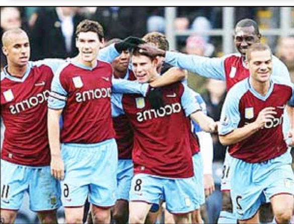
■ أستون فيلا