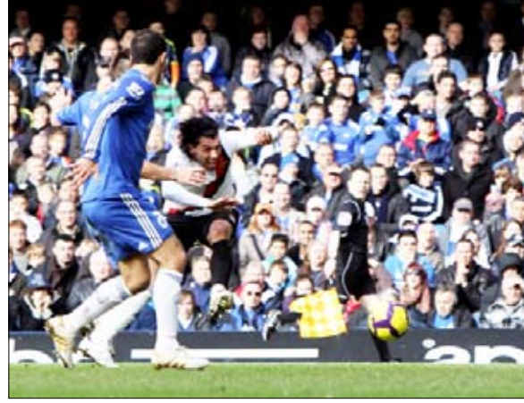
■ لقطة من مباراة مانشستر سيتي وتشيلسي