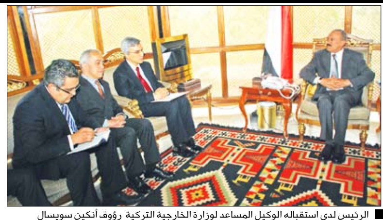
الرئيس لدى استقباله الوكيل المساعد لوزارة الخارجية التركية رؤوف أنكين سويسال

سبأ / سيا : استقبل فخامة الأخ الرئيس عبد الله صالح رئيس الجمهورية أمس ومعاه الأخ عبد ربه منصور هادي نائب رئيس الجمهورية، الوكيل المساعد لوزارة الخارجية التركية رؤوف أنكين سويسال مبعوث فخامة الرئيس التركي عبدالله غول.. الذي نقل لفخامة الأخ الرئيس رسالة خطية من أخيه فخامة الرئيس عبدالله غول، رئيس جمهورية تركيا تتعلق بالعلاقات الأخوية ومجالات التعاون المشترك بين البلدين وسبل تعزيزها وتطويرها لما فيه خدمة المصالح المشتركة للبلدين والشعبين الشقيقين. وأكدت الرسالة وقوف تركيا إلى