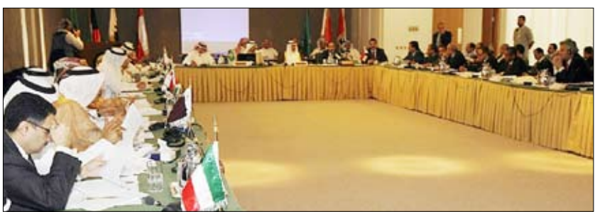
من جلسات أعمال اجتماع فريق العمل المشترك بين اليمن والمانحين

بدأت يوم أمس السبت بمقر الأمانة العامة لمجلس التعاون الخليجي جلسات أعمال اجتماع فريق العمل المكلف بمتابعة تنفيذ المشاريع وتحديد الاحتياجات التنموية للجمهورية اليمنية. ويشارك في الاجتماع ممثلو صناديق التنمية في دول مجلس التعاون، والأمانة العامة لمجلس التعاون، والبنك الإسلامي للتنمية، والصندوق العربي للإنماء الاقتصادي والاجتماعي، وصندوق أوبك للتنمية، والاتحاد الأوروبي، والولايات المتحدة الأمريكية، واليابان، والبنك الدولي، وصندوق النقد الدولي، والأمم المتحدة، ووزارة التنمية الدولية بالمملكة المتحدة. وفي مستهل الاجتماع استعرض نائب رئيس الوزراء للشئون الاقتصادية وزير التخطيط والتعاون الدولي عبد الكريم إسماعيل الأرحي التحديات الاقتصادية والأمنية التي واجهت اليمن خلال السنوات الماضية والتي أسهمت في الحد من فاعلية الجهود الحكومية