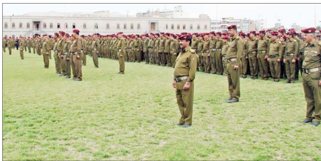
رئيس الجمهورية لدى لقائه قيادة وزارة الدفاع والمدراء في دوائر الوزارة

سبأ / سيا : شدد فخامة الأخ علي عبدالله صالح رئيس الجمهورية القائد الأعلى للقوات المسلحة على أهمية الانضباط والانزمام باللوائح والقوانين والأنظمة بما يكفل حسن الأداء للمهام والواجبات. جاء ذلك خلال لقائه أمس السبت بالإخوة قيادة وزارة الدفاع والمدراء والعاملين في دوائر الوزارة الذين أطلعوه على سير الأعمال في دوائر الوزارة، وقد تحدث فخامة الأخ الرئيس في اللقاء مشيراً إلى أهمية المرحلة وما تتطلبه من مضاعفة الجهود والاضطلاع بالمسؤوليات بهمة وجدارة. وقال : إن العاملين في وزارة الدفاع يجب أن يكونوا قدوة للآخرين في الانضباط والانزمام، وسنطلب نشد على يد كل من يعمل بجد وإخلاص وتفان من أجل بناء الوطن ورفعة أبنائه ومن أجل بناء دولة النظام والقانون ودولة المؤسسات والمجتمع اليمني المتطور .. مضيفاً : "سنعمل على دعم كل من يعمل على أداء واجباته ومسؤولياته بجدارة واقتدار، كما أننا لن نتهاون بحق كل من يخل بواجباته ومسؤولياته بل سنحاسب كل من يقصر أو يتفاسد في أداء عمله ويتهرب عن المسؤولية المنوطة به". ولفت فخامة الأخ الرئيس إلى ما تشهده قواتنا المسلحة من تطور كبير على صعيد بنائها وتحديثها وعلى مختلف الأصعدة البناء الإداري والعسكري المواكب لأحدث ما وصلت إليه طرق البناء العسكري . مؤكداً الأهتمام بمواصلة جهود البناء للمؤسسة العسكرية والأمنية . وقال : "إن هذه المؤسسة الكبرى هي صمام أمان الوطن ورمز لوحدة الوطنية والتي على صخرة صمودها ووعي منتسبيها تحمطت كافة المؤامرات على الوطن".