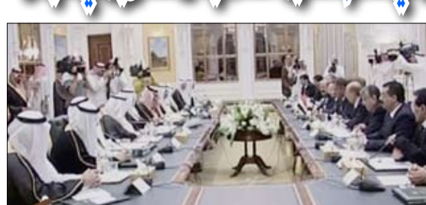
مجلس التنسيق اليمني السعودي

سبأ / سيا : عقدت مساء أمس العاصمة السعودية الرياض اجتماعات الدورة الـ19 لمجلس التنسيق اليمني - السعودي برئاسة رئيس مجلس الوزراء الدكتور علي محمد مجور وأخيه صاحب السمو الملكي الأمير سلطان بن عبد العزيز ولي العهد - نائب رئيس مجلس الوزراء - وزير الدفاع والطيران المقتض العام بالمملكة العربية السعودية . وفي الجلسة الافتتاحية تبودلت الكلمات من قبل رئيسي الجانبين حيث أعرب رئيس مجلس الوزراء الدكتور علي محمد مجور في مستهل كلمته عن الشكر والتقدير للأشقاء في المملكة على ما حظي به وأعضاء الجانب اليمني من فخاوة استقبال وكرم ضيافة عربية أصيلة منذ أن وطلعت أقدامهم أرض المملكة. وقال : "إننا إذ نبدي إرتياحنا لما تحقق ولله الحمد من إنجازات كبيرة خلال مسيرة مجلس التنسيق السعودي اليمني والتي تجاوزت خمسة وثلاثين عاماً على يقين بأن ما يجمع بين بلدينا وشعبينا الشقيقين من روابط العقيدة والجوار وأواصر القربى والمصير المشترك يحتم علينا أن نضاعف الجهود لتحقيق تطورات إيجابية لبناء التكامل المنشود في مختلف المجالات التنموية وبما يعود على مواطني البلدين بالفراخ والأمن والأمان والاستقرار". وتابع صاحب السمو الملكي الأمير سلطان بن عبدالعزيز قائلاً : "نثق في أن الأجهزة المعنية في