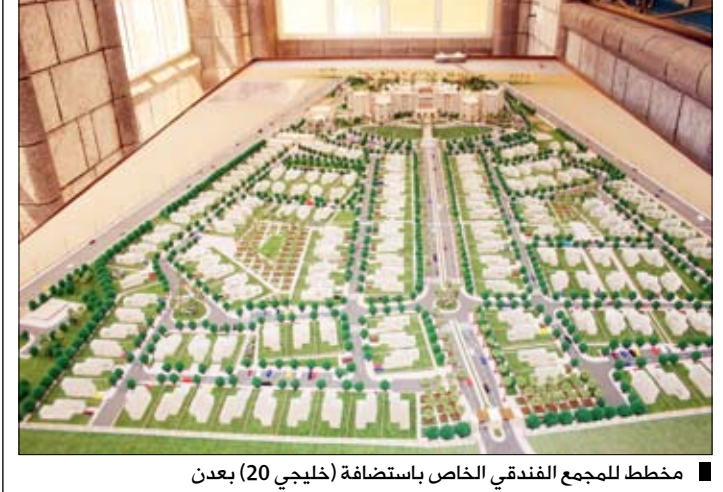
مخطط للمجمع الفندقي الخاص باستضافة (خليجي 20) بعدن