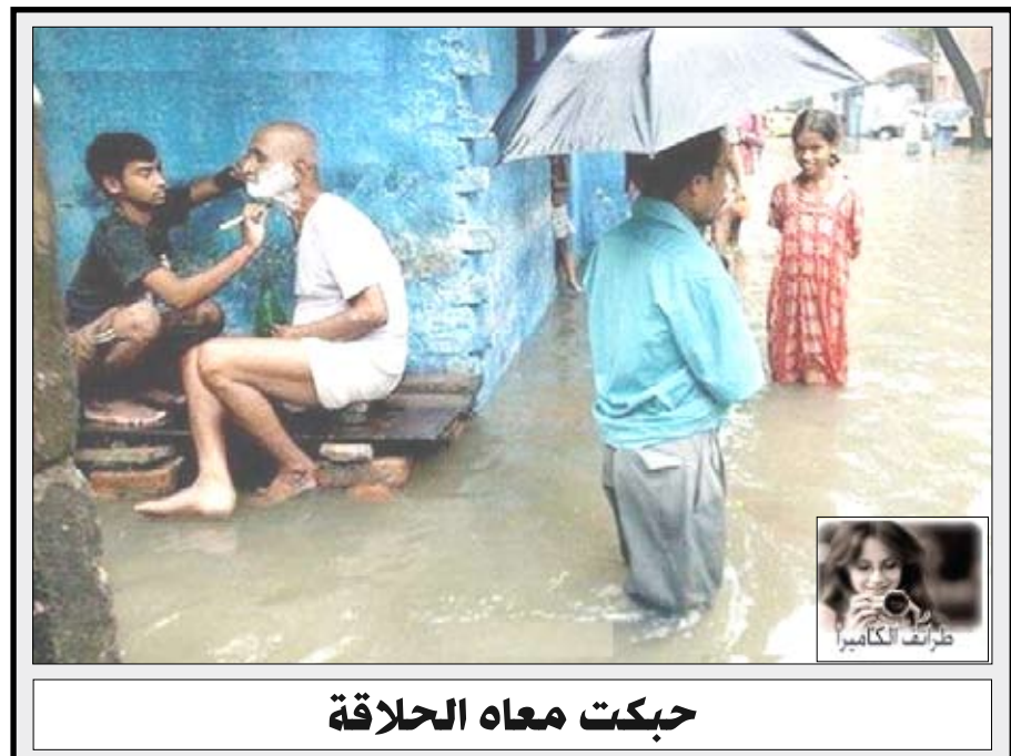
حكمت معاه الحلاقة