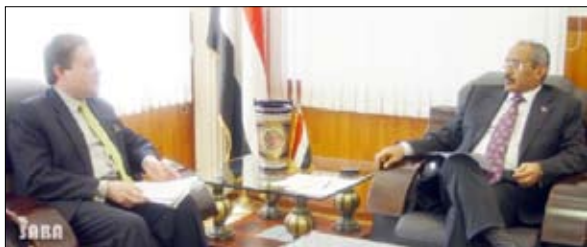
وزير العدل يلتقي السفير الإسباني