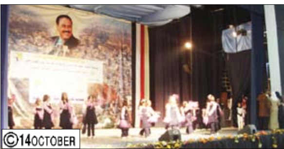
من فعاليات الاحتفال