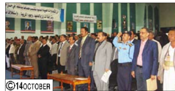
محافظ تعز خلال الاحتفال باليوم الوطني للبيئة