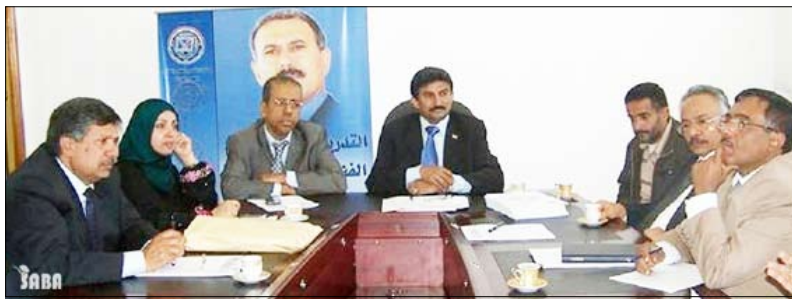
وزير التعليم الفني يترأس اجتماع اللجنة العليا للمناهج