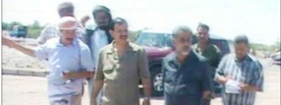
محافظ لحج خلال تفقده مشاريع خليجي 20