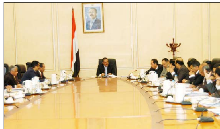
د. مجور لدى ترؤسه اجتماع المجلس الاقتصادي الأعلى

صناعات / سبأ: ناقش المجلس الاقتصادي الأعلى في اجتماعه أمس برئاسة رئيس مجلس الوزراء الدكتور علي محمد مجور مجموعة من المواضيع الاقتصادية المدرجة في جدول أعماله وتحديدًا في مجالات النفط والمعادن والكهرباء والبنوك واتخاذ إزائها القرارات المناسبة. وقد وافق المجلس على مذكرة وزير النفط والمعادن بخصوص طلب شركة (كوييت انرجي) بتمديد إضافي لمرحلة الاستكشاف الثانية في اتفاقية المشاركة في الإنتاج قطاع 35 من منطقة هود محافظة حضرموت لمدة 18 شهراً وذلك بغرض إتاحة المجال أمام الشركة لحفر بئر استكشافية