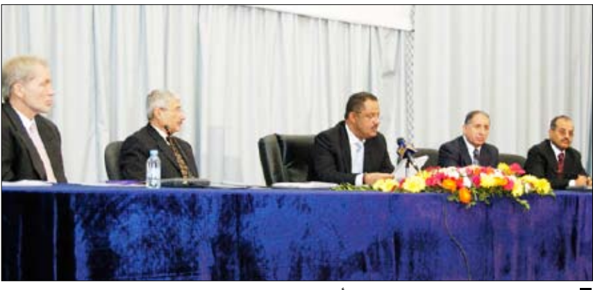
د. مجور لدى افتتاحه الورشة التعريفية أمس

صناعات / سبأ: بدأت بصناعات أمس فعاليات الورشة التعريفية الخاصة بالمراجعة الداخلية للوحدات الإدارية في السلطتين المركزية والمحلية بالقطاعات والاختصاصات ينظمها الجهاز المركزي للرقابة والمحاسبة بالتعاون مع المؤسسة الألمانية للتنمية «جي تي زد». وفي افتتاح الورشة أكد رئيس مجلس الوزراء الدكتور علي محمد مجور أهمية المراجعة الداخلية كأحد الرهانات المهمة لتحقيق أفضل مستويات الأداء وترشيد عمليات اتخاذ القرار المالي والإداري. وأضاف الدكتور مجور «ما نحتاجه اليوم هو التصرف المسؤول تجاه ما يقع تحت مسؤولياتنا من صلاحيات مالية وإدارية بهدف تحقيق أفضل مستويات التوظيف للموارد العامة لارتقاء بكفاءة الجهاز الحكومي وتحسين مستوى الخدمات المقدمة إلى الناس وصولاً إلى الإيفاء بمتطلبات التنمية».