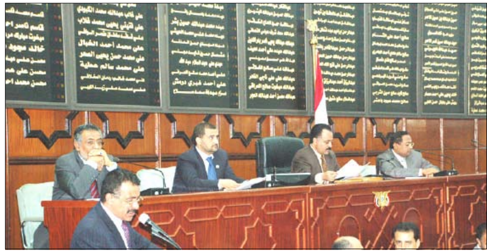
من جلسة مجلس النواب أمس

صناعات / سبأ: استعرض مجلس النواب في جلسته أمس برئاسة رئيس المجلس يحيى علي الراعي تقرير لجنة التجارة والصناعة حول نتائج زيارتها الميدانية لبعض محافظات الجمهورية للإطلاع على أوضاع مصنع باجل ومصنع البرج ومصنع عمران للإسمنت وزيارة الشركة الوطنية للإسمنت بمديرية اليمسيري محافظة لحج. وأشارت اللجنة في تقريرها إلى أن هذه الزيارة إلى تلك المصانع تأتي بعد التطور الملحوظ لبعضها من خلال افتتاح خطوط جديدة للإنتاج مثل خط إنتاج جديد في مصنع عمران وبطاقة إنتاجية تبلغ مليون طن، وكذا البدء بإجراءات بناء خط جديد في مصنع باجل وفقاً للاتفاقيات الموقعة بين بلادنا وحكومة الصين الشعبية بهذا.