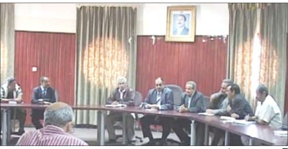
محافظ الضالع يترأس الاجتماع الاستثنائي الموسع للمكتب التنفيذي