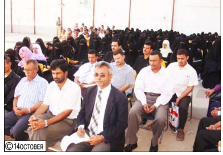
جانب من المدربين والمدارس المشاركين في إحدى الدورات التدريبية

وأوضح الدكتور لملس لوكالة الأنباء التربوية والمنظمة الدكتور عبدالله لملس أنه تم تدريب 55 ألفاً و 349 تربوياً خلال العام المنصرم ، مشيراً إلى أن برامج التدريب المنفذة تضمنت تدريب الفئات المستهدفة في إطار مكون تحسين النوعية وبناء القدرات المؤسسية عبر ثلاث مراحل بالإضافة إلى برامج التنمية المهنية وتعزيز القدرات الفنية.