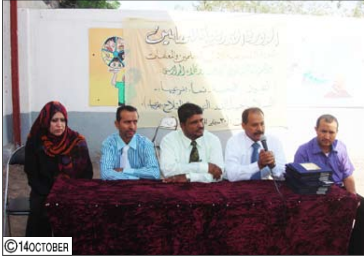
خلال افتتاح الدورة التدريبية