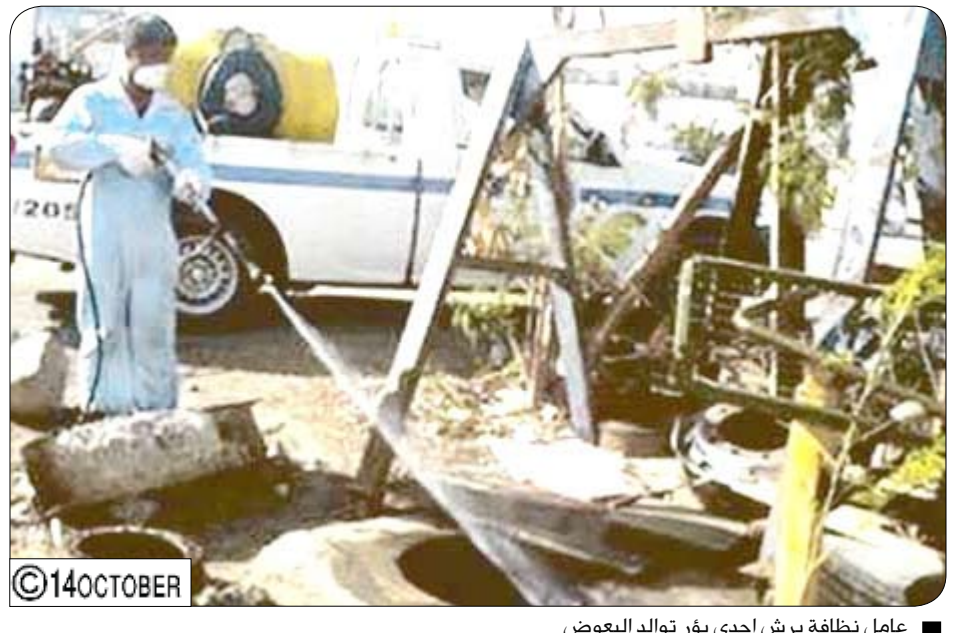
عامل نظافة يرش إحدى بؤر توالد البعوض

يعتبر قسم صحة البيئة في مديرية الشيخ عثمان من الأقسام التي تقع عليها مهمة الحفاظ على صحة الإنسان والبيئة وذلك من خلال ما يقوم به من نشاط صحي في هذا الاتجاه .. رئيس قسم صحة البيئة بالمديرية يتحدث إلى " صفحة البيئة" قائلاً:-