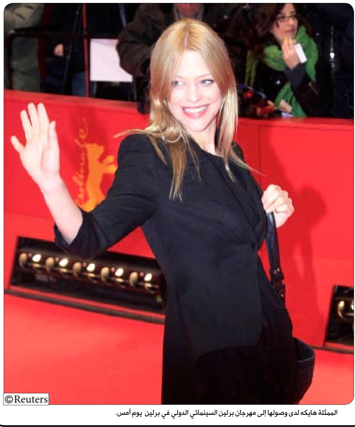
الممثلة هايكه لدى وصولها إلى مهرجان برلين السينمائي الدولي في برلين يوم أمس.

العلم يرفع بيتنا لاعماله والجهل يهدم بيت العز والشرف.