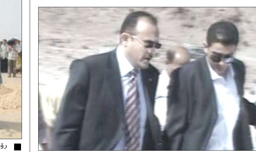
وزير النقل ومحافظ حضرموت يزوران موقع ميناء بروم

كرس اللقاء لمناقشة القضايا المتعلقة بتنشيط ميناء المكلا والارتقاء بمستوى الخدمات التي يقدمها في جوانب الشحن والتفريغ بالإضافة إلى تسهيل معاملات رجال الأعمال والمتابعة الجاهة المختصة لتسريع بإنشاء هذا الميناء التجاري المستقبلي والذي سيخدم الحركة التجارية والاقتصادية في المناطق الشرقية. وأكد وزير النقل أهمية قيام شراكة مع القطاع الخاص لتعزيز جوانب التنمية وتمكينه من القيام بدوره في خدمة التنمية والمجتمع.. مشيراً إلى أن الدولة والحكومة تولي القطاع الخاص اهتماماً متزايداً بوصفه رديفاً أساسياً للتنمية. وأشار الوزير إلى الخطوات التي سيتم تنفيذها خلال الفترة القادمة والهادفة لتنشيط أوضاع ميناء المكلا وتحسين خدماته.. داعياً إلى التعاون مع مؤسسة موانئ البحر العربي اليمنية لتحقيق ذلك بما يمكن الميناء من القيام بمهامه في خدمة النشاط التجاري وتطوير أعمال شحن وتفريغ البضائع. وشدد على ضرورة وجود مرونة وتوفير تسهيلات في خدمات الجمارك والملاحة بالميناء.