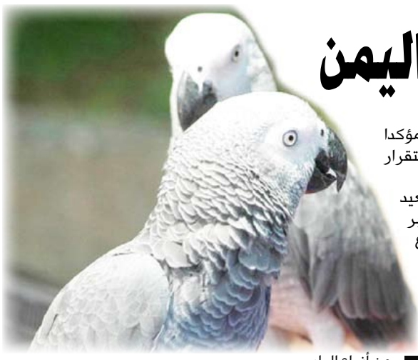
من أنواع الطيور