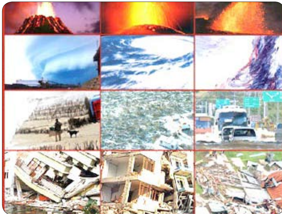
مشاهد من بعض الكوارث

كما يتوقع الدليل أن تصبح حكومات البلدان النامية، لاسيما في آسيا، أكثر انخراطاً في البرامج القومية للحماية الاجتماعية والسعي للحصول على الدعم المتفتح. وقال ووكر أن المنظمات الإنسانية المحلية تستطيع في هذا السياق "من النمو في حين تستثمر المنظمات الدولية لتصبح أكثر استعداداً لاتباع قيادة فروعها المحلية".