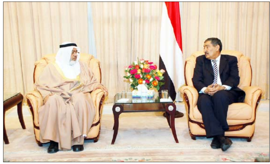
رئيس مجلس الشورى يستقبل رئيس مجلس النواب البحريني

المصالح المشتركة للبلدين والشعبين الشقيقين. وأشاد المسئول البحريني الكبير بالتطورات الإيجابية التي شهدتها الساحة البحرينية عن اعترافه بزيارة اليمن، التي قال إنها تأتي في إطار الزيارات المتبادلة بين المسئولين في البلدين على مختلف المستويات، الهادفة إلى مزيد من التنسيق والتعاون وتبادل الخبرات والتشاور في يهم