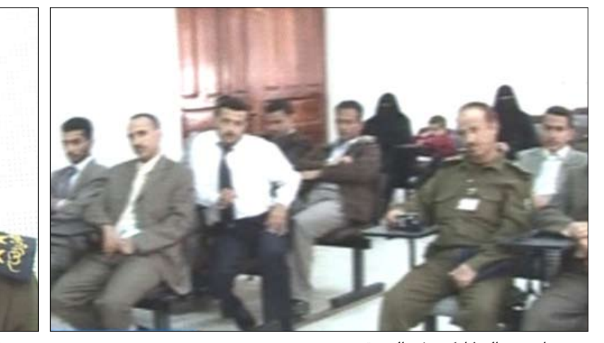
جانب من المشاركين في الدورة

سبأ / سيا: اختتمت بمبنى الأدلة الجنائية بأمانة العاصمة أمس الدورة الخاصة بعمل مسرح الجريمة في مكافحة الإرهاب. هدفت الدورة على مدى أسبوعين رفد 22 متدرباً ومتدربة بينهم ستة من النيابة العامة بمهارات وفنون التعامل مع الجرائم الإرهابية والتعامل مع مسرح الجريمة في اكتشاف الجناة. وفي الاختتام أشار وكيل وزارة الداخلية لقطاع الأمن العام العميد فضل يحيى القوسي إلى أهمية هذه الدورة في تطوير مهارات الكوادر الأمنية ورفع مستواهم الأمني. وأشار العميد القوسي إلى أن هذه الدورات تأتي في إطار التعاون الأمني مع الولايات المتحدة الأمريكية والهادفة لرفع مستوى الأداء الأمني لدى منتسبي الأجهزة الأمنية.. مشيداً بالدعم الأمريكي في إقامة