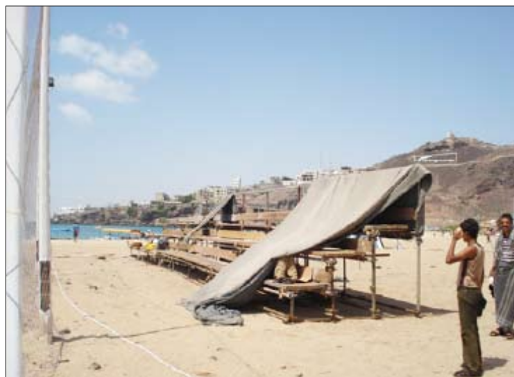
ملعب كرة القدم الشاطئية الجديد

فيما تستضيف اليمن بطولة الخليج والجزيرة العربية