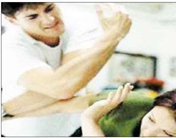
العنف على المرأة

عدن / 14 أكتوبر: نظمت جمعية الإصلاح الاجتماعي الخيرية بمحافظة عدن بالتنسيق مع منظمة اليونيسيف الأسبوع الماضي بمسرح الولفين السياحي بخورمكسر برنامجاً ثقافياً للفتيات وعروضاً مسرحية عن مخاطر العنف على المرأة وختان الإناث