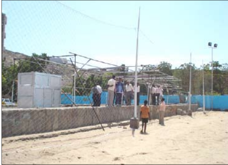
الملاعب الجديد في الساحل الذهبي