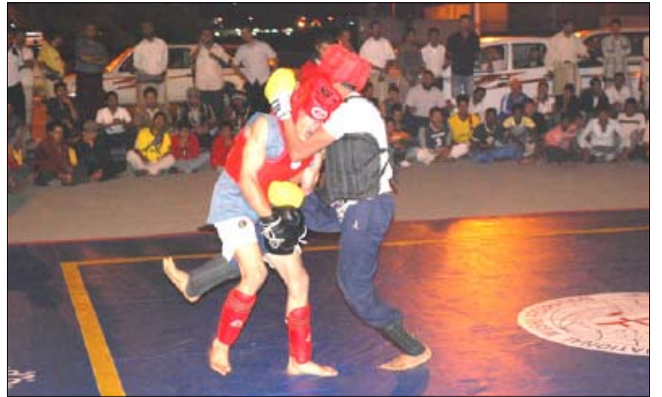
لقطة للكونغ فو