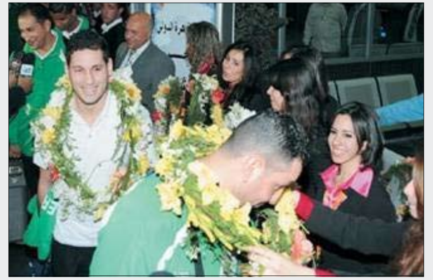
منتخب الجزائر حظي باستقبال حافل في القاهرة

وعلى الرغم من الخطأ الفاضح وما رافقه من احتجاجات شديدة الالهجة ومطالبه الاتحاد ايرلندي بإعادة المباراة أو توجيه دعوة إلى المنتخب للمشاركة في مونديال جنوب أفريقيا تغييراً عن الخطأ، فإن هانسون سيكون ضمن اصحاب اللباس الأسود عندما تعطل اشارة انطلاق اول كأس عالمية في القارة السمراء.