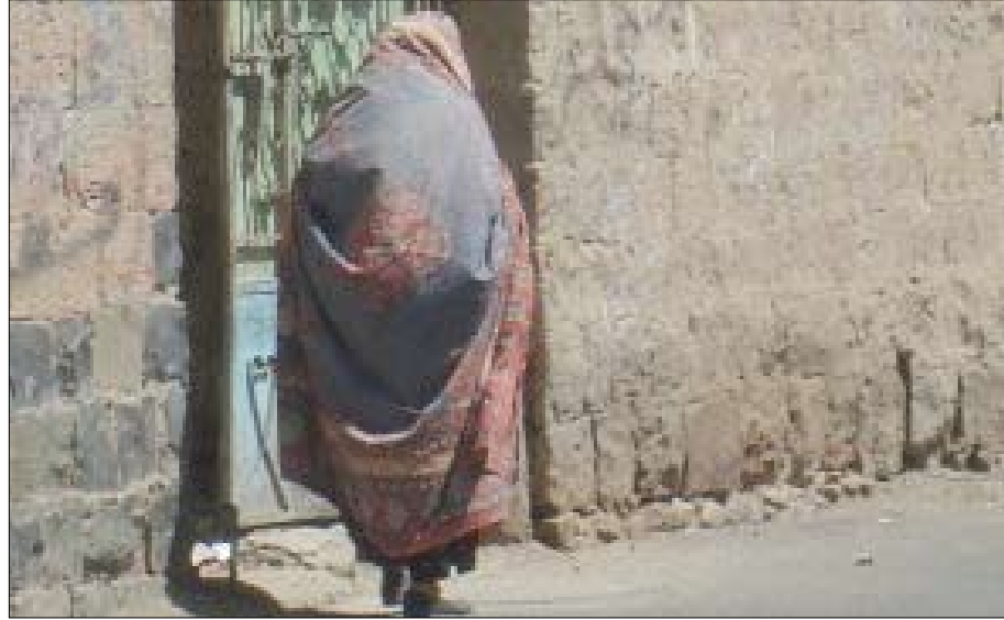
امرأة يمنية مسنة

المرحلة العمرية للمسنين ومشكلاتهم من التحديات الرئيسية .. والدراسة ستخرج برؤية عملية لمساعدتهم على حل مشاكلهم