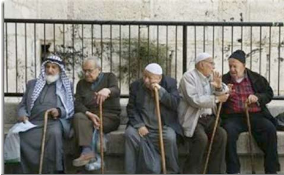
مجموعة من المسنين العرب