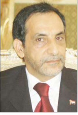
د. يحيى بن يحيى المتوكل