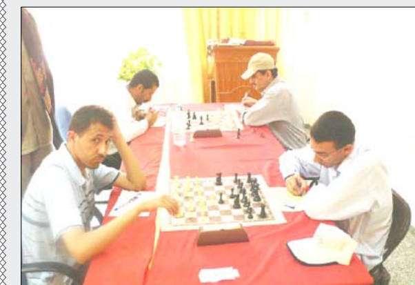
لقطة لمباراة شطرنج من الارشيف