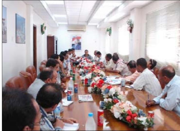
القرعة والاجتماع الفني للبطولة الرابعة لكرة القدم الشاطئية