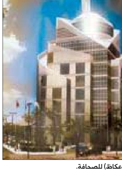
مبنى مؤسسة (عكاظ) للصحافة.