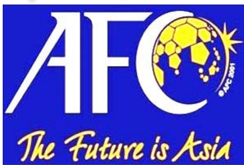
شعار الاتحاد الآسيوي لكرة القدم

وكان السويسري سيب بلاتر رئيس الـ «فيفا» الحالي قد أبدى مؤخرًا رغبته في الترشح لفترة جديدة بعد نهاية الفترة الحالية عام 2011. وسيعلم الاتحاد الدولي في ديسمبر المقبل اسم العرضين الفائزين بحق تنظيم نهائيات كأس العالم في عامي 2018 و2022.