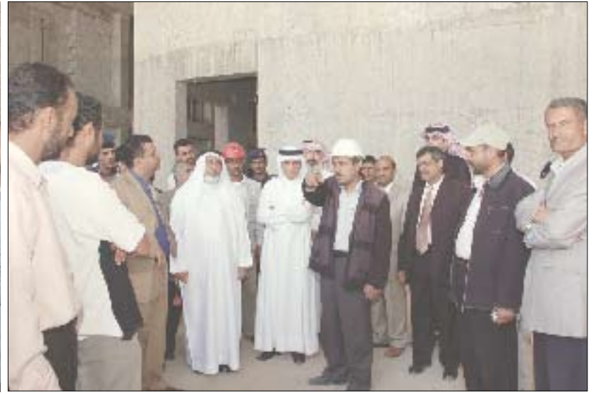
رئيس مجلس النواب بمملكة البحرين يزور مشروع مجلس النواب الجديد ومسجد الصالح

خليفة بن أحمد الظهراني والوفد البرلماني المرافق له ومعهم رئيس مجلس النواب يحيى علي الراعي بزيارة استطلاعية إلى مبنى مجمع الدفاع. واستمعوا أثناء الزيارة من القائمين على المجمع إلى شرح حول الفن المعماري والهندسي الذي بني به المجمع بتكويناته المختلفة منذ عهود ماضية والتجديدات التي أدخلت عليه، مع الحفاظ على الطراز المعماري والفن الهندسي القديم والمعاصر. وعبر رئيس مجلس النواب بمملكة البحرين ومرافقوه عن إعجابهم بما شاهدوه من فنون هندسية معمارية تعبر عن أصالة وحضارة وتراث الشعب اليمني. رافقه في هذه الزيارات رئيس بعثة الشرف فييل صادق باشا وسفير اليمن لدى البحرين د.علي منصور بن سقاع وسفير مملكة البحرين غير المقيم في اليمن محمد صالح الشيخ علي.