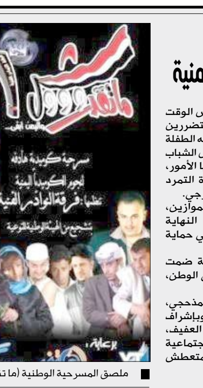
ملصق المسرحية الوطنية (ما تقدروش).