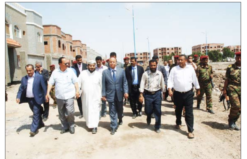
نائب الرئيس يتفقد عدداً من المشاريع