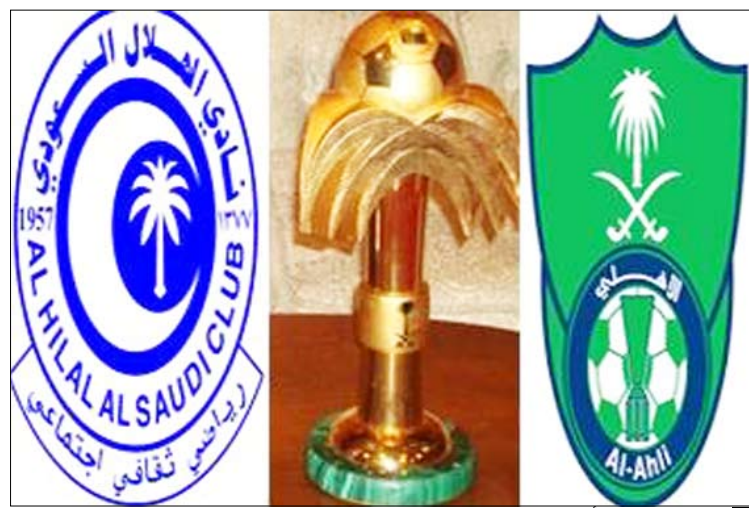
مباراة نهائي كأس ولي العهد السعودي

الرياض / 14 أكتوبر / ستايبات : وكان ثاني نهائي يجمع الهلال بالأهلي بعد نهائي كأس ولي العهد الذي كسبه الأهلي على كأس الملك في عام 1977، وفيه كسر الأهلي فوزه على الهلال 3-1. ولم يذق الأهلويون طعم الفوز على الأهلي في النهائي إلا عام 1984 عندما التقيا على كأس الملك مرة أخرى وفاز الهلال يومها 4-0، بعدها غاب الفريقان عن اللعب ضد بعضهما في النهائيات 12 عاماً، حتى عام 1996 عندما التقيا على نهائي كأس دوري خادم الحرمين الشريفين ونجح الهلال في الفوز 2-1 ليعادل عدد مرات فوز الأهلي عليه في المباريات النهائية. وسرعان ما تقو ق الهلال للمرة الأولى بفوزه على الأهلي في نهائي كأس المؤسس الملك عبدالعزيز الذي يلعب عام 2000 ويومها فاز الهلال 2-1.