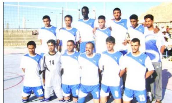
□ فريق الشرطة

نقاط بينما مني الهلال من السويدي بالخسارة الرابعة وبقي سابع الترتيب برصيد 10 نقاط. ..إتحاد الكرة الطائرة أعلن عن تأجيل بعض المباريات في جدول الذهاب وخاصة الأسبوعين السابع والثامن بسبب مشاركة نادي شباب القطن في البطولة العربية واستعاثته ببعض لاعبي الأندية الأخرى .