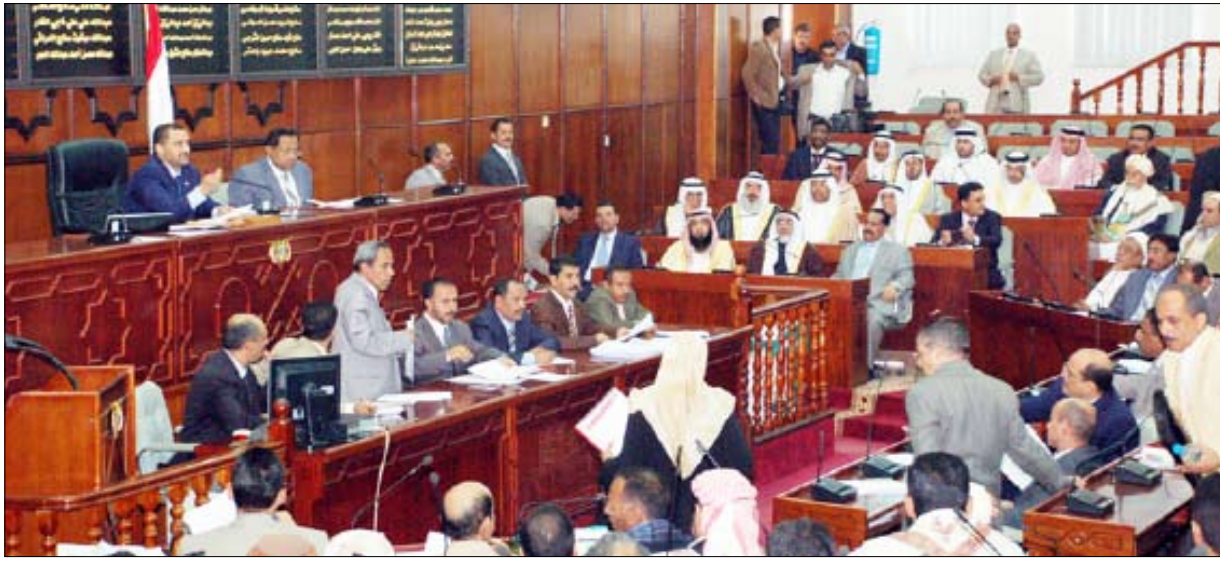
من جلسات مجلس النواب أمس

استمع مجلس النواب في جلسته المنعقدة أمس برئاسة نائب رئيس مجلس النواب حمير بن عبدالله بن حسين الأحمر إلى إيضاحات وزراء النفط والمعادن أمير سالم العيدروس، والأنشغال العامة والطرق عمر عبدالله الكرشمي والكهرباء والطاقة عوض سعد السقطري، والشؤون الاجتماعية والعمل أمة الرزاق علي دُمد بشأن عدد من الاستفسارات الاستيضاحية المقدمة من بعض أعضاء المجلس في مسائل تقع تحت نطاق اختصاصاتهم.