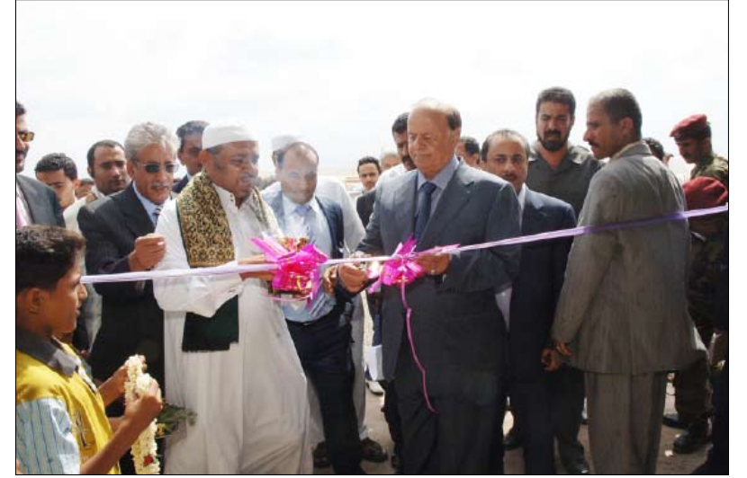
نائب الرئيس يفتتح عدداً من المشاريع