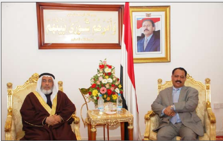
رئيس مجلس النواب يستقبل نظيره البحريني