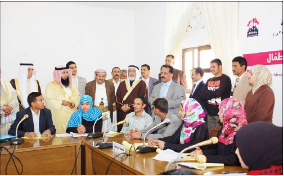
رئيس مجلس النواب ونظيره البحريني يحضران اجتماع برلمان الأطفال

وزارة التربية والتعليم لاختيار الموقع الجغرافي المناسب لبناء المدارس ، فضلاً عن دور وزارة التربية والتعليم في توفير المنهج الخاص بالمكفوفين والصم والبكم بالتعاون مع جمعية الأمان للتعليم . وأوصى برلمان الأطفال ، وزارة التربية والتعليم بالعمل على إدراج حصص أنشطة وترفيه في المدارس خاصة في مرحلة التعليم الأساسي ، وتعاونها مع الصندوق الاجتماعي للتنمية لتنفيذ دراسة ميدانية عن الأطفال خارج نطاق التعليم بالتنسيق مع الجهات المعنية ، وأهمية دور قطاع الفتاة في وزارة التربية والتعليم بالفتاة الريفية لإعطائها حقها في التعليم .