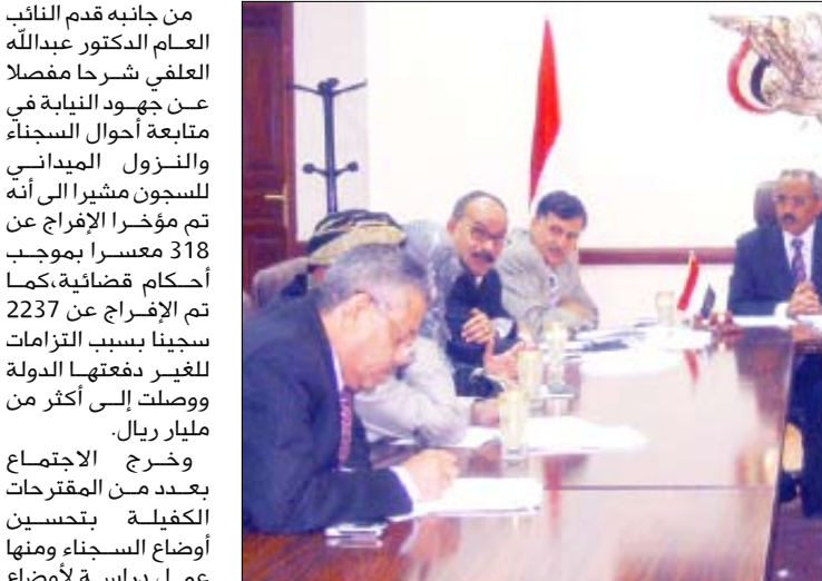
وزير العدل يرأس اجتماعاً موسعاً لمناقشة تقرير لجنة الشورى حول أوضاع السجناء والسجون

من جانبه قدم النائب العام الدكتور عبدالله العلفي شرحاً مفصلاً عن جهود النيابة في متابعة أحوال السجناء للنزول المبدياً إلى أن تم مؤخراً الإفراج عن 318 معسراً بموجب أحكام قضائية . كما تم الإفراج عن 2237 سجينا بسبب التزامات الغير دفعتها الدولة ووصلت إلى أكثر من مليار ريال .