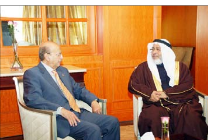
الشيخ خليفة يستقبل د. أيوبكر القربي

وجرى خلال اللقاء بحث العلاقات الثنائية بين البلدين الشقيقين وسبل تعزيزها وتطويرها بالإضافة إلى آخر المستجدات على الساحة الإقليمية والدولية . حضر اللقاء سفير البحرين غير المقيم لدى اليمن محمد صالح الشيخ علي .