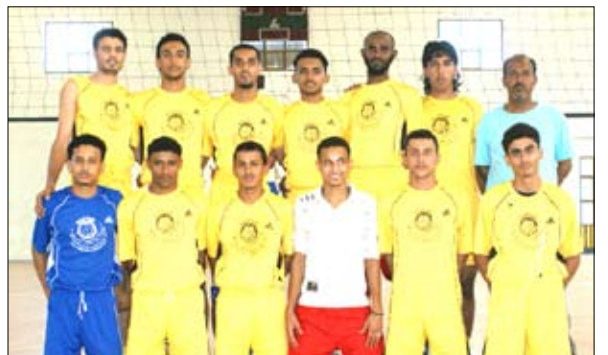
□ فريق عرفان