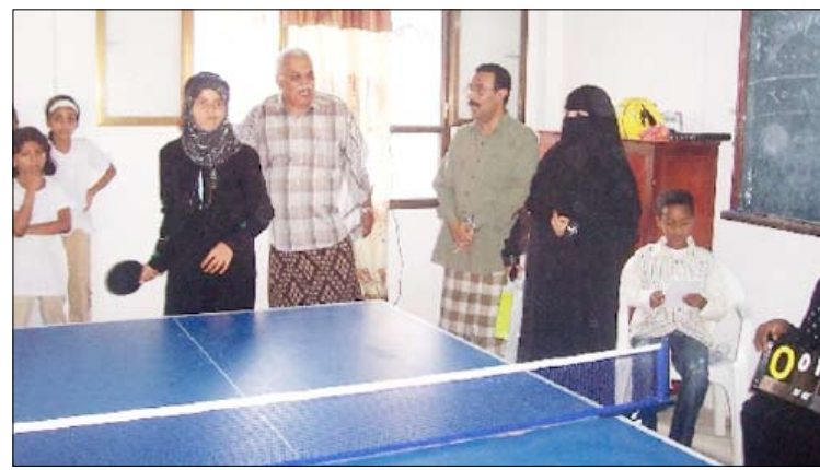
□ لحظة للتنس من الارشيف

من مدارس التعليم الأساسي قسمت إلى مجموعتين ضمت المجموعة الأولى مدارس الشهيذة سمية و السيدة عائشة وخالد بن الوليد و22 مايو وبيديري فيما ضمت المجموعة الثانية مدارس الزهره ومجمع السعيد وأكتوبر ومجمع فوه والشافعي وعائشة بالحدائق وفي لعبة تنس الطاولة تشارك ثمان مدارس قسمت إلى مجموعتين تلعب بنظام الدوري من دور واحد ضمت المجموعة الأولى مدارس مجمع فوه والشهيذة سمية وخالد بن الوليد وأكتوبر وضمت المجموعة الثانية مدارس السيدة عائشة ومجمع السعيد و22 مايو والزهره .. أما الثانويات فتشارك في جميع الألعاب ( الشطرنج والطاولة والكرة الطائرة) تتنافس بنظام الدوري من دور واحد وهي ثلاث ثانويات : الميناء ومجمع فوه وبلقيس والمعهد التقني التجاري بفوه . هذا وتم إقرار احتضان مدرسة الشهيذة سمية بالمكلا لمنافسات الكرة الطائرة في المرحلتين أساسية وثانوية بينما تقام منافسات تنس الطاولة والشطرنج في مجمع فوه للمرحلتين .