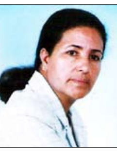
المغربية / مالكة العسال