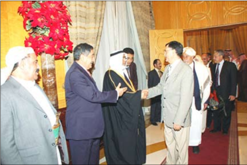
رئيس مجلس النواب يقيم مأدبة غداء على شرف نظيره البحريني

عبدالعنق ونائب رئيس مجلس النواب حمير بن عبدالله بن حسين الأحمر وعدد من رؤساء الكتل البرلمانية ورئيس بعثة الشرف المرافقة لرئيس مجلس النواب البحريني نبيل صادق باشا وعدد من أعضاء مجلس النواب، وسفير بلادنا لدى البحرين والسفير البحريني في المملكة العربية السعودية غير المقيم في اليمن، وأمين عام مجلس النواب وعدد من السفراء المعتمدين بصنعاء.