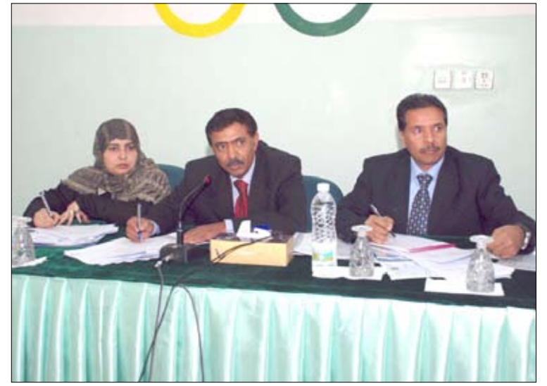
□ اجتماع اللجنة الأولمبية اليمنية