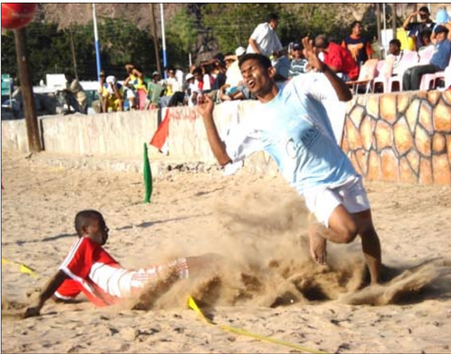
من منافسات كرة القدم الشاطئية - ارشيف