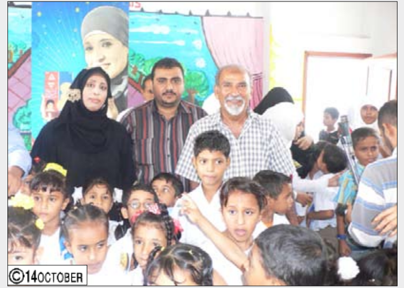
فرقة آزال ترقص وتغني للوحدة