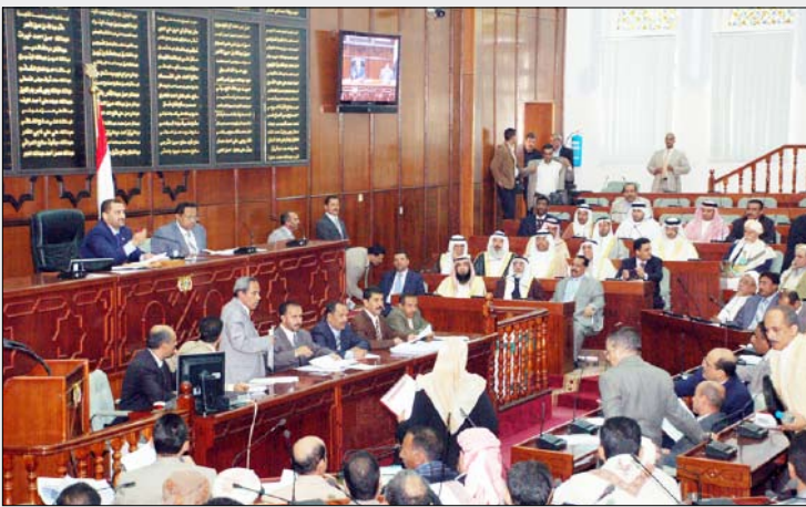
الراعي يشرح عمل المجلس ولجانه الدائمة والأنشطة التي تقوم

وقد عبر الشيخ الظهري والوفد المرافق له عن إعجابهم بالتجربة البرلمانية في اليمن بمضمونها ومظاهرها المتنوعة والدور الذي تقوم به في سبيل إسهام المجتمع وتنمية قدراته الاقتصادية والاجتماعية والثقافية.