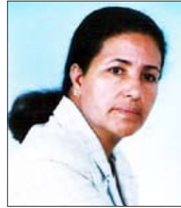
المغربية / مالكة العسال