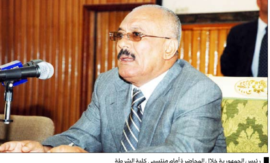
رئيس الجمهورية خلال المحاضرة أمام منتسبي كلية الشرطة

مساءً / سيا: قال فخامة الأخ الرئيس علي عبدالله صالح رئيس الجمهورية: إن الدعوة إلى الانفصال ورفع الشعارات المعادية للوحدة الوطنية عظمة خيانة وطنية كبرى ومن يطلق مثل هذه الدعوات السخيفة هم أولئك الذين أضروا بأبناء شعبنا في جنوب الوطن في عهد التشطير طوال خمسة وعشرين عاماً ومارسوا بحقهم شتى صنوف الظلم والفقر والتشريد والسجن والتصفيات الجسدية. جاء ذلك خلال زيارة فخامة الأخ الرئيس علي عبدالله صالح رئيس الجمهورية القائد الأعلى للقوات المسلحة أمس إلى كلية الشرطة وإلقائه محاضرة مهمة أمام منتسبيها. وأضاف: لقد جاءت الوحدة اليمنية في 22 مايو 1990م، إنقاذاً للوطن بشكل عام وشماله وجنوبه من مآسي التشطير وإعادة تحقيق الوحدة المباركة انتهت دورات الصراعات الدموية والتصفيات سواء في إطار الشطر الواحد أو بين الشطرين فتعمق الحب والوثام بين أبناء الوطن وتعزز اختلاط المواطنين وتعارفهم وتفرغوا للتنمية. ومضى قائلاً: أولئك العملاء قوى مفسدة تريد أن تسقط مرة أخرى على جنوب الوطن الحبيب ونحن نقول لها لا وألفاً، ونعم لوحدة 22 من مايو المجيد نعم ل22 مايو، يوم ارتفع علم الجمهورية اليمنية خفاقاً في القصر الجمهوري في التواهي بعدن وسيظل مرفوعاً إلى الأبد. وسيكون دعاة الانفصال هم النادمون مثلما ندم أولئك الذين رفعوا الشعارات المعادية للثورة اليمنية وحاربوا حتى وصلوا إلى أبواب صنعاء في السبعينات وخسروا الرهان ونحن أبناء اليمن كسبنا الرهان وقدمنا قوافل من الشهداء وحافظنا على الثورة والجمهورية.