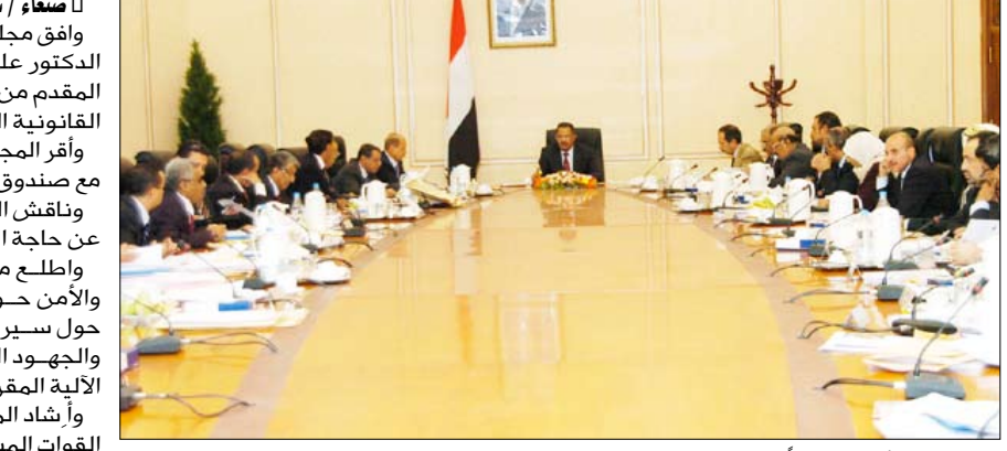
مجور يتراأس اجتماعاً لمجلس الوزراء

مساءً / سيا: وافق مجلس الوزراء في اجتماعه الأسبوعي أمس برئاسة رئيس المجلس الدكتور علي محمد مجور على مشروع قرار جمهوري بإنشاء جامعة شبوة المقدم من وزير التعليم العالي والبحث العلمي ووجه باستكمال الإجراءات القانونية اللازمة لإصداره. وأقر المجلس رفع الحد الأدنى للأجور التعاقدية لعمال النظافة المتعاقدين مع صندوق النظافة والتحسين إلى عشرين ألف ريال كصافي استحقاق. وناقش المجلس تقرير اللجنة المشكلة والمتعلق ببيع الأراضي الزائدة عن حاجة المؤسسة العامة لصناعة الغزل والنسيج لتسديد مديونيتها. واطلع مجلس الوزراء على تقرير نائب رئيس الوزراء لشؤون الدفاع والأمن حول الأوضاع الأمنية في الجمهورية الذي اشتمل على إيضاح حول سير أعمال التنفيذ للشرط الستة والألية التنفيذية الخاصة بها والجهود المبذولة من قبل اللجان المكلفة بالإشراف على تنفيذها وفق الآلية المقررة لذلك. وأشار المجلس بروح المسؤولية العالية واليقظة التي يتحلى بها أبناء القوات المسلحة والأمن مؤكداً بأنهم حماة السلام كما كانوا وسيظلون الحصن المنيع للأمن والاستقرار.