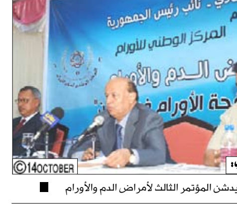
نائب الرئيس يدشن المؤتمر الثالث لأمراض الدم والأورام

مساءً / اخبار هاشم: أكد الأخ / عبد ربه منصور هادي نائب رئيس الجمهورية أن الحكومة اليمنية تبذل قصارى جهدها لتقليل الصعوبات أمام مرضى السرطان من خلال انتشار عدد من المراكز العلاجية المتخصصة لعلاج هذا المرض في عدد من المحافظات لتخفيف عنه الانتقال عنهم خاصة بعد ازدياد عددهم الذي وصل إلى (20) ألف مريض مشيراً إلى أن مرض السرطان لا يمثل مشكلة للدول الفقيرة فقط وإنما كذلك للدول الغنية. وأوضح نائب رئيس الجمهورية خلال تدشينه أعمال المؤتمر الثالث لأمراض الدم والأورام الذي بدأ أعماله صباح أمس بعدن والذي نظمته جامعة عدن والمركز الوطني للأورام بصنعاء ضمن فعاليات الذكرى الأربعين لتأسيس جامعة عدن أن الحكومة قدتمت إلى مجلس النواب منذ خمس سنوات مشروع قرار بتعلق بقدم (10) ريالات عن كل عيلة سحاجر باعتبار أن التدخين أحد مسببات السرطان الأمر الذي من شأنه توفير ستة مليارات ريال سنوياً.