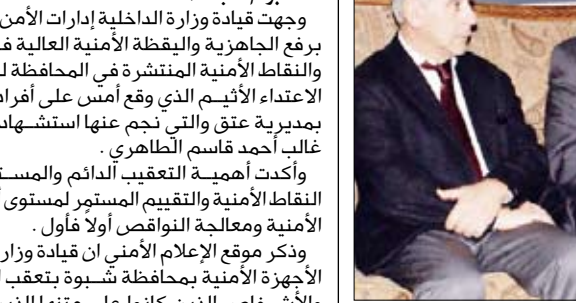
الأرجبي لدى لقائه رئيس قطاع التعدين في البنك الدولي باول دي سي أمس

الدولي باول دي سي. وجرى خلال اللقاء بحث أوجه التعاون القائم بين اليمن والبنك الدولي وسبل تعزيزه وتطويره وبما يخدم الأهداف المشتركة بالإضافة إلى القضايا المتصلة والمتعلقة بالتعاون في هذا المجال. وناقش الجانبان القضايا المتصلة