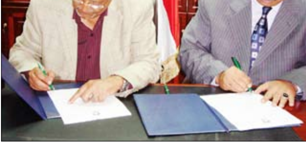
دياسين يوقعان عقد استئجار المبنى السابق للجنة المركزية

وقعت اللجنة المركزية للاستئجار المبنى السابق للجنة المركزية بجامعة عدن توقع عقد استئجار المبنى السابق للجنة المركزية بجامعة عدن بديوان رئاسة الجامعة على عقد استئجار مبنى ديوان رئاسة الجامعة من الحزب الاشتراكي اليمني ممثلاً بالدكتور ياسين وسعيد نعمان الأمين العام للحزب. وقد أفاد الدكتور/عبدالعزیز صالح بن حبتور رئيس جامعة عدن بأنه بناء على توجيهات فخامة الرئيس/علي عبدالله صالح فإن الجامعة نفذت ذلك بتسليم المبنى للحزب الاشتراكي لتعزيز العمل الوطني الكبير... مشيراً إلى أن أبناء الوطن يثمنون عاليا دور الحزب الاشتراكي اليمني النضالي، وفي الإسهام بتحقيق الوحدة اليمنية. من جهته عبر الدكتور/ ياسين سعيد نعمان الأمين العام للحزب الاشتراكي اليمني عن شكره وتقديره لتوجيهات فخامة الأخ / الرئيس بتسليم المبنى للحزب الاشتراكي، موضحاً أن المبنى كان في أياد أئمة وأضحى صرحاً من صروح العلم الوطنية وسيستمر بعد إبرام عقد تأجيره للجامعة، بأداء رسالته العلمية.