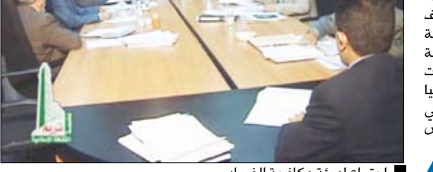
اجتماع هيئة مكافحة الفساد

أقرت الهيئة الوطنية العليا لمكافحة الفساد من إحالة خمسة من مسئولى المؤسسة المحلية للمياه والصرف الصحي في أمانة العاصمة إلى النيابة العامة، واستعرضت الهيئة الوطنية العليا لمكافحة الفساد في اجتماعها الدوري أمس الاثنين برئاسة