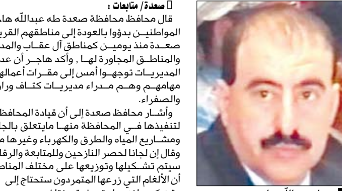
طله عبدالله هاجر

قال محافظ محافظة صنعاء طه عبدالله هاجر، إن بعض المواطنين بدؤوا بالعودة إلى مناطقهم القريبة من مدينة صنعاء منذ يومين بمناطق ال عقاب والمدينة القديمة والمناطق المجاورة لها، وأكد هاجر أن عددا من مدراء المديريات توجهوا أمس إلى مقرات أعمالهم لاستئناف مهامهم وهم مدراء مديريات كثاف ورازخ والحشوة والصفراء. وأشار محافظ صنعاء إلى أن قيادة المحافظة أعدت خطة لتنفيذها في المحافظة منها مايتعلق بالجانب التنموي ومشروعات المياه والطرق والكهرباء وغيرها من المشاريع، وقال إن لجنا لحصر النازحين والمتابعة والرقابة والتفتيش سيتم تشكيلها وتوزيعها على مختلف المناطق، لافتا إلى أن الأنغام التي زرعتها المتوردون ستحتاج إلى وقت كبير لنزعها وتصفيية مختلف