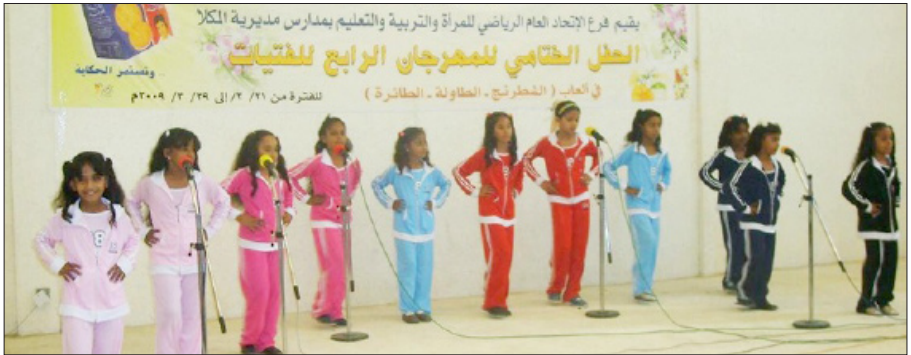
من المهرجان الرياضي النسوي السابق