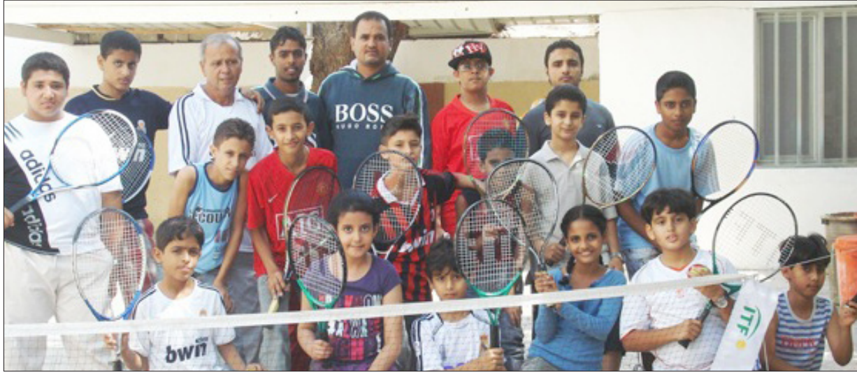
لاعبو مدرسة سبأ الأهلية