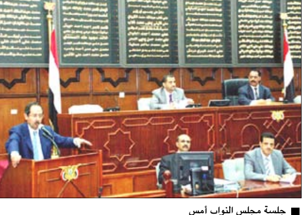
جلسة مجلس النواب أمس

صنعاء / سبأ: استمع مجلس النواب في جلسته المنعقدة صباح يوم أمس الأحد برئاسة رئيس المجلس يحيى علي الراعي إلى ردود إيجابية على أسئلة المجلس من نائب رئيس الوزراء للشؤون الاقتصادية وزير التخطيط والتعاون الدولي عبدالكريم الازهي ومن وزير الاتصالات وتقنية المعلومات المهندس كمال حسين الجبري. وأوضح الازهي في معرض ردوده أن الخطة الخمسية الثالثة للتنمية والتخفيف من الفقر (2006 - 2010) تمثل نقلة نوعية في أداء الحكومة بدءاً بإعداد وإنجاز الخطة الخمسية، والبرنامج الاستثماري الذي عكس أهداف ومؤشرات الخطة. وقد عبر أعضاء المجلس عن تقديرهم للنجاحات التي حققتها الحكومة في مجالات التنمية.