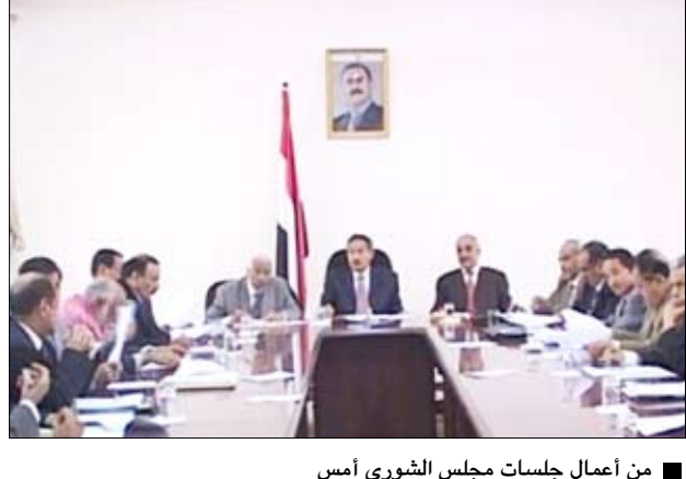
من أعمال جلسات مجلس الشورى أمس

صنعاء / سبأ: عبر مجلس الشورى عن ارتياحه البالغ لقرار وقف العمليات العسكرية في المنطقة الشمالية الغربية، وأثنى على التوجهات السديدة والحكيمة لفخامة الأخ الرئيس علي عبدالله صالح رئيس الجمهورية، في التعامل مع فترة التمرد، وهي التوجهات التي قال إنها عكست إرادة الدولة وحرصها الشديد على حفظ الأمن العام وفرض سيادة النظام والقانون. وأعتبر مجلس الشورى في بيان صادر عن اللجنة الرئيسية للمجلس عقب اجتماع عقده يوم أمس الأحد برئاسة رئيس مجلس الشورى عبد العزيز عبدالغني، أن قرار وقف العمليات