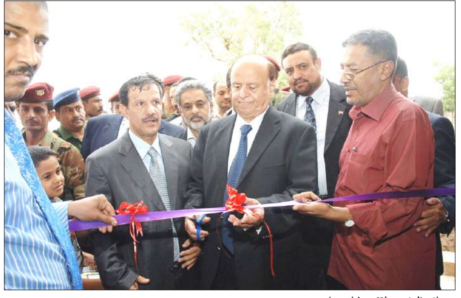
نائب الرئيس يفتتح مشاريع بلحج

عدن / سبأ: قام يوم أمس الأحد الأخ عبد ربه منصور هادي نائب رئيس الجمهورية بزيارة محافظة لحج حيث دشّن ووضع الحجر الأساس لعدد من المشاريع الخدمية والصناعية والتربوية بقيمة استثمارية تزيد على عشرة مليارات ريال. وفور وصول نائب الرئيس قام بإزاحة الستار عن اللوحة التذكارية إيداناً بتدشين العمل بمشاريع المياه والصرف الصحي بمدينة الوطلة والمكون من إنشاء مختبرات وورش مع التجهيزات وحفر عشرة آبار وتوريد وتركيب مضخات الأبار مع بيوت الأبار، وكذلك مشروع شبكة الوطلة تين - لحج ومشروع إنشاء الشبكة الفرعية للقرى الشرقية الحوط - لحج ووضع وبعه عدد من السوراء ومحافظ لحج الحجر الأساس لمشاريع مياه أخرى. كما زار الأخ عبد ربه منصور هادي نائب رئيس الجمهورية بصيف التوأمي الخاص بخفر السواحل وقام بجولة بحرية على أحد الزوارق متفقداً جاهزية خفر السواحل في هذا الموقع. (التفاصيل ص 3)