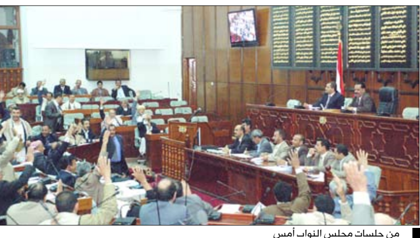
من جلسات مجلس النواب أمس

استمع مجلس النواب في جلسته أمس برئاسة رئيس المجلس يحيى علي الراعي إلى التقرير التكميلي للجنة البرلمانية الخاصة المكلفة بتقصي الحقائق حول الأوضاع الأمنية بمحافظة لحج وأبين وتداعياتها والانتقالات الأمنية بمدينة الخوطة بمحافظة لحج، وأرجأ مناقشته إلى جلسة لاحقة. واستعرض المجلس تقرير لجنة التعليم العالي والشباب والرياضة حول النزول الميداني إلى محافظة عدن للوقوف على أوضاع جامعة عدن وكذا الإطلاع على مستوى تنفيذ التوصيات السابقة التي التزمت بها الحكومة بشأن ذلك في ضوء التقارير السابقة. وأعدت اللجنة إلى الأذهان أهمية التوصيات السابقة للمجلس الذي تناول فيها التأكيد على منع الجامعات الحكومية الاستقلال المالي والإداري وفقاً لما ورد في قانون الجامعات وأن يتحمل الجهاز المركزي للرقابة والمحاسبة ولجنة التعليم العالي والشباب والرياضة بمجلس النواب الرقابة المستمرة على موازنة الجامعات إيراداً ومصرفاً... مشيرة إلى أهمية تحديد ميزانية خاصة مستقلة ضمن ميزانية الجامعة تمكن نيابة الدراسات العليا من عقد