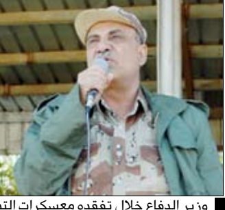
وزير الدفاع خلال تفقده معسكرات التدريب والتأهيل والوحدات العسكرية في محور صعدة أمس

بأعلى درجات اليقظة والانضباط العالي، والحرص على الالتزام بالمهام العسكرية والأمنية اليومية، وبما يكفل أداء متناسقاً ومتكاملاً لطبيعة المهام المسندة إليهم مشيداً بالقدرة القتالية الكبيرة، والروح المعنوية العالية والاستعداد لسدى المقاتلين لانجاز وتنفيذ أية مهام دفاعية وأمنية حماية للمواطنين، وحفاظاً على السلام والوثام الاجتماعي في مديريات صعدة وسفيان.. منوهاً بالمواقف البطولية لمنتسبي القوات المسلحة والأمن الذين ضربوا أروع الأمثلة في التضحية والمآثر البطولية التي قدموها في مختلف المنعطفات التاريخية وفي مواجهة كافة التحديات برجولة وبتكبر ذات. وحث على ضرورة مواصلة الإعداد والتدريب والتأهيل العسكري لاكتساب مزيد من المعارف والمهارات العسكرية