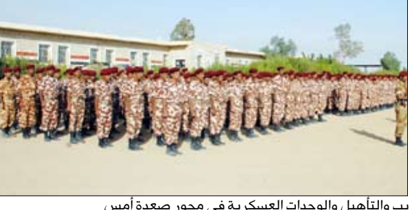
وزير الدفاع خلال تفقده معسكرات التدريب والتأهيل والوحدات العسكرية في محور صعدة أمس