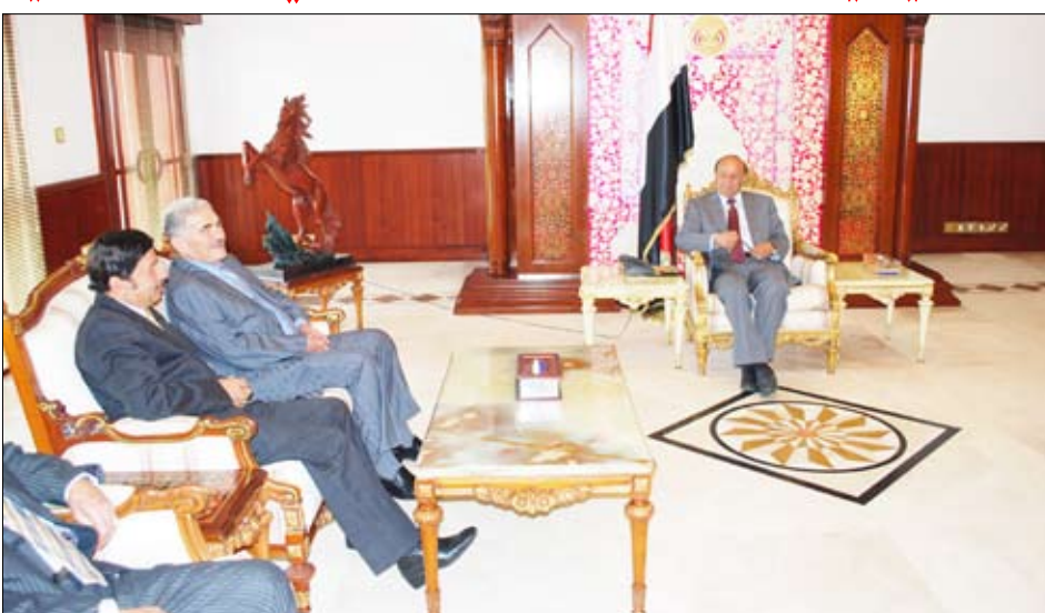
نائب الرئيس لدى استقباله الأمين العام المساعد لحزب البعث الاشتراكي أمس

استقبل الأخ عبد الغد ربه منصور هادي نائب رئيس الجمهورية أمس في القصر الجمهوري بعدن وفد حزب البعث العربي الاشتراكي الذي يزور اليمن حالياً برئاسة الأمين العام المساعد للحزب عبد الله الأحمر. وجرى في اللقاء النقاش والتداول حول العديد من القضايا المتصلة بالنشاطات الحزبية وتفاصيل الاتفاقيات واللقاءات التي تجري في ظل النهج الديمقراطي والتعددية الحزبية والسياسية. وأشار عبد الله الأحمر إلى أن لقاءاته مع الكثير من الأحزاب والقوى السياسية والفعاليات المختلفة سادتها الروح الودية. وقال: "إنه لمس أن الجميع يعتبرون وحدة وأمن واستقرار اليمن من التوابت التي لا يخطأها أي مساس... وأشار إلى أن سوريا بقيادة وحزبا وشعباً مع وحدة