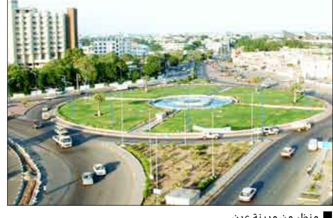
منظر من مدينة عدن