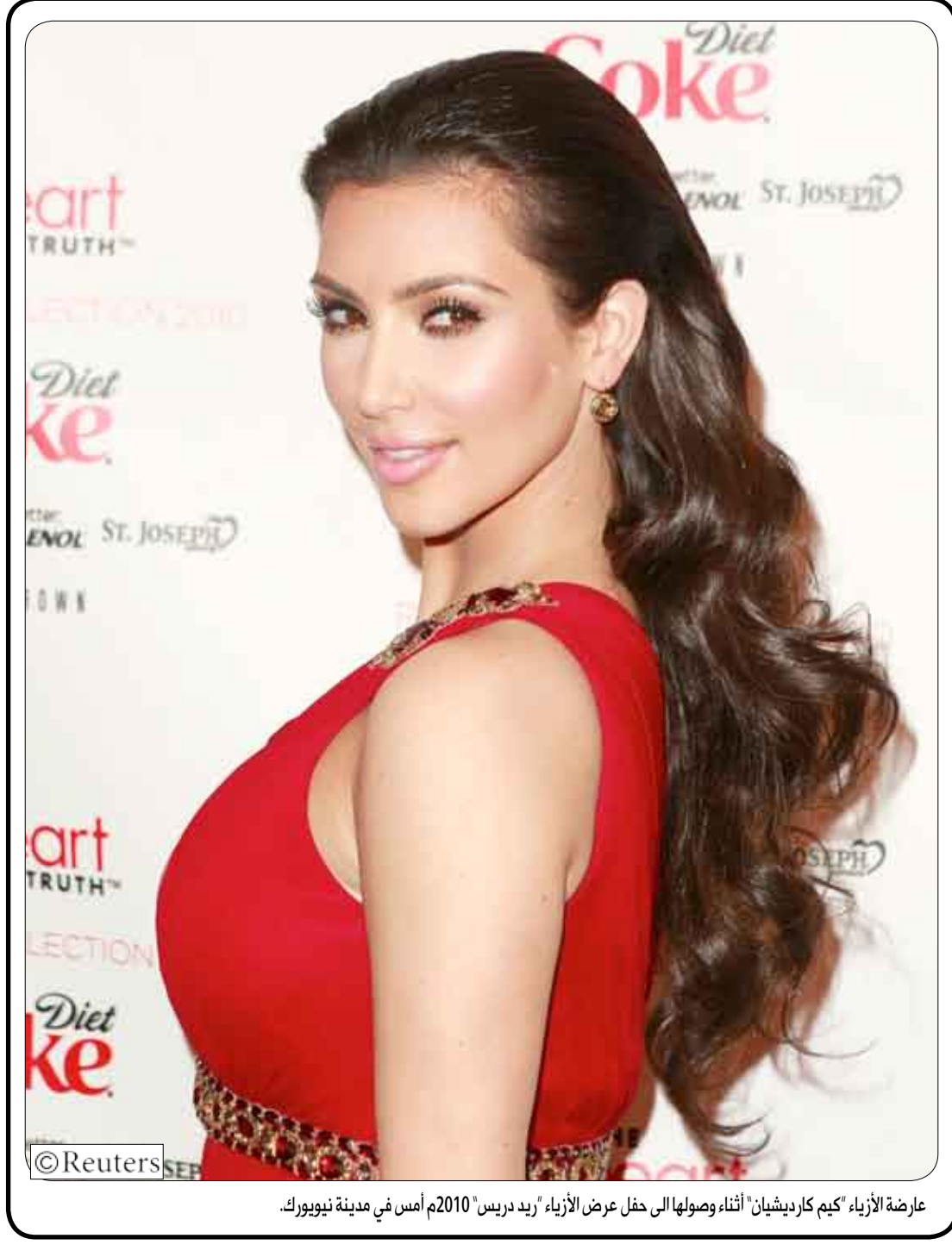
عارضه الأزياء 'كيم كارديشيان' أثناء وصولها الى حفل عرض الأزياء 'ريد دريس' 2010م أمس في مدينة نيويورك.