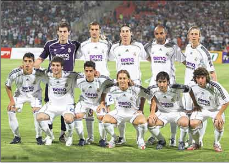
فريق ريال مدريد