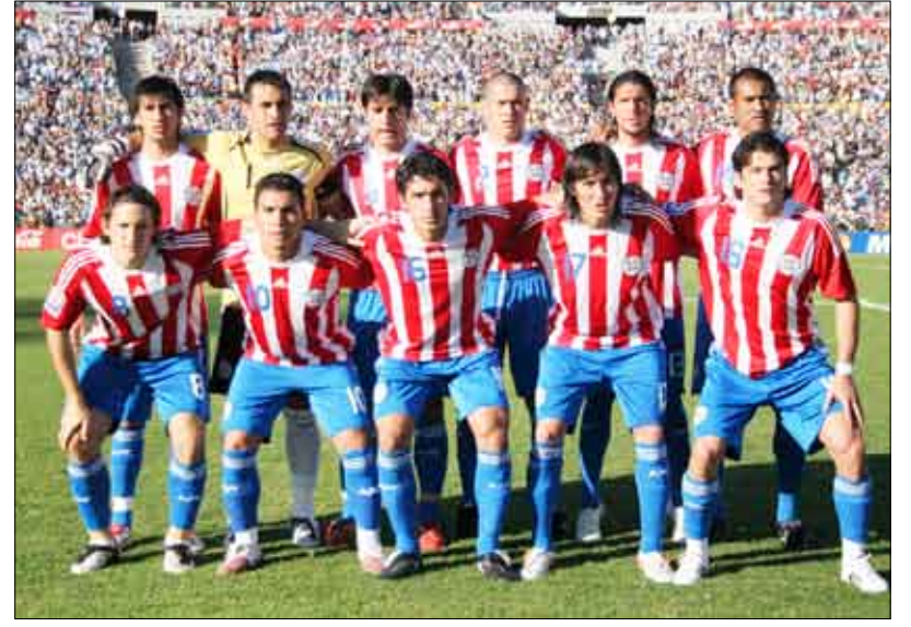
فريق اتليكو مدريد