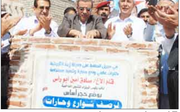
أبورأس أثناء وضعه الحجر الأساس لرصف شوارع مدينة زبيد

وضع نائب رئيس الوزراء للشئون الداخلية صادق أمين أبو رأس ومعه محافظ صعدة أحمد سالم الجبلي حجر الأساس لتنفيذ مشروع رصف 10 آلاف 500 متر مربع من مساحات شوارع مدينة زبيد التاريخية بكلفة 128 مليون ريال وتمويل الصندوق الاجتماعي للتنمية. وحدث نائب رئيس الوزراء أثناء وضع الحجر الأساس وبحضور وزراء الأوقاف والإرشاد القاضي حمود الهتار والتعليم الفني والمهني الدكتور ابراهيم حجري والثقافة محمد البوبكر المحلي الجهات الموكلة لها عملية التنفيذ والإشراف على الالتزام بالموصفات