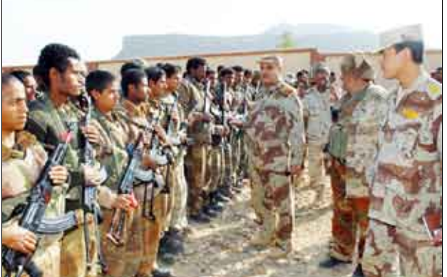
.. ولدى تفقده أبطال القوات المسلحة في محور صعدة