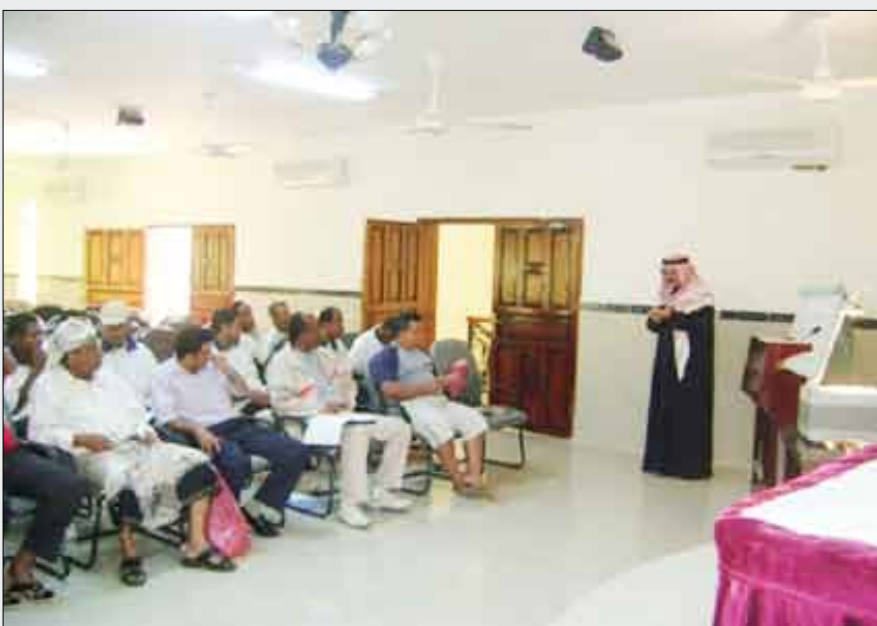
جانب من الحضور في الدورة التحكيمية