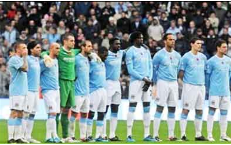
فريق مانشستر سيتي

لخوض نهائيات كأس العالم المقبلة في جنوب أفريقيا. وسيحاول مانشستر سيتي أن يقترب من أول نهائي له منذ عام 1981 في هذه المسابقة بالذات، عندما يستضيف ستوك سيتي. وكان سيتي قاب قوسين أو أدنى من بلوغ أول نهائي له منذ فترة طويلة عندما تقدم على جاره مانشستر يونايتد 2 - 1 في ذهاب الدور النصف النهائي لكأس رابطة الأندية الإنكليزية لكنه خسر إياباً 1 - 3. وفي المباريات الأخرى، يلتقي دربي كاونتري مع برمنغهام، وريدينغ مع وست بروميتش البيون، وساوثمبتون مع بورتسموث، وبولتون مع توتنهام، وفولهام مع نوتس كاونتري، وكريستال بالاس مع أستون فيلا.