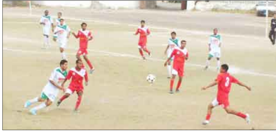
من مباراة حسان والرشد من الارشيف