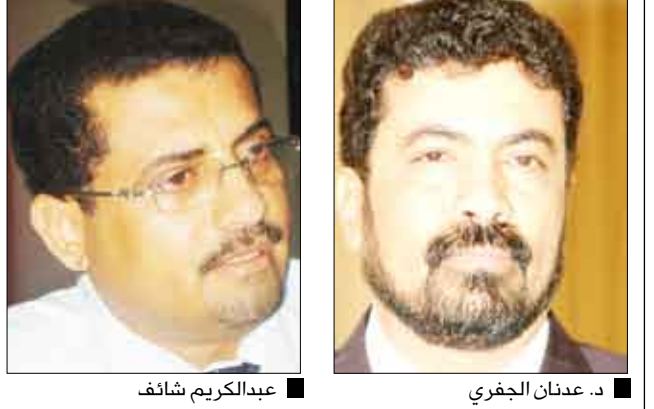
د. عدنان الجفري ■ عبدالكريم شائف

في فجنان". وحدث أعضاء المجلس المحلي في عدن في بيان تلقى "14 أكتوبر" نسخة منه هذه الأقسام بأنه لا يمكن السكوت عن الاستمرار في صنع مثل هذه الأكاذيب والحكايات والفبركات الإعلامية وتصوير أحداث ووقائع لم تكن قد حصلت في الواقع، والدليل على ذلك ما اشيع من خلاف بين الأخوين المحافظ والأمين العام حول المهرجان القادم للوحدة اليمنية بعض الصحف التابعة لحزب التجمع اليمني للإصلاح والمواقع الإلكترونية التابعة لها وعدد من الصحف الأخرى حول وجود خلافات بين د. عدنان عمر الجفري محافظ المحافظة ورئيس عبر أعضاء المجلس المحلي لمحافظه عدن عن استيائهم واستنكارهم للأخبار الملفقة والعارية من الصحة التي نشرتها بعض الصحف التابعة لحزب التجمع اليمني للإصلاح والمواقع الإلكترونية التابعة لها وعدد من الصحف الأخرى حول وجود خلافات بين د. عدنان عمر الجفري محافظ المحافظة ورئيس