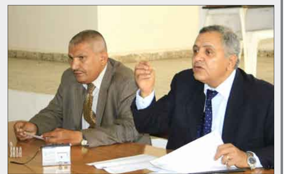
خلال افتتاح اللقاء التشاوري

الصحية بهذا الخصوص. كما تضمنت التوصيات معالجة وتنظيم وضع الصيدليات القائمة من النواحي الفنية والمهنية حسب القوانين والقرارات الوزارية المنظم لشروط الصيدليات. فيما استعرض نائب نقيب الأطباء والصيدلة اليمنيين والأمين العام المساعد لاتحاد الصيدلة العرب الدكتور محمد المهدي، الجوانب القانونية اللازمة لفتح الصيدليات وشروط الاستثمار في هذا المجال في ضوء قانون المنشآت الصحية.