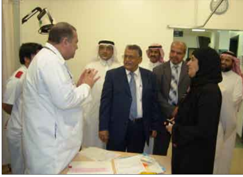
وفد جامعة عدن يستمع إلى شرح أثناء زيارة مستشفى بقشان