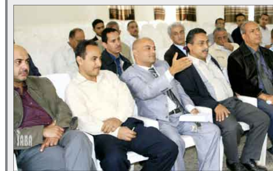
جانب من المشاركين في اللقاء التشاوري الثاني لنقابة الصيدلة