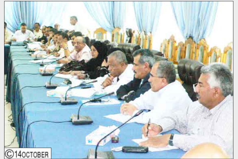
وزير التربية يترأس اختتام اللقاء التشاوري للقيادات التربوية