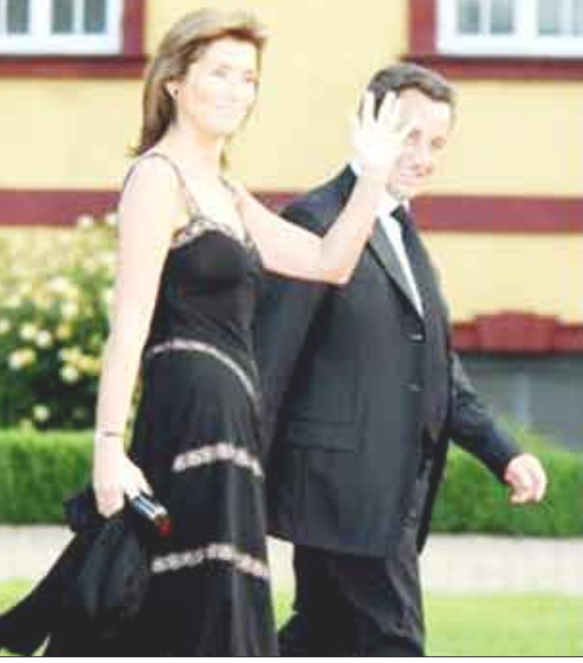
الرئيس الفرنسي مع زوجته السابقة

تمارسه المرأة على زوج تستطيع احتضانه وأحياناً جعل الأمر تحدياً ومغامرة يجب الفوز بها من خلال إضغاع المرأة الفارعة الطول، لذا يمارس سحره ويبتغي عواطفه حتى تقع في شباكه فيحقق انتصاره.