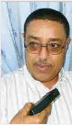
عبدالكريم محمود صبري

لقد شكلت الكلمة التوجيهية للمناضل الأخ عبدربه منصور هادي نائب رئيس الجمهورية لدى افتتاحه هذا اللقاء أمس توجيهات وإرشادات قيمة مكنت اللقاء التربوي من أن يضع تصوراً لبرنامج عمله للتطوير والارتقاء بالعملية التعليمية وهذه التوجيهات الراقية التي لامست صميم العمل التربوي قد دفعت بقيادة الوزارة مع مدراء مكاتب التربية إلى أن يحددوا تفاصيل أكثر دقة وأكثر وضوحاً فيما يتعلق بالارتقاء بالأنشطة المدرسي ووضع ضوابط لعملية تنقلات المعلمين وإعادة التوزيع وقد وجه فخامة نائب الرئيس بتشكيل دائمة تتولى إعادة ضبط عملية التنقل وضبط التربويين الذين هم خارج النشاط التدريسي حتى يتم احتساب القوام للعمل التربوي والمشاركين في العملية التعليمية وفقاً لأعداد الطلاب بما