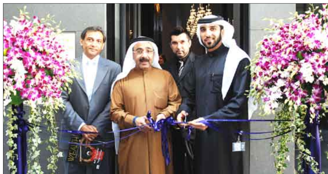
خلال افتتاح مركز دبي