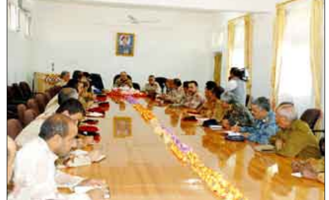
وزير الدفاع لدى لقائه القيادات العسكرية

دعائم الأمن والاستقرار.. وحثهم على مزيد من اليقظة والتحلي بأعلى درجات الانضباط العسكري والأمني بما يساهم في تثبيت الأمن والاستقرار وإحلال السلام في محافظة صعدة. وقد قام اللواء الركن محمد ناصر أحمد وزير الدفاع بزيارة تفقدية إلى معسكر التدريب والتأهيل وعدد من المواقع العسكرية في محور صعدة والتقى بالإخوة المقاتلين، وأشاد بيقظتهم التقى اللواء الركن محمد ناصر أحمد وزير الدفاع ومع اللواء الركن سالم قطن نائب رئيس هيئة الأركان للقوى البشرية أمس بقيادة الوحدات العسكرية والأمنية بمحور صعدة وخلال اللقاء نقل إليهم تحيات فخامة الأخ الرئيس علي عبد الله صالح رئيس الجمهورية القائد الأعلى للقوات المسلحة وتقديره لجهودهم التي يبذلونها في سبيل ترسيخ