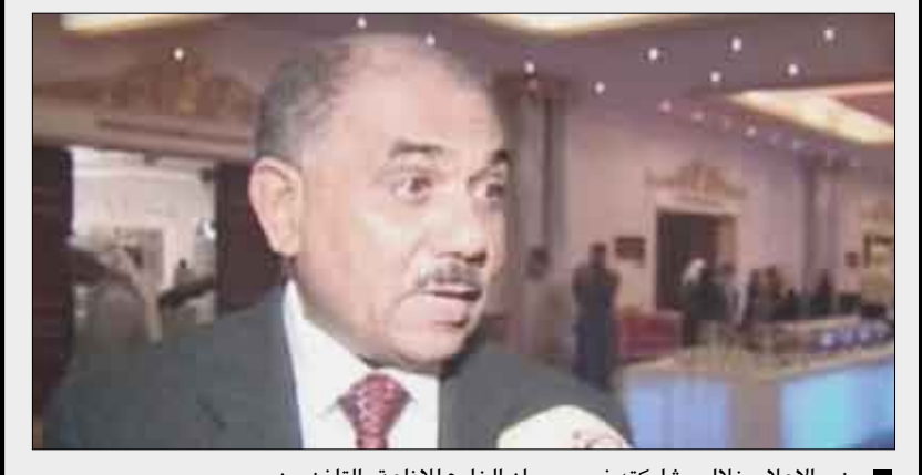
وزير الإعلام خلال مشاركته في مهرجان الخليج للإذاعة والتلفزيون

للإخوة المغتربين وستقدم خلاله العديد من الأعمال الأدبية والفنية . وأوضح الوزير أن وزراء الإعلام في مجلس التعاون لدول الخليج العربية قد حضروا المهرجان وكانت فرصة ثمينة للقاء والتعاون في معظم القضايا الجوهرية. مبينا أن مشاركة اليمن في المهرجان تعد أيضا نوعا من التواصل الوثيق الذي ستكون له آثاره الإيجابية في العمل الإعلامي المستقبلي وكذا تعزيز أفاق التعاون على المستوى الثنائي والإقليمي ولمزيد من توثيق العلاقات والاستفادة من الخبرات والتجارب.