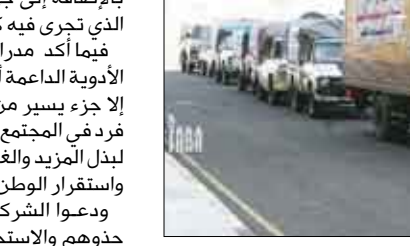
قافلة طبية من شركات الأدوية لأبطال القوات المسلحة الجرحى في مستشفى « 48 »

في استقبال ومعالجة الجرحى من أبناء القوات المسلحة والمواطنين الشرفاء المستهدفين من عناصر الإرهاب والتخريب بالإضافة إلى جهود المستشفى الميداني الذي تخرى فيه كل العمليات الجراحية. فيما أكد مدراء وممثلو عدد من شركات الأدوية الداعمة أن ما يقدمونه اليوم ماهو إلا جزء يسير من الواجب الملحق على كل فرد في المجتمع، معبرين عن استعدادهم لبذل المجهود والغالي والتفيس من أجل أمن واستقرار الوطن. ودعوا الشركات الأخرى إلى أن تحذوا حذوهم والاستجابة لنداء الوطن والواجب ومساندة الجهود الجبارة التي يبذلها مستشفى 48 وإدارته وأسنادا لأدواره الإنسانية والوطنية التي يقوم بها في مختلف الظروف، مؤكداً أن هذا الزخم الوطني والشعبي هو رسالة للمرجعين في الدائل والخارج.