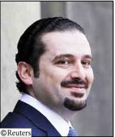
رئيس الوزراء اللبناني سعد الحريري في باريس يوم 22 يناير 2010 .