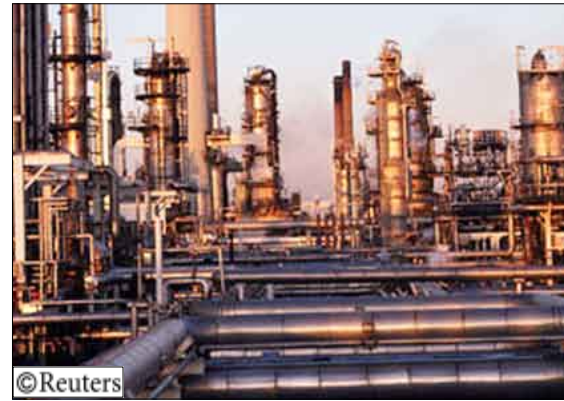
منشأة كركوك النفطية

بغداد /متابعات: تعرض أنبوب لنقل النفط الخام من حقول كركوك إلى مصفاة السدورة في بغداد لتفجير بعثة ناسفة من منتصف ليل أمس الأول. وأعلن صباح يوم أمس الأربعاء وزير النفط حسين الشهرستاني أن «مجرمين يريدون حرمان الشعب من المنتقات النفطية فجروا منتصف الليل أنبوبا للنفط الخام في منطقة الرشدية بعثة 15 كيلومتر شرق بغداد» في ناسفة، موضحا أن «هذا الأنبوب تم تأهيله قبل أيام، وجرى العمل به للمرة الأولى منذ سقوط النظام، إثر تعرضه إلى عمليات تخريبية». وأكد أن «الأيام القليلة التي عمل فيها الأنبوب رفع