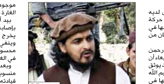
مسعود في صورة التقطت له في مارس/آذار الماضي في شمال وزيرستان

موجودا فيه دون أن يعلن عن مصيره بعد الغارة مباشرة. يبد أن مسؤولا في حركة طالبان اعترف بإصابة مسعود في الغارة المذكورة قبل أن يخرج المتحدث باسم الحركة عزام طارق وينفي هذه المعلومات مؤكدا أن حكيم الله ومسعود لم يكن أصلا في الموقع المستهدف في الغارة الأمريكية. وبعد يومين من الغارة، بثت طالبان تسجيلا منسوبا إلى مسعود يؤكد فيه أنه حي وبواصل قيادته للحركة. يبد أن مسؤولا أمنيا باكستانيا قال إن حكيم الله مسعود أصيب بجروح بالغة في غارة أخرى استهدفت عربتين شمال وزيرستان في السابع عشر من الشهر الماضي أي في اليوم التالي لبث الشريط المسجل. وفي شأن أممي متصل، اعترف الجيش الباكستاني الأربعاء بتحطم مروحية تابعة له أثناء قيامها بغارة على مواقع مسلحي طالبان في منطقة القبائل. وبينما أكد مصدر عسكري استمرار البحث عن طاقم الطائرة المؤلف من طيار ومساعد، أشار مسؤول الإدارة المحلية بشيفر الله وزير إلى أن المروحية -وهي من طراز كوبر- تحطمت في منطقة وادي تيرا في منطقة خيبر وزيرستان على مقربة من الحدود الأفغانية.