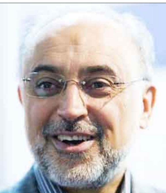
علي أكبر صالحى رئيس هيئة الطاقة الذرية الإيرانية في طهران .

إيران من تخزين مواد كافية لتصنيع سلاح نووي. وكانت إيران تخصب اليورانيوم الى مستوى 3.5 في المئة قبل ان ترتفع الى نسبة 20 في المئة امس. ويطلب صنع قنبلة نووية تخصيب اليورانيوم بنسبة 90 في المئة. وأوضح صالحى ان إيران ستوقف انتاج قنبلة وقود نقي بنسبة 20 بالمئة لمفاعلهما إذا حصلت عليه من الخارج بدلا من ذلك. لكنه اوضح ان طهران لم تتراجع عن مطلبها بان يتم التبادل بشكل متزامن وهو شرط على الأرجح لن تقبله القوى الكبرى المشاركة في جهود للتوصل إلى حل دبلوماسي للنزاع المحتدم منذ فترة طويلة. وأضاف صالحى «اليورانيوم يمكن ان يوضع تحت وصاية الوكالة الدولية للطاقة الذرية» في إيران ويمكن وضع اخطام عليه...والى ان تتسلم اليورانيوم بنسبة 20 في المئة من الخارج. «انا تقدموا ومدونا بالوقود حينها سنوقف عملية التخصيب بنسبة 20 في المئة». الدولي ككل.» وكانت أوباما تولي مصيبة متعددا بالتحلي عن سياسة حكومة الرئيس الامريكى السابق جورج بوش الساعية إلى عزل إيران لكنه اتخذ موقفا أكثر تشددا منذ الانتخابات المتنازع على نتائجها هناك في يونيو حزيران الماضي وانقضاء مهلة في ديسمبر كانون الأول كان قبل حددها لتهران لقبول الاتفاق الذي اقترحه الوكالة الدولية للطاقة الذرية. وتجاهلت إيران الضغوط الدولية وأعلنت يوم الأحد انها ستخصب اليورانيوم بنسبة 20 في المئة لاستخدامه في مفاعل ينتج نظائر لعلاج مرض السرطان. واعلنت يوم الثلاثاء ان العمل بدأ. وانتقد طهران هذا القرار بعد فشل الاتفاق على شروط المبادلة الذي كانت سترسل إيران بموجبه معظم مخزونها من اليورانيوم المخصب إلى الخارج مقابل حصولها على وقود مخصب إلى درجة نقاء بنسبة 20 في المئة. والقصد من هذه المبادلة هو منع