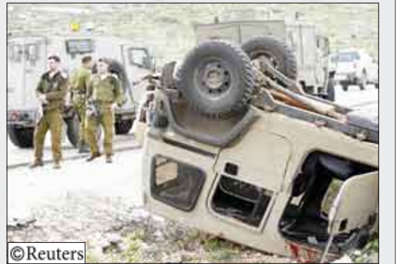
جنود إسرائيليون في موقع الحادث في مدينة نابلس بالضفة الغربية يوم أمس الأربعاء.

القدس / 14 أكتوبر (رويترز) : قال الجيش الإسرائيلي إن فلسطينيا طعن وقتل إسرائيليا يوم أمس في الضفة الغربية المحتلة. وقال ميكي روزنفيلد وهو المتحدث باسم الشرطة إن الإسرائيلي الذي كان في سيارة جيب توقفت عند تقاطع للطرق بالقرب من مدينة نابلس بالضفة الغربية تلقى طلعتا في الصدر. وقال المتحدث باسم الجيش إن الإسرائيلي توفي في وقت لاحق دون أن يكشف عن هويته. وجاء حادث الطعن يوم أمس الأربعاء عقب ما قال فلسطينيون انه إصابة فلسطيني في السابعة عشرة من عمره في يوم سابق بيد مستوطن أطلق النار عليه قرب نابلس. وقال الجيش الإسرائيلي إن حارسا بمستوطنة أطلق النار في الهواء لتفريق راجعي حجارة وأنه يحقق في تقارير بأن فلسطينيا أصيب بجروح. ويوجد قلق في سذرا رفض إسرائيل بشأن الأمن وفعالية قوات الأمن الفلسطينية التي دربتها الولايات المتحدة والمالية للرئيس المدعوم من الغرب محمود عباس في الضفة الغربية. والأمن عامل أساسي في أي معادلة لمبادلة الأرض بالسلام تؤدي إلى قيام دولة فلسطينية. وطالب عباس الذي رفض العودة إلى المحادثات مع إسرائيل حتى تكف عن إسقاط الاستيطان بوقف الهجمات العسكرية في الضفة الغربية وهي الأراضي التي وصفتها الاتفاقات المؤقتة بأنها تتبع السيطرة الفلسطينية.