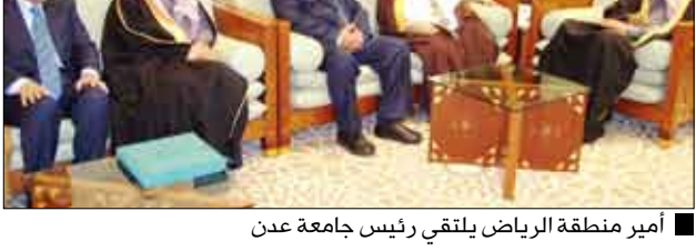
أمير منطقة الرياض يلتقي رئيس جامعة عدن

الرياض / نصر باغريب: أكد صاحب السمو الملكي الأمير سلمان بن عبدالعزيز آل سعود أمير منطقة الرياض أمس عمق العلاقات السعودية اليمنية الصارمة جذورها في أعوار الزمن وارتباط الشعبين والبلدين الشقيقين والجارين