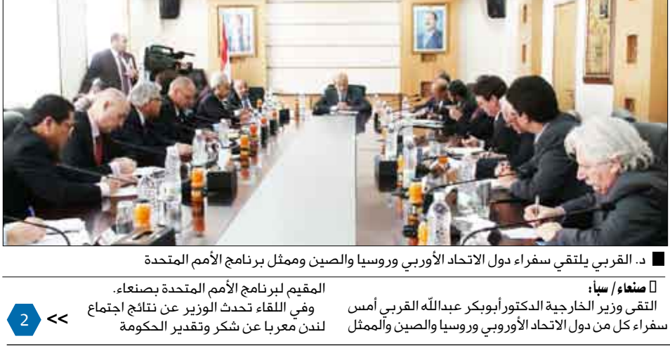
د. التقري يلتقي سفراء دول الاتحاد الأوروبي وروسيا والصين وممثل برنامج الأمم المتحدة

صنعاء / سيا: القيم لبرنامج الأمم المتحدة بصنعاء. وفي اللقاء تحدث الوزير عن نتائج اجتماع لندن معرباً عن شكر وتقدير الحكومة