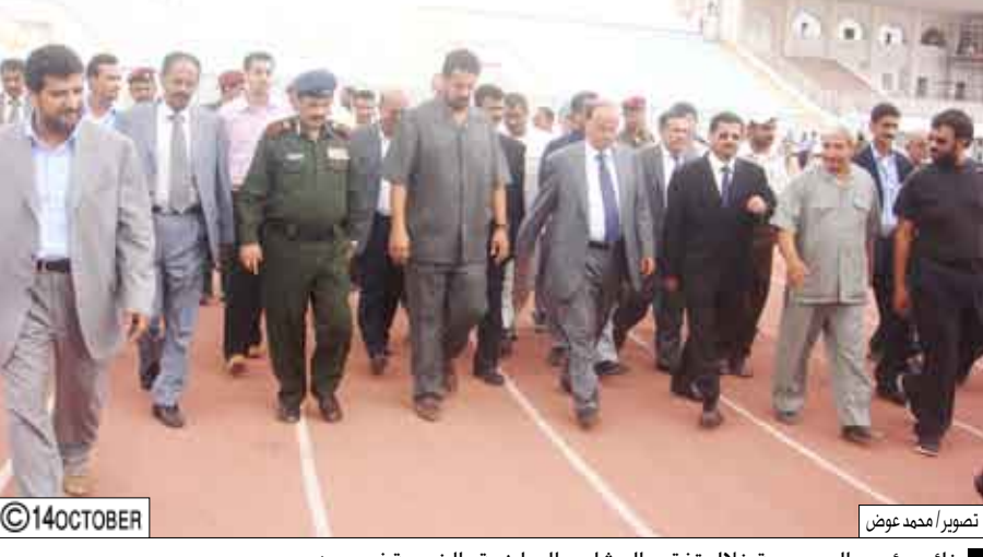
نائب رئيس الجمهورية خلال تفقده المشاريع الرياضية والخدمية في عدن

عدن / سيا: قام الأخ عبدربه منصور هادي نائب رئيس الجمهورية أمس وفي إطار زيارته لمحافظة عدن بزيارات لعدد من المشاريع الرياضية والخدمية وتفقد سير العمل الجاري لانجازها بصورة نهائية وبكلفة استثمارية تزيد على 10 مليارات ريال. واستهل نائب الرئيس تلك الزيارات بتفقد العمل الجاري في ملعب حقاق التابع لنادي التلال الرياضي ، مطالعاً على طبيعة التصميم وحجم الاستيعاب البالغ نحو 10 آلاف متفرج، كما تفقد نائب رئيس الجمهورية سير العمل الجاري بوتائر عالية لإعادة تأهيل استاد 22 مايو ، وتجوول في مختلف مرافق المشروع الخدمية والإدارية والرياضية والمداخل الواسعة في مختلف واجهات الملعب. بعد ذلك تفقد الأخ عبدربه منصور هادي نائب رئيس الجمهورية سير العمل الجاري في الشوارع الجديدة ذات العرض 50 متراً و90 متراً وغيرها من الطرقات والشوارع وهي محيطة ومتصلة من مطار عدن الدولي إلى الاستاد الرياضي ويطول 32 كيلو متراً وبكلفة تقارب 4 مليارات ريال. وفي مديرية العلا زار الأخ نائب رئيس الجمهورية ملعب نادي شمسان الرياضي الذي يجري العمل على تجهيزه مع سائر المشاريع الرياضية وذلك بهدف استكمال كافة التجهيزات الخاصة بخليجي (20).