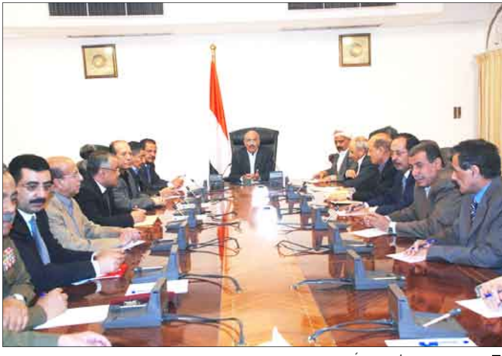
رئيس الجمهورية يترأس اجتماعاً لمجلس الدفاع الوطني

مواقبت: الفجر 5:12 | الشروق 6:24 | الظهر 12:16 الصلاة: العصر 3:34 | المغرب 6:04 | العشاء 7:08 حسب التوقيت المحلي لمدينة عدن