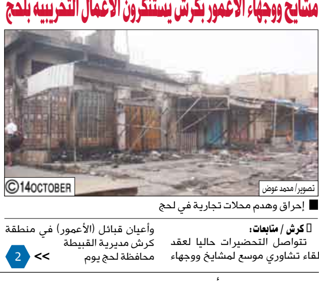
إحراق وهدم محلات تجارية في لحج

كروش / متابعات: وأعيان قبائل (الأعمور) في منطقة كرش مديرية القبيطة محافظة لحج يوم لقاء تشاوري موسع لمشايخ ووجهاء