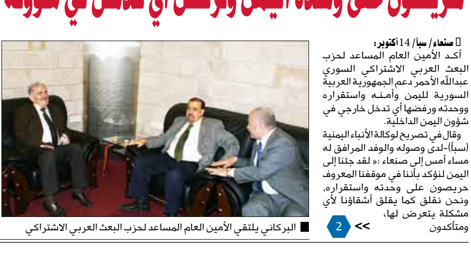
البركاني يلتقي الأمين العام المساعد لحزب البعث العربي الاشتراكي

صنعاء / سيا / 14 أكتوبر: أكد الأمين العام المساعد لحزب البعث العربي الاشتراكي السوري عبدالله الأحمر دعم الجمهورية العربية السورية لليمن وأمنه واستقراره ووحدته ورفضها أي تدخل خارجي في شؤون اليمن الداخلية. وقال في تصريح لوكالة الأنباء اليمنية (سبأ)-لدى وصوله والوقد المرافق له مساء أمس إلى صنعاء: « لقد جننا إلى اليمن لنؤكد باننا في موقفنا المعروف حريصون على وحدته واستقراره، ونحن نعلق كما يعلق أشقاؤنا لأي مشكلة يتعرض لها، ومتأكدون