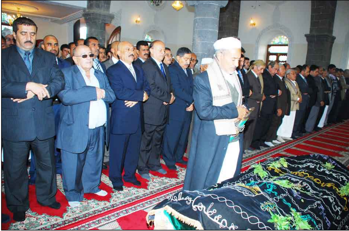
أثناء الصلاة على الفقيد