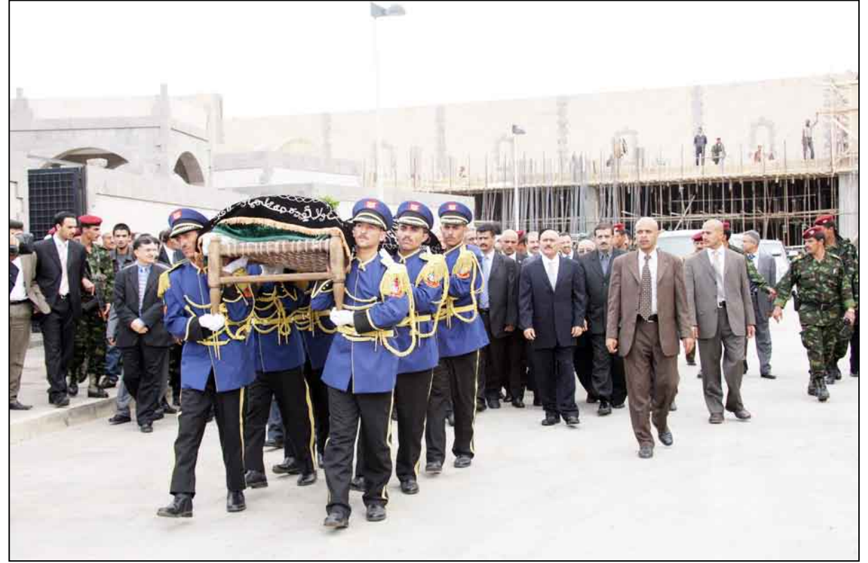
رئيس الجمهورية في مقدمة المشيعين