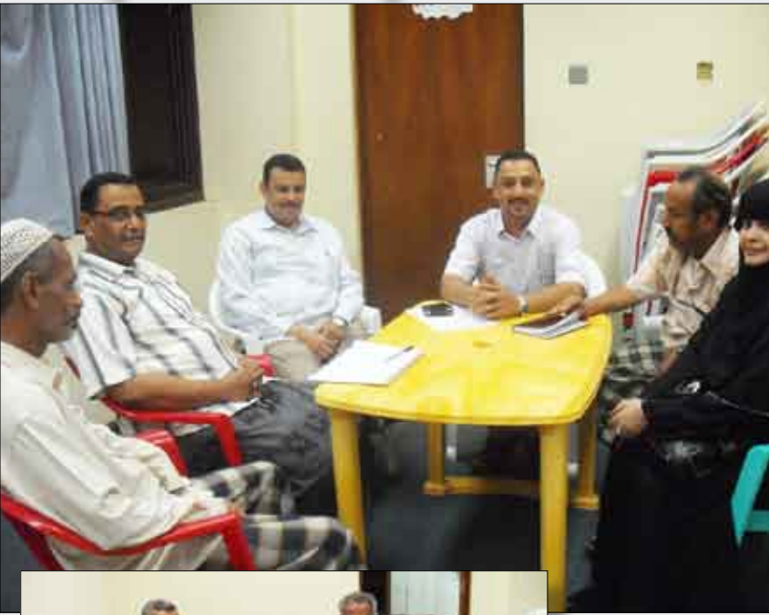
من اجتماع اتحاد الطاولة

□ عدن / عبد الجبار نويصر: عقد عصر أمس في الصالة الرياضية المغلقة بعد اجتماع استثنائي ترأسه الدكتور عصام السنيني رئيس الاتحاد اليمني العام لكرة الطاولة، حيث ناقش الاجتماع العديد من القضايا المتعلقة بتطوير اللعبة وكيفية انعاش أندية عدن في لعبة كرة الطاولة.