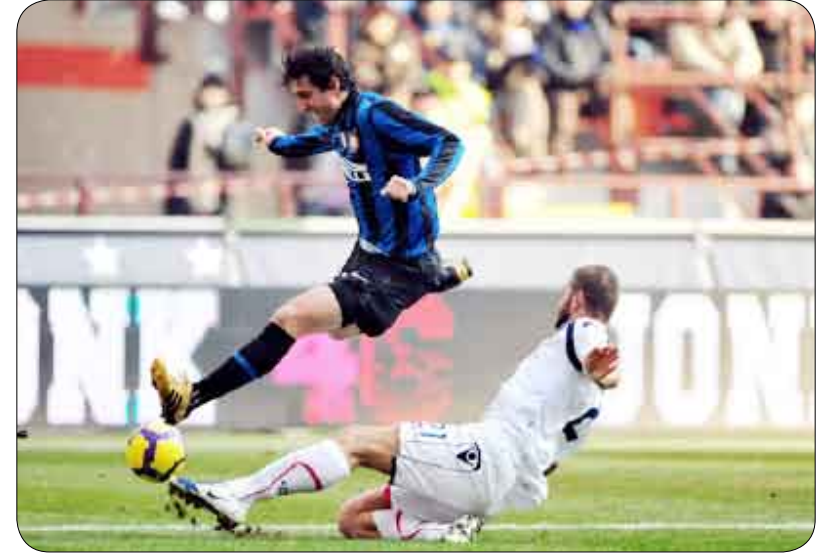
من مباريات الدوري الإيطالي

لاسيو 1 : 0 كاتانيا بولونيا 0 : 0 الأول إنتر ميلان 3 : 0 كالياري أودينيزي 3 : 1 نابولي سينيا 2 : 2 سامبدوريا جنوى 1 : 0 كليفو فيرونا