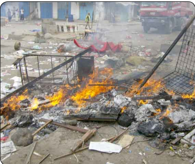
بقايا ممتلكات للبايعاء محترقة في الشارع العام