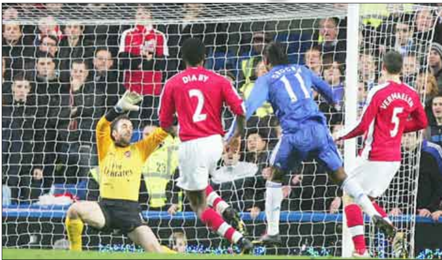
لقطات من الدوري الإنجليزي

الأخ أبو ديابي وثيو الكوت، فتنشلت الجبهة الهجومية بشكل كبير لكن من دون أن يتمكن من هز الشباك. وتدخل تشيك مرة جديدة أمام بندتر لإنقاذ فريقه من هدف أكيد (80). وكاد دروغبا يسقط أرسنال بالضربة القاضية وتسجيل هاتريك، لكن الكرة التي سددها من ركلة حرة مباشرة اصطدمت بالعارضة وضاعت (84). وسنحت فرصة أمام فايرغاس لكن كرتة الرأسية مرت إلى جانب القائم الأيمن لتنتش في الوقت بدل الضائع.