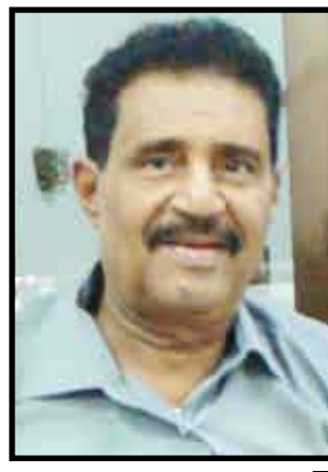
الفقيد الفنان / فيصل علوي

■ منعاه / سبأ: بعث فخامة الأخ الرئيس علي عبد الله صالح رئيس الجمهورية برقية عزاء ومواساة إلى باسل فيصل علوي وأخواته وكافة أفراد أسرته عبر فيها عن تعازيه في رحيل الفنان الكبير فيصل علوي بعد حياة حافلة بالعطاء في سبيل خدمة الأغنية اليمنية وتطويرها . وكان الفقيد رحمه الله قائم فنية كبيرة أثرى واقع الأغنية اليمنية التي تشدو للوطن ووجدته بالكثير من ابداعاته وإسهاماته المتميزة وكان أحد رواد الأغنية الشعبية الوطنية التي أسهم في نشرها وكان لها جمهورها الواسع ليس في الساحة اليمنية فحسب بل في منطقة الجزيرة العربية والخليج . وعبر فخامته عن مواساته لأفراد أسرة الفقيد وكافة محبيه في هذا المصاب الأليم . سائلاً الله العلي القدير أن يتغمد الفقيد بواسع رحمته وأن يسكنه فسيح جناته وأن يلهم أهله وذويه الصبر والسلوان . " إنا لله وإنا إليه راجعون "