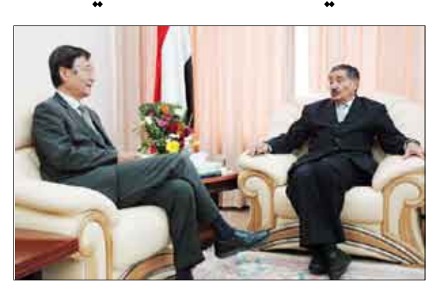
رئيس مجلس الشورى لدى لقائه سفير اليابان

استقبل رئيس مجلس الشورى عبد العزيز عبدالغني السفير الياباني لدى اليمن ماساكازو توشيكاجي بمناسبة انتهاء فترة عمله وقامه اللقاء عبر رئيس مجلس الشورى عن ارتياحه العظيم للتطور المستمر في العلاقات الثنائية والتعاون المثمر القائم بين اليمن واليابان، مثنيا على الدور الذي قام به السفير توشيكاجي في تطوير وإنماء العلاقات الثنائية، وأوجه الدعم التي يقدمها اليابان لصالح التنمية في اليمن، متمنيا له التوفيق والدكتور محمد قرعة.