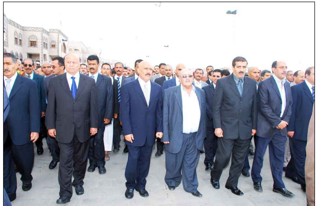
جموع المشيعين وفي مقدمتهم فخامة الرئيس

أوائل الذين وضعوا اللبنة الأولى للتربية والتعليم في الوطن من بعد قيام ثورة 26 سبتمبر المباركة ، ووهب حياته لخدمة العلم والثقافة من خلال توليه العديد من المناصب منها منصب وزير للتربية والتعليم كما كان له دور كبير في إنشاء جامعة صنعاء وأخيراً عمل رئيساً لمؤسسة العفيف الثقافية التي أسهمت بدور بارز في دعم المثقفين والحركة الثقافية والأدبية في اليمن، سائلاً الله العليّ القدير أن يتغمّد الفقيد الراحل بواسع رحمته ويسكنه فسيح جناته ويلهم أهله وذويه ومحبيه الصبر والسلوان .