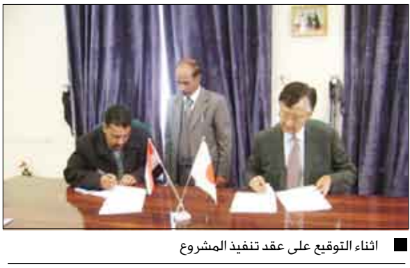
اثناء التوقيع على عقد تنفيذ المشروع

منح لحوالي ست عشرة جمعية ومنظمة في اليمن بمبلغ إجمالي يزيد على 1.2 مليون دولار أمريكي وذلك لتمويل مشروعاته التنموية الصغيرة الحجم في إطار نفس البرنامج .