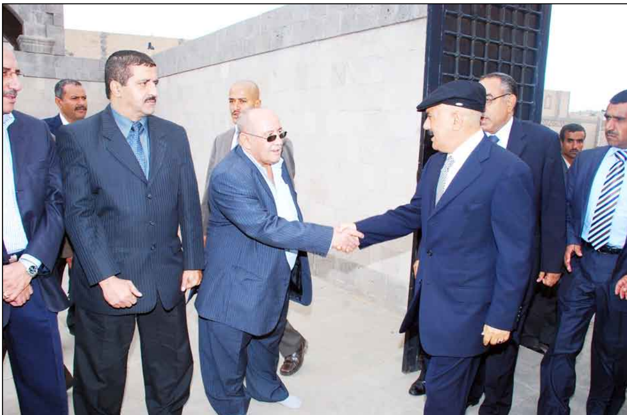
الرئيس يعزي أسرة الفقيد