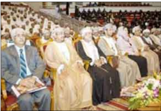
من ندوة التبادل الحضاري بين اليمن والسلطنة

■ مسقط / سبأ: وصف الوزير المسؤول عن الشؤون الخارجية بسلطنة عمان يوسف بن علوي بن عبدالله العلاقات اليمنية العمانية بأنها " ثروة للأجيال القادمة " . جاء ذلك في كلمته في الجلسة الافتتاحية لندوة التبادل الحضاري بين اليمن والسلطنة التي بدأت أمس في العاصمة مسقط وينظمها مركز