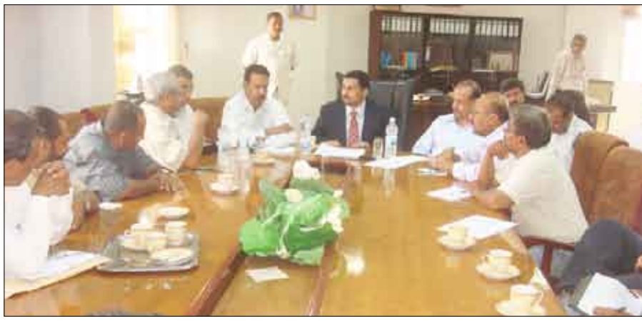
شايف خلال اجتماعه بالمقاولين المنفذيين لمشاريع خليجي ( 20 )

منفذ من قبل المقاولين وإزالة أي صعوبات تعيق المشاريع المنفذة ورفعها إلى مجلس الوزراء .