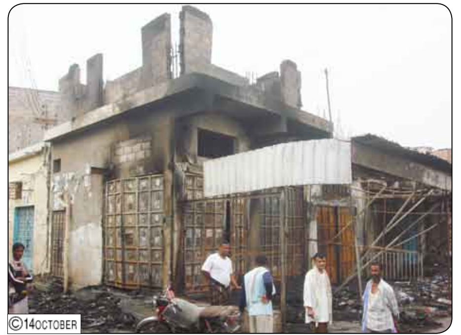
أعمال التخريب طالت ممتلكات المواطنين