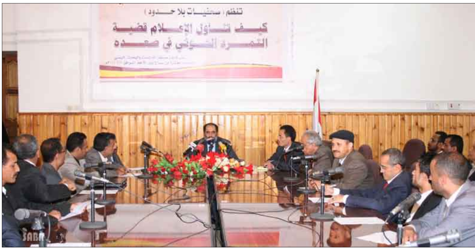
من الندوة الخاصة بكيفية تناول وسائل الإعلام لأحداث التمرد في صعدة

صراع إقليمي مركزه وتمويله قوى هيمنة إقليمية تمول سفك دماء اليمنيين لإيجاد موطئ قدم لها يخدم أهدافها وأطماعها في السيطرة على المنطقة. وقد أثرت الندوة بالعديد من المداخلات والتعقيبات من قبل الحاضرين من الأكاديميين والباحثين والسياسيين والإعلاميين والمهتمين.