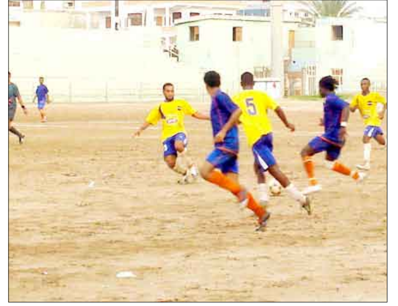
من الدوري العام