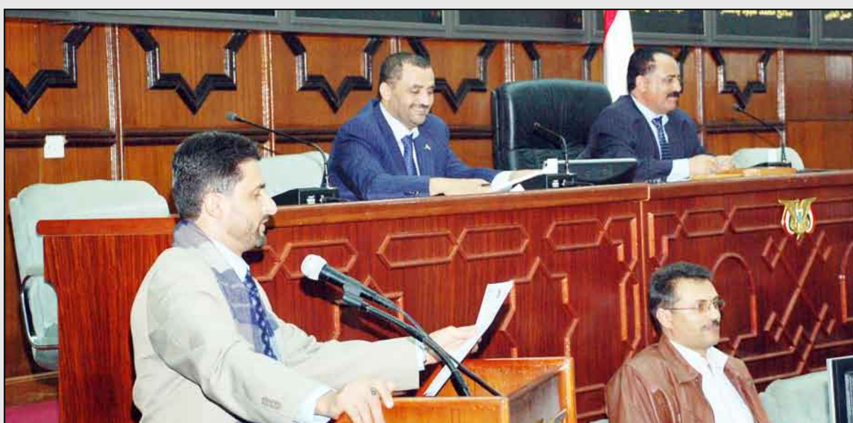
من جلسة البرلمان أمس

بالقانون رقم (1) لسنة 2006م فيما يخص تعزيز الإنضباط لعملية حضور جلسات المجلس ولجانته الدائمة ومتابعة اللجان لتقديم تقارير عن المواضيع المحالة إليها في ضوء المدة الزمنية المحددة باللائحة ومتابعة اللجان الدائمة بوضع برامج عمل تتضمن الأولويات والمهام التشريعية والرقابية الموكله إليها وفقاً لمقتضيات نصوص اللائحة الداخلية ورفع عمليات النزول الميداني للجان بخطط واضحة وهادفة . وأشارت اللجنة البرلمانية إلى أهمية تفعيل جانب التدريب والتأهيل لكادر المجلس وفقاً للخطط والبرامج المتصلة بذلك . وكان المجلس قد استهل جلسته باستعراض محضر جلسته السابقة وأقره . وسيوصل أعماله صباح اليوم الاثنين بحشيئة الله تعالى .