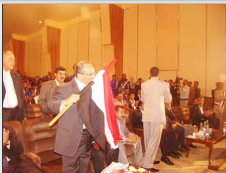
رئيس مجلس التنسيق لأندية أمانة العاصمة يقبل علم الجمهورية