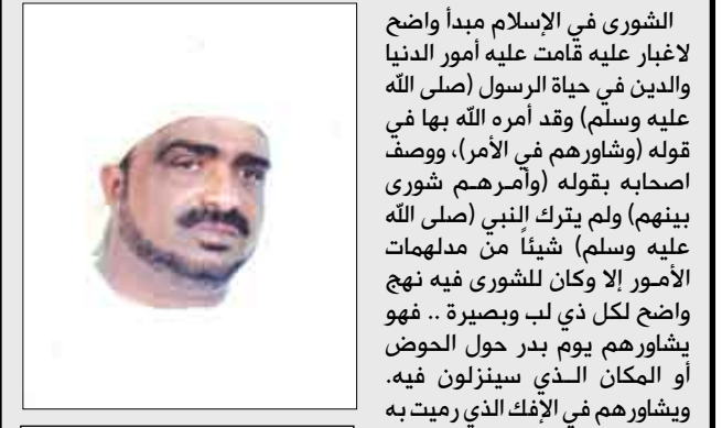
الشيخ / أنيس الحبشي

الشورى في الإسلام مبدأ واضح لا غبار عليه قامت عليه أمور الدنيا والدين في حياة الرسول (صلى الله عليه وسلم) وقد أمره الله بها في قوله (وشاورهم في الأمر)، ووصف أصحابه بقوله (وأمرهم شورى بينهم) ولم يترك النبي (صلى الله عليه وسلم) شيئاً من مدلهامات الأمور إلا وكان للشورى فيه نهج واضح لكل ذي لب وبصيرة .. فهو يشاورهم يوم بدر حول الحوض أو المكان الذي سينزلون فيه . ويشاورهم في الإفك الذي رميت به زوجته أم المؤمنين (عائشة) رضي الله عنها وعن أيتها ويشاور أمته أم المؤمنين أم سلمة رضي الله عنها يوم الحديبية عندما قعد الصحابة عن الحلق ولم يحلقوا ولم ينحروا الهدى فاشارت عليه أم سلمة بأن يبدأ بنفسه فيحلق وينحر فإذا رآه فعل ذلك فعلاً .. لكون الحل من العمرة بسبب الحصر لم يكن معروفاً في مناسك العمرة عند العرب .. وهكذا تستمر الشورى معه - صلى الله عليه وسلم - حتى مرضه الذي مات فيه وأرادوا أن يكتب كتاباً يعترض به المسلمون من بعده عن الضلالة .. وطلب من بعض الصحابة إحصار دواة ليكتبوا له كتابه العاصم من الضلال .. وأبى بعضهم بحجة أنه بلغ به الرجوع أشده ولا يصح أن يرهقهو بالكتابة الآن .. وافق صلى الله عليه وسلم - هذا الفريق وقال: يابى الله والمؤمنون إلا أبى بكر ! واستخدم الصحابة - رضي الله عنهم - الشورى كذلك في شتى مسائل الفقه وهو ما عرف بالاجتهاد الجماعي .. حتى كاد إجماع أكثر الصحابة أو أهل العلم في مسألة ما أن يكون حجة!