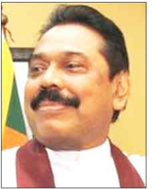
الرئيس ماهيندا رجاياكسي

الرئيسية السيرلانكية لولاية ثانية وتجديد الثقة لكم من الشعب السيرلانكي الصديق. وأنها لفرصة تعبر فيها عن ارتياحنا للعلاقات الثنائية ومجالات التعاون المشترك بين بلدينا الصديقين ونؤكد حرصنا على دفع بها قدماً في الفترة المقبلة نحو آفاق أوسع وبما يخدم المصلحة المشتركة لشعبينا الصديقين. أرجو لفخامتكم التوفيق في أداء المهام الملقة على عاتقكم.. مع التمنيات لكم بموفقو الصحة والسعادة وللعلاقات الصداقة القائمة بين بلدينا وشعبينا الصديقين دوام العناء واضطرار التقدم والأزدهار. مع اسمي اعتباري.