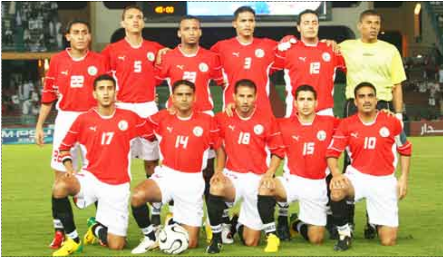
المنتخب الوطني الاول ( الاحمر الكبير )

السودان، الإمارات، ليبيا، وكان المنتخب الوطني الأول لكرة القدم فاز خلال يناير الماضي على نظيره البحريني بثلاثة أهداف من دون رد وخسر بصعوبة من نظيره الياباني بثلاثة أهداف لهدفين ضمن منافسات المجموعة الأولى المؤهلة لنهائيات كأس أمم آسيا التي أحتل فيها المنتخب الوطني المركز الثالث بست نقاط خلف منتخب اليابان والبحرين وتبقى له مباراة واحدة أمام منتخب هونج كونج أخير المجموعة.