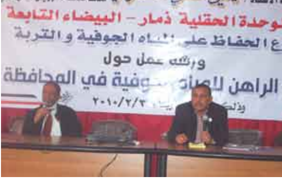
ورشة عمل حول الاستنزاف العشوائي لمخزون المياه الجوفية والتربة

المحافظة "كثيرة تعاون بين السلطة المحلية والبنك الدولي". وقال: ذمار تعني من استنزاف كبير للمياه واستخدامها بشكل عشوائي وعدم وجود وعي لدى المواطنين وأكثر ما يلقاها هو الاستنزاف الذي يهدد الحوض، والمياه التي يتم بها زراعة القات، لذلك نحاول أن نضع للمزارع البديل خلال الفترة الماضية تم اقتلاع القات في عدد كبير من المزارع وتم بدلا من القات محصول البطاطس، لافتاً إلى الوضع الحالي في محافظتي "تجز" واب" الذي جاء حصيلة استنزاف وعدم وعي لدى المواطنين، حد ورشة العمل التي جاءت تحت عنوان "الوقوع الراهن للمياه الجوفية في المحافظة"، بينت الإحصاءات التي قيمتها أن الاستنزاف السنوي لحوض ذمار يصل إلى (181) مليون متر مكعب، منها (66%) في مديرية جهران.