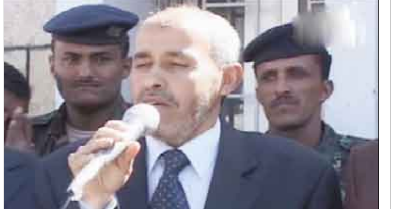
من فعاليات الاحتفال باليوم العالمي للسرطان

السرطان والتي تتضمن عدة محاضرات ومجموعة ندوات توعوية وتوزيع المنشورات الأدبية والنشرات والملصقات وإقامة العديد من الفعاليات، داعياً إلى الدعم والاهتمام بمرضى السرطان باب. حضر الفعالية الاحتفالية العديد من المسؤولين والمهتمين وفريق أعضاء مرضى السرطان التابعين للمؤسسة الوطنية لمكافحة السرطان باب. يعني بالحد من زراعة القات في