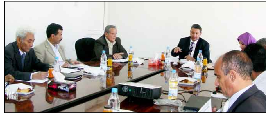
د. الحوشبي في اجتماع مناقشة آلية ومستوى تنفيذ أنشطة مشروع إدارة موارد المجتمع بالضالع

ناقشت لجنة تسيير مشروع إدارة موارد المجتمع بالضالع في اجتماعها أمس بصنعاء برئاسة وزير الزراعة والري الدكتور منصور الحوشبي، مستوى تنفيذ أنشطة المشروع خلال العام الماضي . واستعرض الاجتماع الذي ضم أعضاء اللجنة بحضور أمين عام المجلس المحلي بمحافظة الضالع محمد العتايبي، التقرير الفني والمالي للمشروع للعام 2009م والصعوبات والمعوقات التي واجهت سير تنفيذ أنشطة المشروع، وكذا تقرير بعثة البنك الدولي والصندوق الدولي للتنمية الزراعية (إيفاد) حول الأنشطة المنفذة في العام الماضي . وفي الاجتماع أكد وزير الزراعة والري أهمية مضاعفة الجهود وحل كافة المعوقات والإشكاليات التي تواجه عمل وأنشطة المشروع بما يساهم في دعم التنمية الزراعية بمحافظة الضالع . وشدد على ضرورة تسريع عملية التنفيذ في تلك الأنشطة تحقيقاً لأهداف التنمية الزراعية، والتركيز على تفعيل برامج التنمية لاسيما ما يتعلق بتطوير الثروة الحيوانية والنحل في المحافظة . ولقت الحوشبي إلى أن صندوق تشجيع الإنتاج الزراعي والسمكي أعتمد مبلغ مضاعفة لدعم التنمية الزراعية في محافظة الضالع خلال العام الجاري، بما من شأنه مساندة الجهود المبذولة لحل مشاكل ندرة المياه والجفاف التي تواجه الزراعة في المحافظة . ونوه بأهمية التنسيق مع السلطة المحلية ومكتب الزراعة والري بالمحافظة لتوفير التسهيلات اللازمة لتنفيذ الأنشطة الزراعية المختلفة وإيجاد برامج