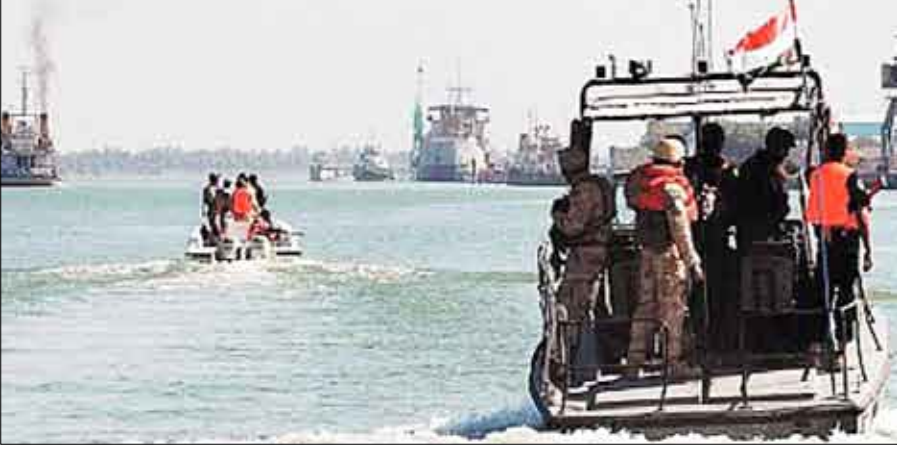
قوات خفر السواحل

منها 9 دول عربية بوفد برئاسة وكيل وزارة النقل للشؤون البحرية والموانئ علي محمد الصبحي، وضم مندوبين من الهيئة العامة للشؤون البحرية وخفر السواحل اليمنية وسفير اليمن لدى جيبوتي محمد عبدالله حجري.