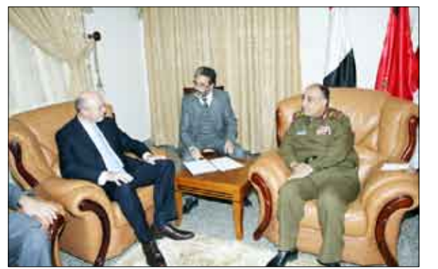
وزير الدفاع مع السفير الفرنسي

صنعاء / سيا - التقى وزير الدفاع اللواء الركن محمد ناصر أحمد أمس سفير الجمهورية الفرنسية الصديقة لدى بلادنا جوزيف سيلفا وممثلي شركة تاليس الفرنسية للاتصالات. وخلال اللقاء جرى بحث أوجه التعاون العسكري وعلاقات الشراكة اليمنية الفرنسية في المجال العسكري خاصة في مجال الاتصالات العسكرية لاستكمال تغطية وتأمين المرحلة الثانية من منظومة الاتصالات العسكرية بالتنسيق مع دائرة الاتصالات العسكرية.