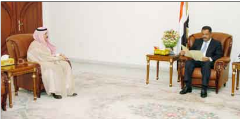
رئيس الوزراء يتسلم رسالة من أخيه ولي العهد السعودي أمس

على تأكيد الدور الجيوي لمجلس التنسيق في تعزيز العلاقات الثنائية.. معرباً عن ثقته بأن الدورة الـ19 بمخارجتها ستعزز من دور المجلس في خدمة وتوطيد العلاقات الثنائية بين البلدين الشقيقين وترجمة توجيهات قيادتهما ممثلين بفخامة الأخ علي عبدالله بن عبدالعزيز رئيس الجمهورية وأخيه جلاله الملك عبد الله بن عبد العزيز ملك المملكة العربية السعودية وكذلك تطلعات الشعبين الشقيقين الجارين في العمل المشترك والمثمر. وتمنّى رئيس الوزراء الموقف السعودي الداعم لمسيره التنمية ووحدة اليمن وأمنه واستقراره.. لافتاً بهذا الخصوص إلى موقف المملكة الداعم لجهود اليمن في مواجهة التحديات خلال اجتماع لندن الأسبوع الماضي.