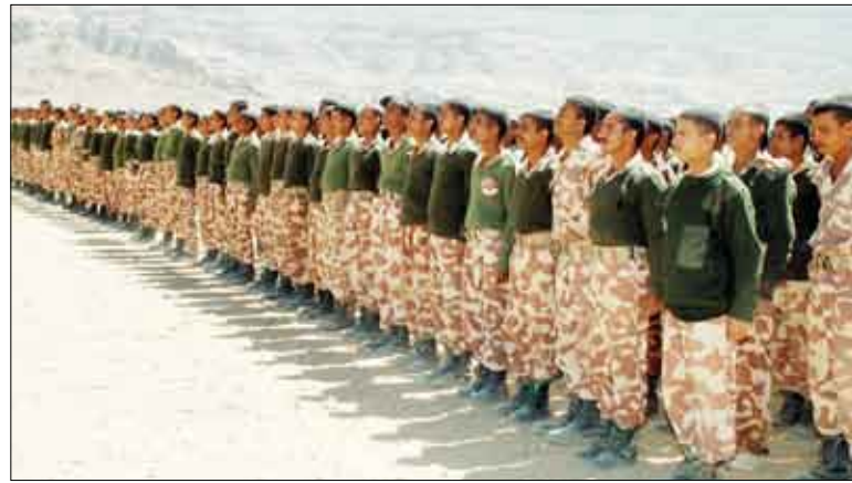
رئيس الجمهورية يتفقد أحد معسكرات القوات المسلحة أمس

بالمزيد من اليقظة والاستعداد ومواصلة بذل العطاء في ميادين الواجب... متمنيا لهم المزيد من التوفيق والنجاح لما فيه خدمة الوطن.