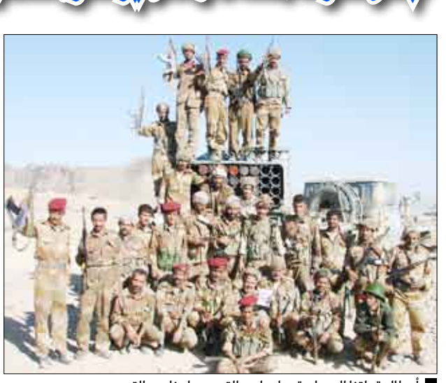
أبطال قواتنا المسلحة يواصلون التصدي لعناصر التمرد