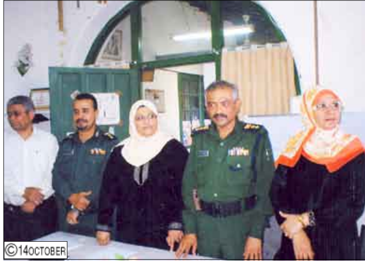
دورة عن الإسعافات الأولية