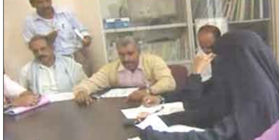
جاناب من المشاركين في اللقاء

والتعليم الفني والتخطيط والتعاون الدولي والصحة العامة والهادفة إلى تقديم الرعاية السجينات والعاملات في السلك العسكري ووضع برنامج لتدريب وتأهيل للسجينات والعاملات في المجال العسكري من قطاع الأمد وتطوير مهاراتهم العملية وتحسين أوضاعهم المعيشية، وإدماج احتياجات السجينات في الخطة التنموية للمحافظة. وقد استمع الحاضرون في اللقاء إلى شرح مفصل عن دور مشروع الحماية القانونية والمناصرة بالمحافظة تجاه المرأة بشكل عام والسجينات منهن خاصة، وكيف يتم حشد الطاقات المناصرة وتأييد قضاياهن وخاصة المعنفات منهن، واستعرض اللقاء النزول الميداني إلى السجن المركزي بزنبار لتفقد السجينات ومعرفة احتياجاتهن في مجالات التغذية والكساء والنظافة والترفيه والصحة والإطلاع على سير إجراءات التقاضي في المحاكم من قبل فريق الدفاع التابع للمشروع. وقد خرج اللقاء بالعديد من التوصيات والمخارج التي تعمل على دعم نشاط مشروع الحماية والمناصرة وتحسين أوضاع السجينات في المحافظة.