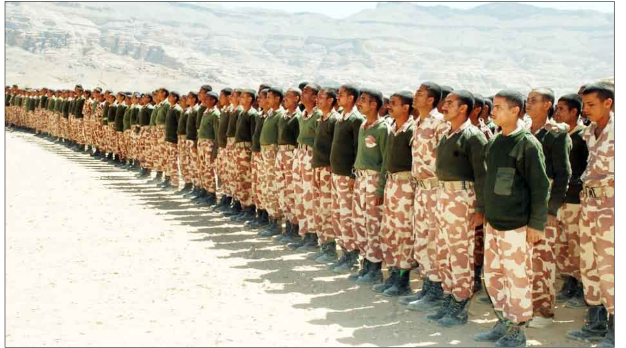
جانب من أبطال القوات المسلحة