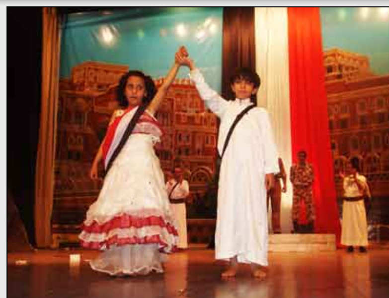
جانب من فعاليات الحفل الخطابي والفني في ختام البرنامج الثقافي والاجتماعي