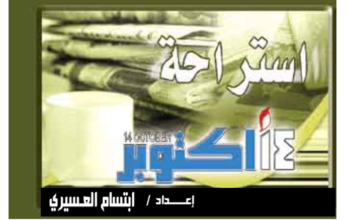
إعداد / إنسام العسيري

لندن / منوعات : دعا أطباء بريطانيون إلى منح اهتمام خاص لحدس الأم في ما يتعلق باحتمال إصابة طفلها بمرض خطير، لافتين إلى أن حدسها غالباً ما يكون صحيحاً. ونقلت صحيفة "ديلي تلغراف" عن الطبيب ماثيو طومبسون من جامعة أوكسفورد قوله "كطبيب عائلة من المهم أن تكون متنبهاً إلى الأهل القلقين بصورة خاصة على ولدهم". وأضاف "يجب أن نثق بحدس الأهل"، مشيراً إلى أنهم اعتنوا بالطفل في السابق خلال الأمراض البسيطة التي أصيب بها ويعرفون متى يصبح الوضع مختلفاً.