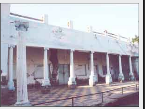
مبنى التنس العدني

هذا المشروع، كما ان النزول المستمر من قبل قيادة وأعضاء المجلس المحلي بمديرية صيرة للمشروع أعلى دوراً معنوياً للإسراع لكي ينفذ المشروع قبل انتهاء هذا العام وقبل خليجي (20) .. وليكون بمثابة هدية للاعبين ومحبي لعبة التنس الأرض العدني.