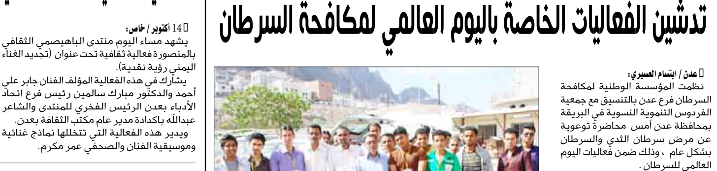
جانب من الشباب المشاركين في توزيع مطويات توعوية عن السرطان