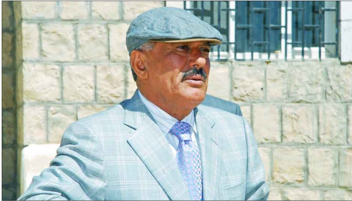
رئيس الجمهورية يلقي كلمة في أحد المعسكرات