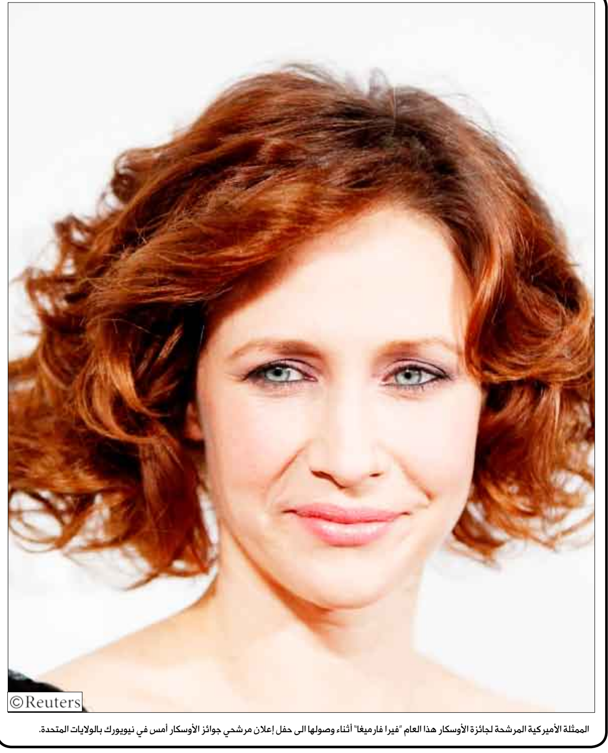
الممثلة الأميركية المرشحة لجائزة الأوسكار هذا العام "فيرا فارميجا" أثناء وصولها الى حفل إعلان مرشحي جوائز الأوسكار أمس في نيويورك بالولايات المتحدة.

تغر / غلام خالد، شهدت جمعية الإحسان الخيرية فرع تعز أمس انتخابات موسعة لأعضاء مجلس إدارة الجمعية والتي تأتي امتداداً للانتخابات السابقة التي أجرتها في عام 2007م، بالإضافة إلى تأكيدها أيمداً الشورى والشايقية التامة والتعاون على الحق وذلك بحضور مندوب مكتب الشؤون الاجتماعية مدير إدارة الجمعيات بالمكتب عبده علي محمد . وبعد قراءة المصادق والحسابات المالية للجمعية للفترة السابقة من قبل المسؤول المالي السابق للجمعية فتح باب الترشيح والتنافس بين الأعضاء لانتخاب أعضاء لمجلس إدارة فرع الجمعية بتغر حيث تم انتخاب نبييل القاضي رئيساً للجمعية بالإجماع كما تم معه انتخاب عبدالله هزاع الصلوي أميناً عاماً لفرع الجمعية.