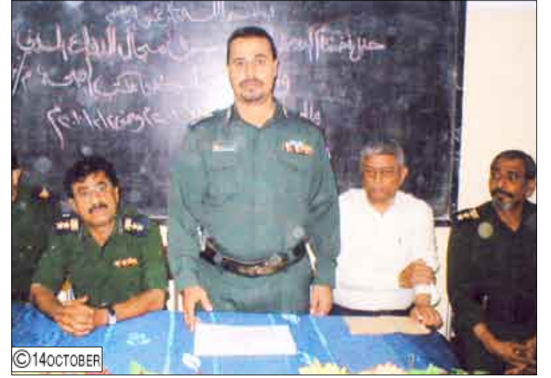
من فعاليات ختام دورة الدفاع المدني

تأتي هذا العام تحت شعار "طب الكوارث" وفي إطار الاحتفاء بفعاليات العيد (19) لليوم العالمي للدفاع المدني. وفي اختتام الدوريتين تم توزيع الشهادات التقديرية على المشاركين فيهما.