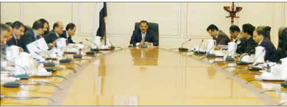
اجتماع لجنة العليا للطاقة برئاسة رئيس الوزراء أمس

ناقشت اللجنة العليا للطاقة في اجتماعها أمس برئاسة رئيس مجلس الوزراء الدكتور علي محمد مجور عدداً من المواضيع المدرجة في جدول أعمالها منها موضوع الشراكة مع القطاع الخاص في إنتاج الطاقة الكهربائية وإعادة جدولة أولويات المؤسسة العامة للكهرباء والتركيز على ترشيد الإنفاق وتطوير آلية تقليل الفاقد من الطاقة على مستوى أمانة العاصمة وبقية المحافظات. وأكدت اللجنة أهمية الاستعانة