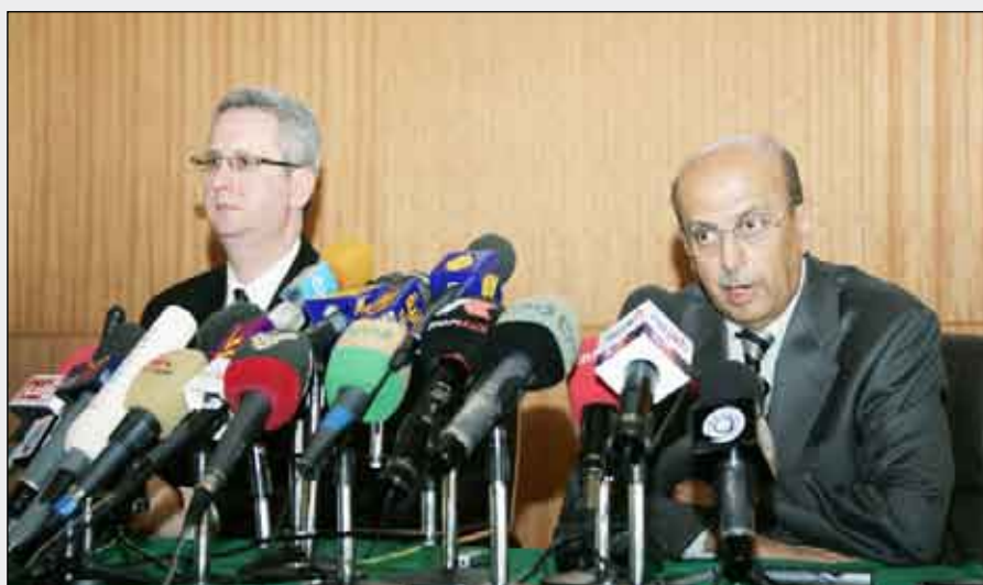
■ وزير الخارجية و وزير الدولة للشؤون الخارجية البريطاني في المؤتمر الصحفي