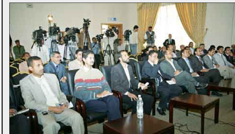
■ جانب من الحضور