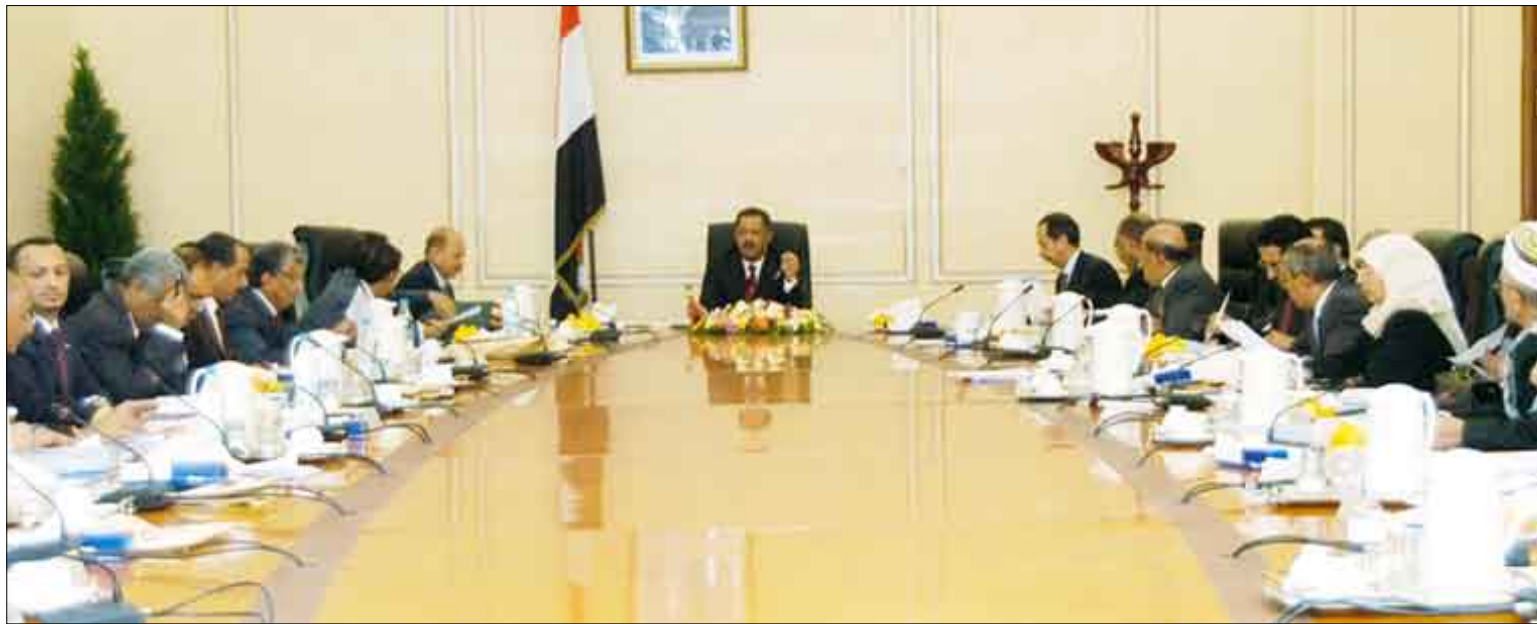
■ مجور يترأس اجتماعاً لمجلس الوزراء أمس