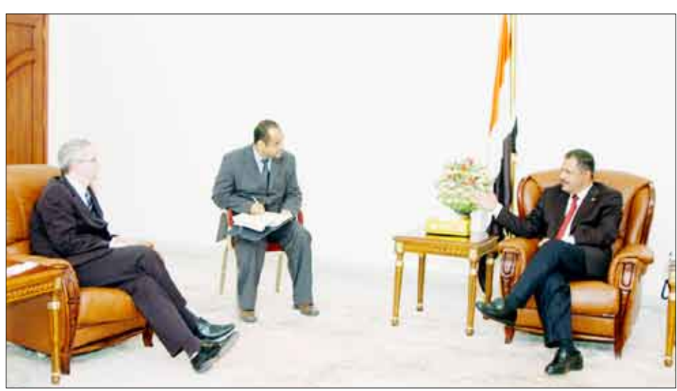
د. مجور يستقبل وزير الدولة للشؤون الخارجية البريطاني

علاقات الصداقة اليمنية البريطانية وتناميها المضطرب في كافة المجالات. منوها بالإسهامات البريطانية في دعم مسيرة التنمية في اليمن. جرى خلال اللقاء استعراض إجراءات تنفيذ نتائج اجتماع لندن لمساندة جهود اليمن في مواجهة كافة التحديات، بما في ذلك الترتيبات الخاصة بمؤتمر المانحين لليمن من الدول الشقيقة