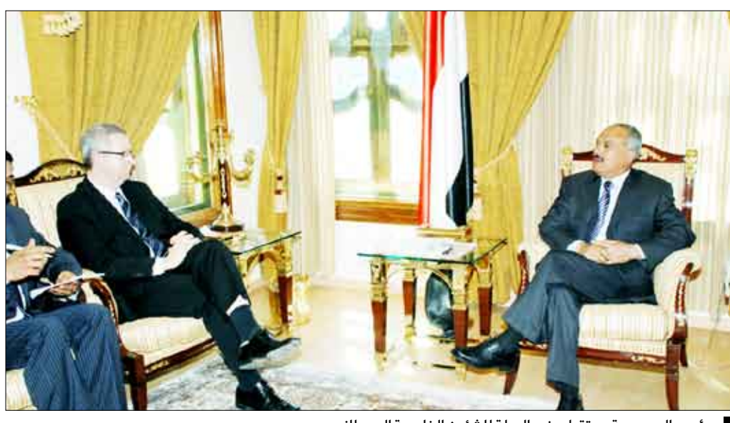
رئيس الجمهورية يستقبل وزير الشؤون الخارجية البريطاني

استقبل فخامة الرئيس علي عبدالله صالح رئيس الجمهورية أمس وزير الشؤون الخارجية البريطاني إيفان لويس الذي نقل لفخامته تحيات رئيس الوزراء البريطاني جوردن براون وتمنياته له ومفطور الصحة والسعادة وللشعب اليمني دوام التقدم والإزدهار. وجرى خلال المقابلة بحث جوانب العلاقات الثنائية ومجالات التعاون المشترك بين البلدين الصديقين وسبل تعزيزها وتطويرها بالإضافة إلى بحث نتائج اجتماعات لندن لدعم اليمن والترتيبات الخاصة باعتماد مؤتمر المانحين لليمن من الدول الشقيقة والصديقة في الـ 22 من فبراير الحالي في الرياض وكذا آلية عمل مجموعة أصدقاء اليمن. وقد أشاد فخامة الرئيس بدور بريطانيا في الدعوة إلى اجتماع لندن والتحضير الجيد له والخروج منه بتلك النتائج الإيجابية التي تعزز من شراكة اليمن مع أشقائه وأصدقائه في مجال التنمية ومكافحة الإرهاب .. منوها بالدعم البريطاني لليمن ومسيرته التنموية وجهوده في مكافحة الإرهاب. كما أشاد بما تشهده العلاقات اليمنية البريطانية من تطور مضطرب على مختلف الأصعدة ..