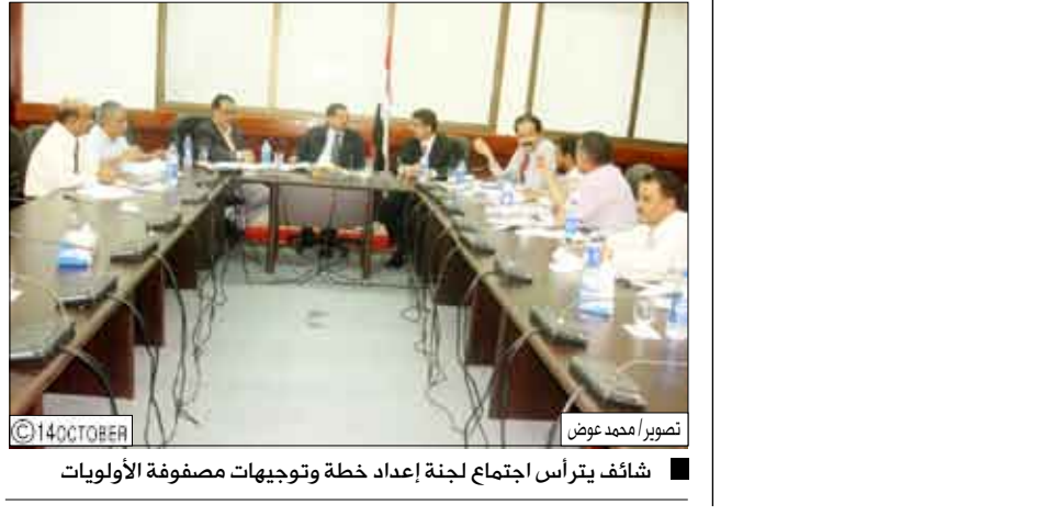
شائف يترأس اجتماع لجنة إعداد خطة وتوجهات مصفوفة الأولويات

وناقشت اللجنة في اجتماعها توجهات لجنة إعداد خطة تنمية في الميناء والمنطقة الحرة والمطار والبنية التحتية وتنويع اقتصاديات المدينة وذلك بغرض تحسين مستوى معيشة سكان محافظة عدن، بالإضافة إلى خلق فرص عمل تتوافق وتلائم مع التوجهات الإستراتيجية لمحافظة عدن التي أعدت رؤية ورسالة للنمو الاقتصادي المحلي لعام 2003م بالتعاون والتنسيق مع البنك الدولي بهذا الشأن، حيث أن هناك حوالي أكثر من "52" مشروعاً لأكثر من "19" قطاعاً في المحافظة سوف تترجم هذه التوجهات إلى واقع