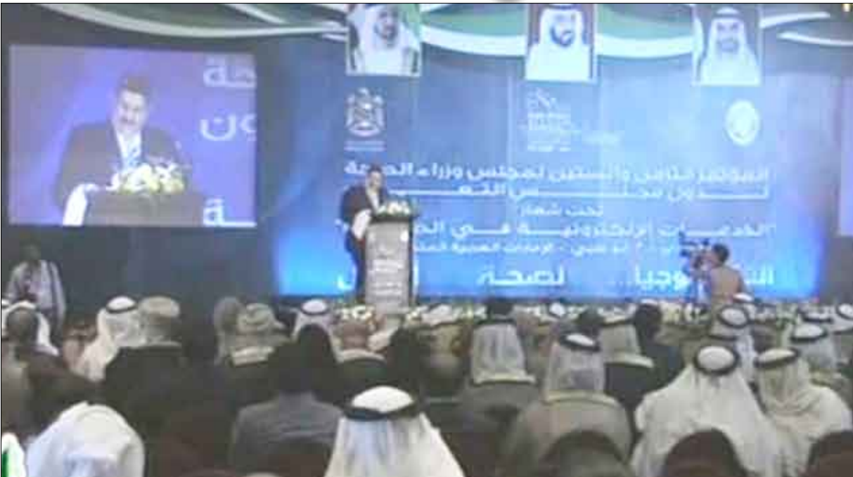
د. راصع في افتتاح مؤتمر وزراء صحة مجلس التعاون الخليجي