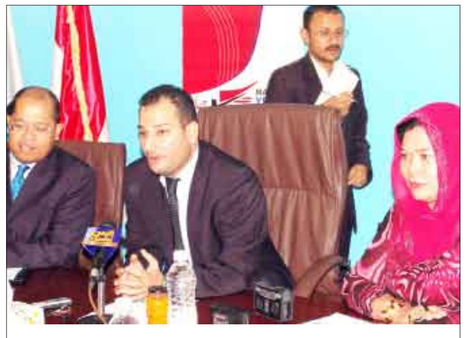
رئيس الهيئة العامة للاستثمار في المؤتمر الصحفي بصنعاء أمس

الماليزيين الذين لهم اهتمامات في مختلف القطاعات، وسيكون هناك عرض من قبل الهيئة والجهات الحكومية لبعض الفرص الاستثمارية في بعض القطاعات الواعدة وسكون هناك جلسة توافقات بين القطاع الخاص اليمني والمستثمرين الماليزيين بغية الخروج بمشاريع مشتركة. من جانبه أكد السيد/ عبد الصمد بن عثمان السفير الماليزي بصنعاء أهمية المهرجان الذي يعتبر أكبر حدث تنظمه ماليزيا في اليمن في الجانب الاستثماري. وأوضح أن الهدف الرئيسي من المهرجان هو تعزيز العلاقات الثنائية وتقوية العلاقات التجارية بين البلدين. وأعرب عن شكره للحكومة اليمنية وهيئة الاستثمار ووزارة الصناعة والتجارة في اليمن على ما قاموا به لخلق هذا الحدث الكبير، داعيا المستثمرين اليمنيين القدامى إلى ماليزيا والمشاركة في تحسين وتقوية الروابط وخاصة في مجال الخبرات وتعزيز التعاون بينهم وبين نظرائهم الماليزيين وخلق شركات ومؤسسات تضامنية بين البلدين.