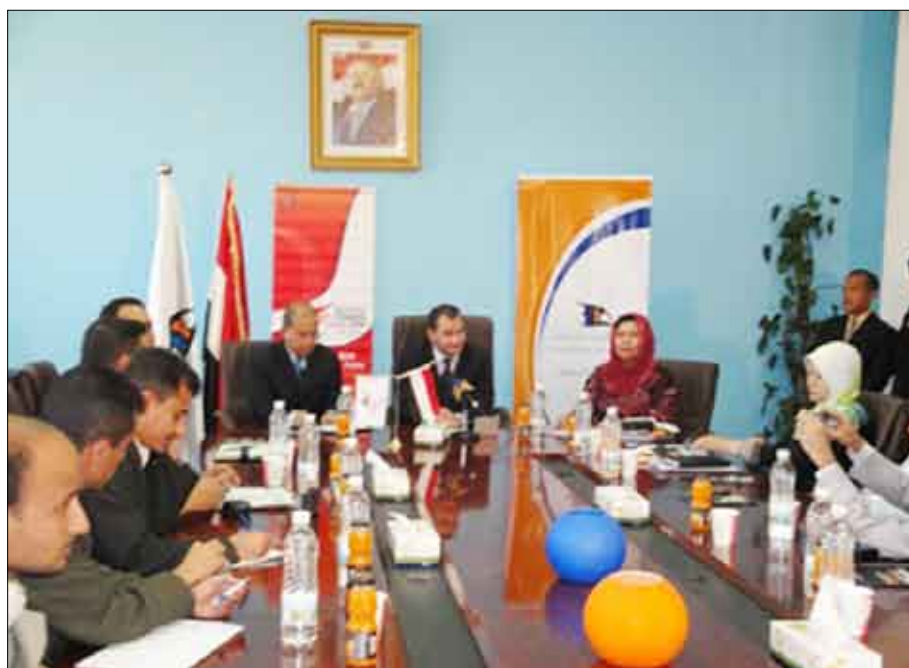
جانب من المشاركين في المؤتمر الصحفي