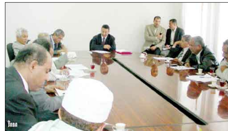
وزير الزراعة يترأس اجتماعاً لمديري ومسؤولي المحاجر البيطرية

الوزارة وفقا للمعايير الدولية مع توفير كافة الإمكانيات والمستلزمات لتنظيم استيراد المواشي للحفاظ على الثروة الحيوانية ومكافحة التهريب. ولفت إلى أهمية إجراء الحجر الصحي والبيطري للمواشي لا سيما المستوردة لتتأكد من خلوها من الأمراض والأوبئة التي تنتقل عبر الحيوان بشكل سريع من بلد إلى آخر. واعتبر الدكتور الحوشبي المحاجر البيطرية خط الدفاع الأساسي لحماية الثروة الحيوانية في اليمن والتي يعول عليها في تأمين الغذاء ومصادر الدخل لمعظم الأسر في الريف. حضر الاجتماع وكيل وزارة الزراعة والري لقطاع الخدمات الزراعية الدكتور محمد النشم ومدير عام الصحة الحيوانية والحجر البيطري بالوزارة الدكتور منصور القدسي وعدد من مديري عموم مكاتب الزراعة بالمحافظات.