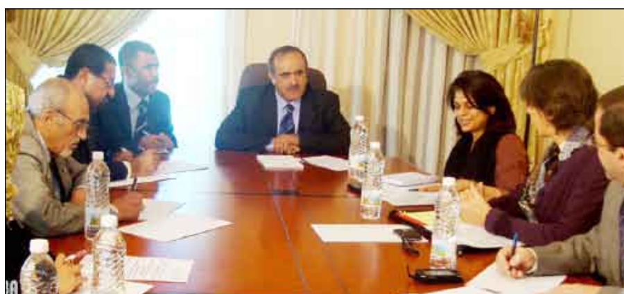
الكلاحي يترأس اجتماع الوحدة التنفيذية لإدارة مخيمات النازحين في صنعا

حتى يتم اعتماد معونها من قبل الوحدة التنفيذية المكلفة بإيواء النازحين وشركائها من المنظمات الدولية والمحلية الإنسانية على أن يجري خلال الأيام القادمة اعتماد المعايير المطلوبة الكفيلة بتوضيح الحقوق التي يجب أن يحظى بها النزاح فور وصوله إلى مراكز الاستقبال ومخيمات الإيواء. وشدد المجتمعون على المنظمات والجمعيات التي تضطلع بمهمة توفير الخدمات الإنسانية والإيوائية للنازحين بمختلف المناطق رفق الوحدة التنفيذية بتقاريرها الدورية التي توضح حجم معونها الغذائية التي تقدمها للأسر النازحة وأماكن تجمعهم. ولتتمكن الوحدة من بناء قاعدة بيانات ومعلومات كاملة وواضحة قادرة على تشخيص الاختلالات ومعرفة جوانب الضعف في عملية الإيواء بشكل عام. وناقش الاجتماع إمكانية الدعم والمساعدة التي يمكن أن يقدمها مكتب الأمم المتحدة والمفوضية السامية لشؤون اللاجئين بالأمر المتحد لإدارة الوحدة التنفيذية الخاصة في مجال بناء القدرات الذاتية للعاملين وجمع المعلومات والبيانات. وأعرب وزير الدولة لشؤون مجلسي النواب والشورى رئيس الوحدة التنفيذية عن شكره وتقديره لما يقدمه مكتب الأمم المتحدة بصنعا والمنظمات الدولية العاملة في إطاره من جهود حثيئة ومساعدات إنسانية للنازحين في مختلف المناطق.